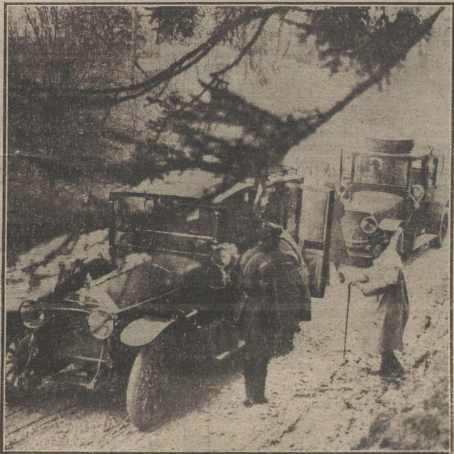
El Presidente de la República francesa durante su última visita al frente del

Aparte esta tan elemental, de que necesitamos que haya pobres para bien de nuestra alma, hay otras razones que nos abonan á los que ayer les echamos de menos en la Pradera: nuestro amor á lo típico, á lo español, á lo castizo... Barcelona, con ser Barcelona, posee—además de las estupendas colecciones de las puertas de los templos—unos pobres muy lisiados, bastante desarrapados y, desde luego, extraordinariamente conmovedores, que se sitúan alrededor de las plazas de toros en días de corrida. ¡Y luego dirán