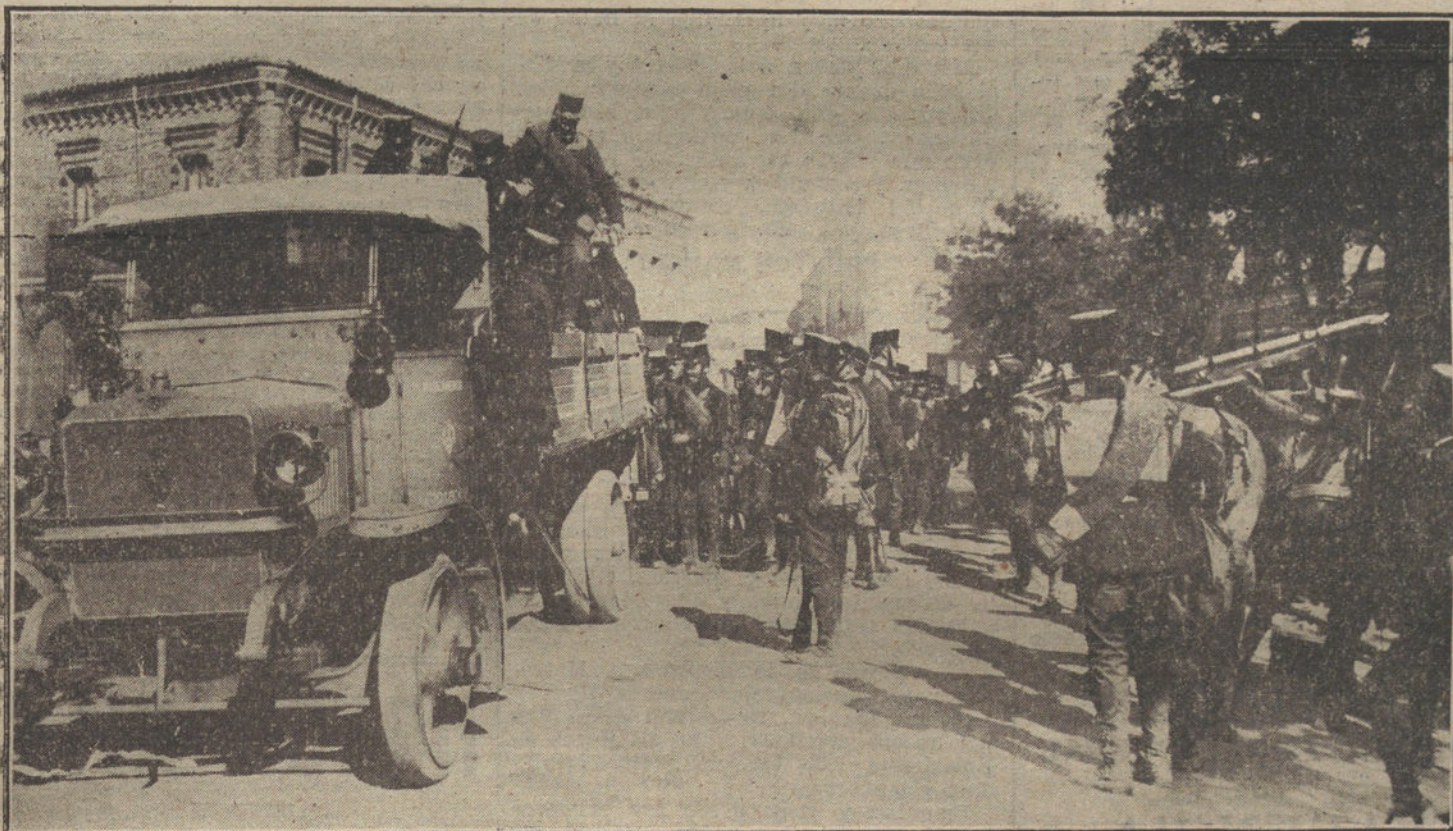
LAS MANIOBRAS MILITARES DE ARGANDA.—Simulacro de avance utilizando los camiones automóviles para el transporte de tropas y el material de guerra.

Doña Concha dió orden de que se avisara el fuego y se arreglaran las habitaciones para dormir aquella noche, y entre el guarda, el hortelano y Anselmo, ayudados de las mujeres é hijas de los dos primeros, quedó todo dispuesto para albergar dignamente á los ocho señores y seis señoras que componían la cabalgata madrileña.