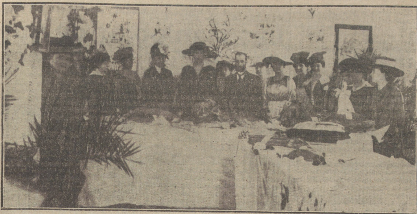
SS. MM. las Reinas Cristina y Victoria visitando la Exposición de labores organizada por la revista «La Mujer en su Casa».