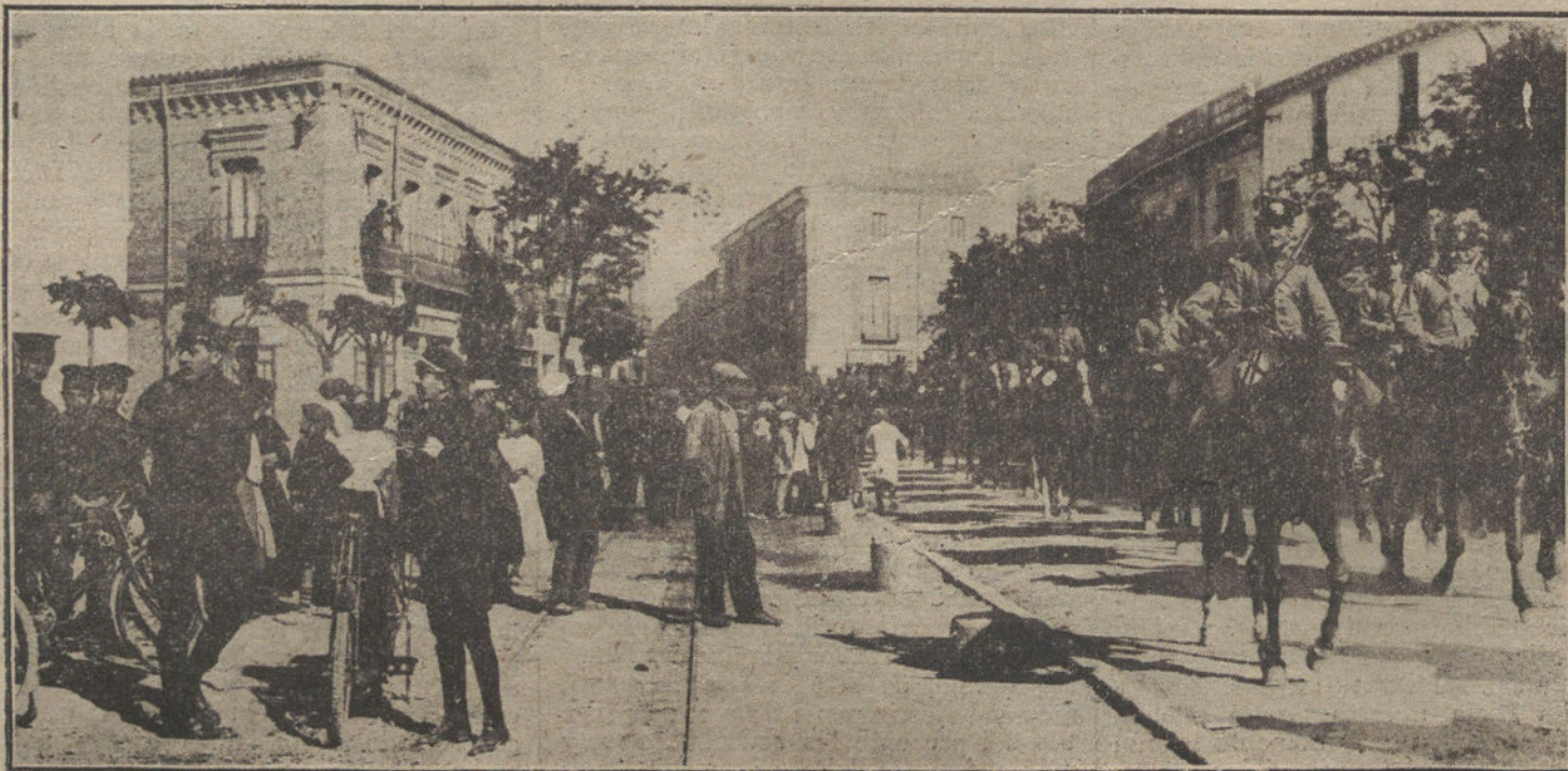
LAS MANIOBRAS MILITARES DE ARGANDA.—Paseo de la Caballería por el pueblo de Valdecas.

La dirección artística piensa rendir fervoroso tributo de admiración á los músi-