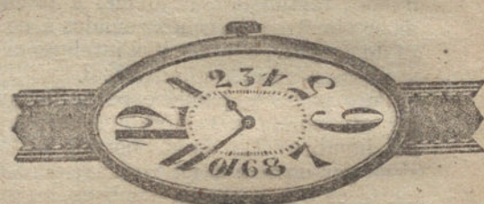
Núm. 5.—Forma ovalada alargada, áncora de precisión, con pulsera de moiré. En oro de ley 18 quilates... 165 ptas. En oro chapeado americano... 75 » En plata de ley... 70 »