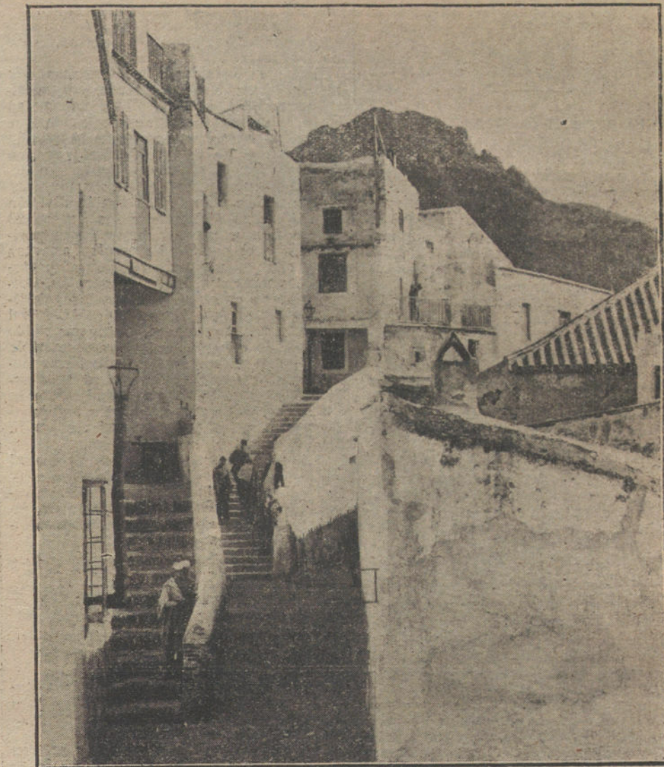
LAS POSESIONES ESPAÑOLAS EN EL NORTE DE AFRICA.—Vista parcial de la única calle del Peñón de Vélez de la Gomera.

Únicamente mediante un esfuerzo enorme de la voluntad—del que no todos son capaces—puede un artista ó un pensador, conservar íntegramente su pureza ideológica. ¿Pero cuántos hombres hay capaces de renunciar a