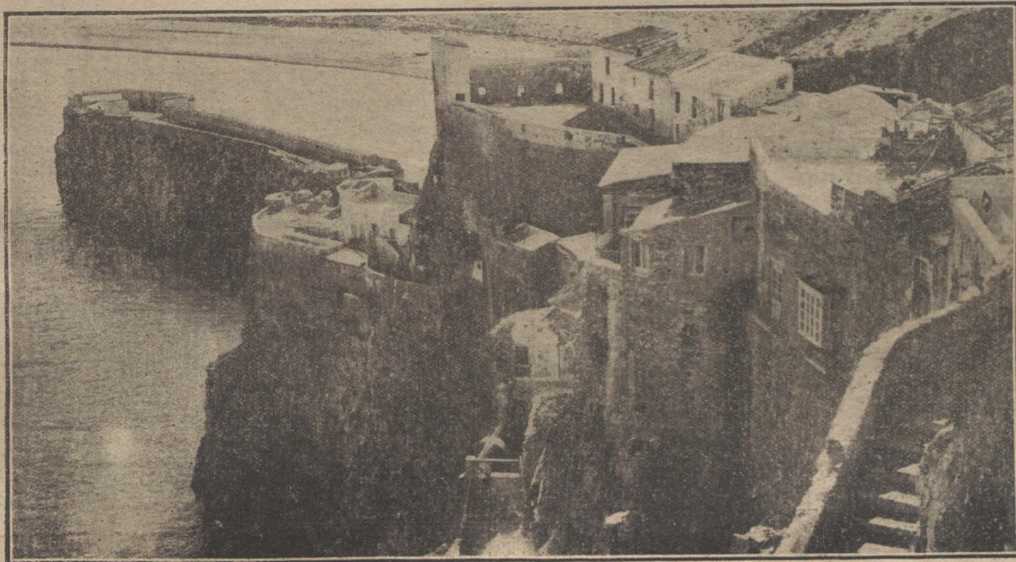
LAS POSESIONES ESPAÑOLAS EN EL NORTE DE AFRICA.—Vista parcial del Peñón de Vélez de la Gomera, y al fondo, la playa del campo moro.

NO SE DEVUELVEN LOS ORIGINALES GRAFICOS NADA MAS QUE EN EL CASO EN QUE PREVIAMENTE HAYAN SIDO ADQUIRIDOS CON ESA CONDICION.