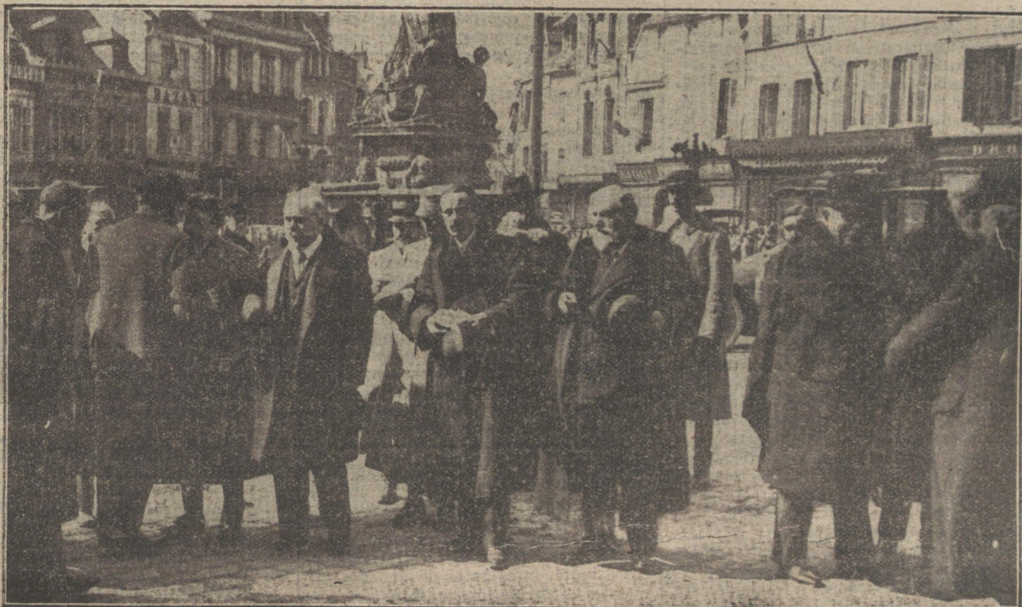
LA LUCHA EN FRANCIA.—El Presidente de la República, durante su visita a la ciudad de Noyón.

Además, si el «Patricio», que hacia rumbo al Norte, fué atacado por babor, mal pudo recibir la granada por la banda opuesta.