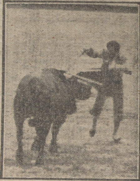
Cochero matando a su primer toro.

Cuelgan los escribientes de turno cuatro pares de las calientes, y Silveti