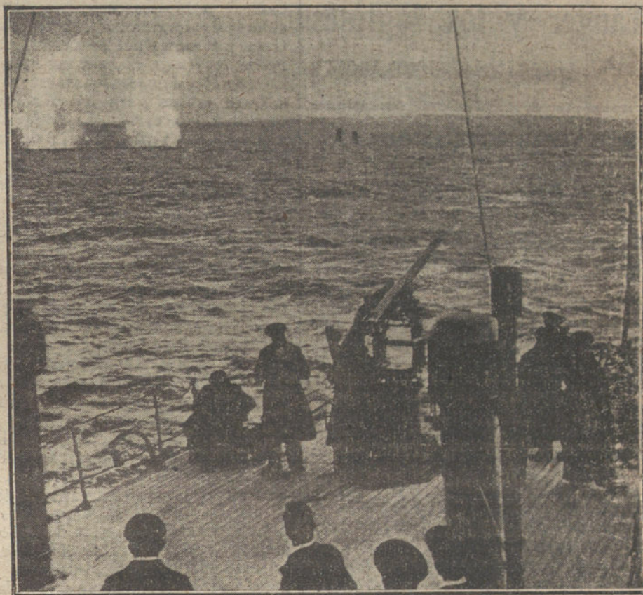
LA ACCION SUBMARINA.—Barco de la Marina francesa, haciendo practicas contra los submarinos.

barca «Amalia», que el día anterior había prestado heroico auxilio a unos naufragos.