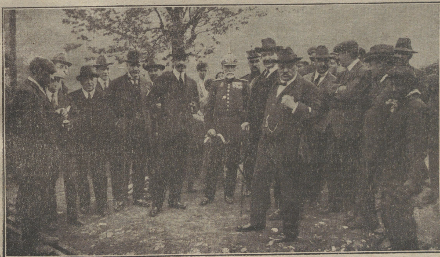
El ministro de Fomento, acompañado de las autoridades de Oviedo, durante su visita a la cuenca minera de Asturias.