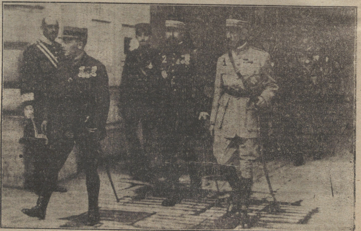
Los generales Lyautey (1) y Gouraud (2) al salir esta tarde de Palacio, después de haber almorzado con S. M. el Rey.

NUMERO DEL TELEFONO DE LA ADMINISTRACION DE «LA TRIBUNA» (PLAZA DE CANALEJAS, 6), 5.551