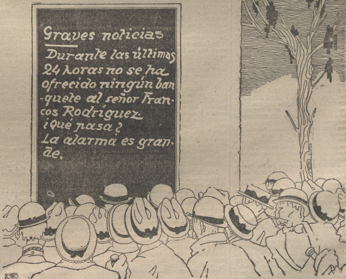
[Caricatura de K-HITO.]

Puedo asegurarle que la marcha de Geoffray está relacionada con los pla-