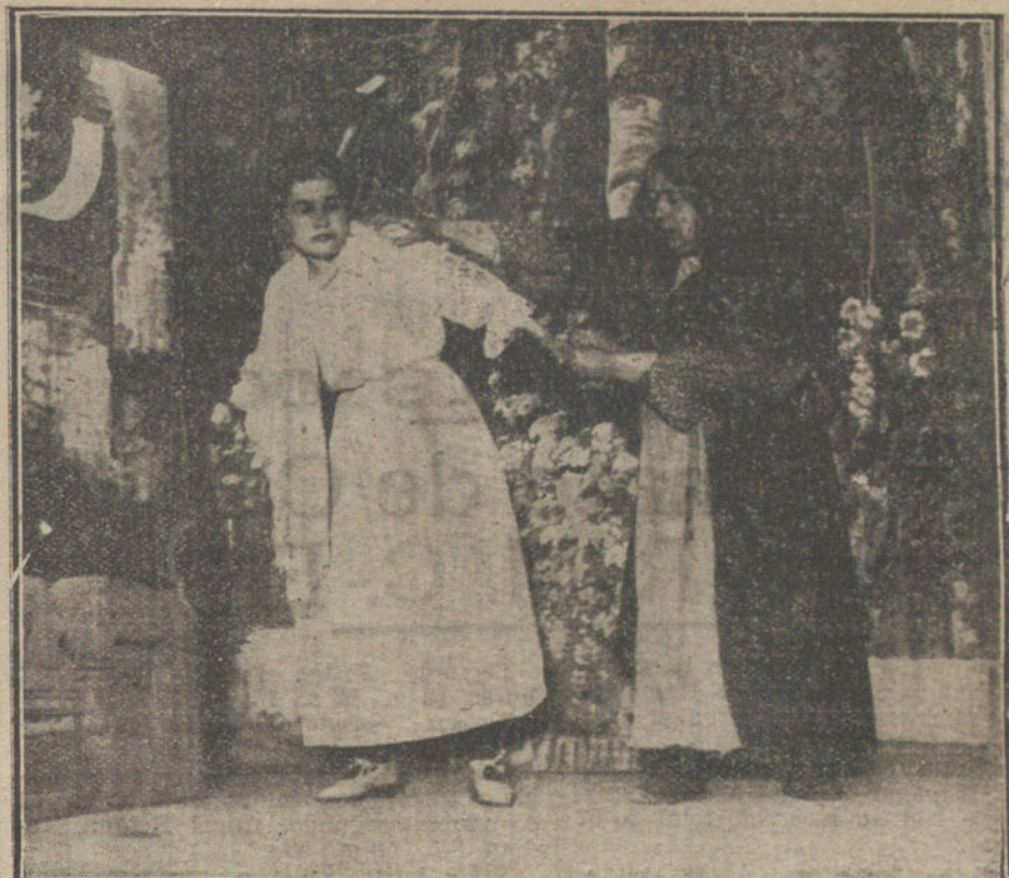
Una escena del drama «La deuda», de Martí Orberá, estrenado anoche en el teatro de la Infanta Isabel.