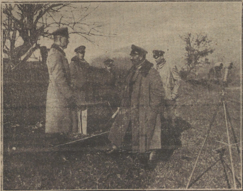
LA LUCHA EN LOS BALKANES.—El general Krafft, jefe del Cuerpo húngaro en el teatro de operaciones de Rumania.

La construcción de esta línea asume enorme importancia para la región, ya que facilitará el transporte de productos y favorecerá el «sport» alpinista, con fáciles excursiones á la sierra. Las obras comenzarán en breve.