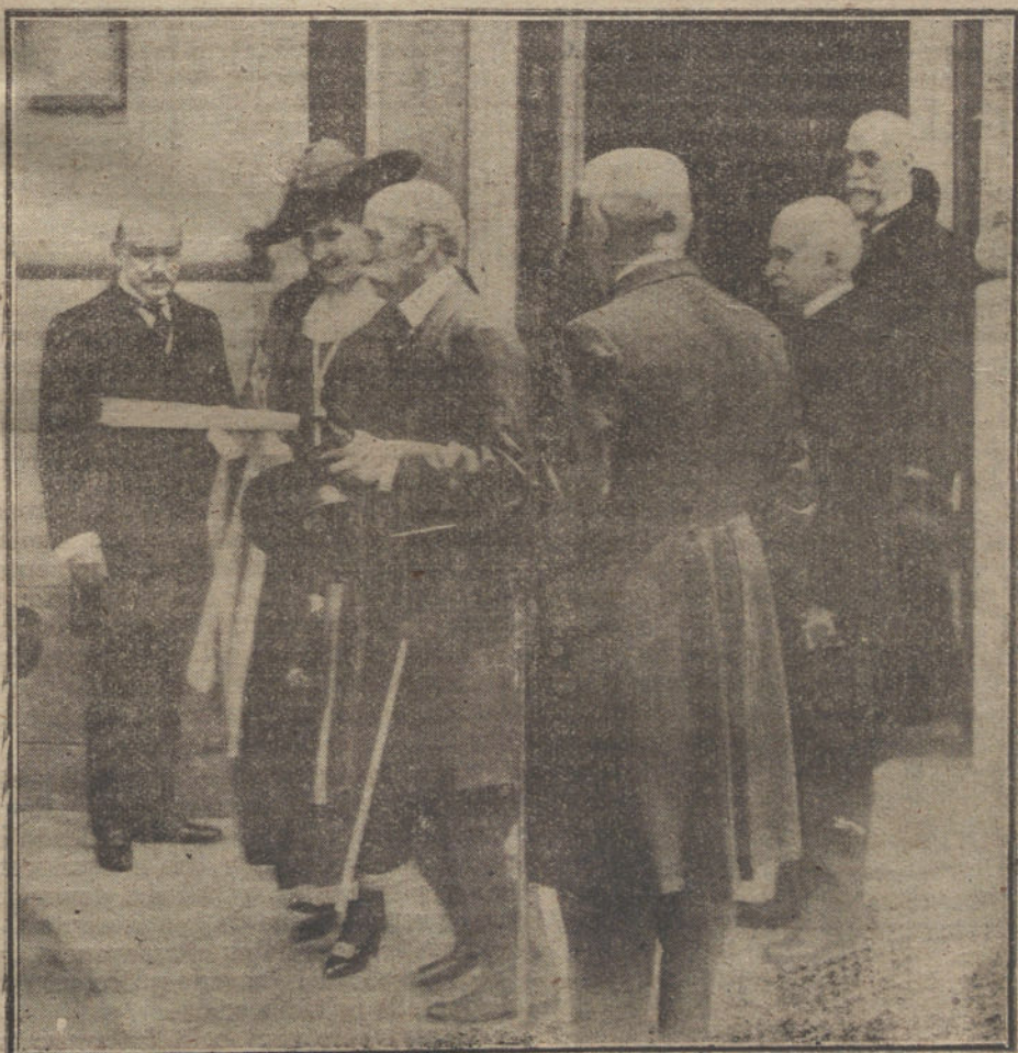
S. M. Doña Victoria saliendo de visitar la Exposición de telas antiguas, que la Sociedad «Amigos del Arte» ha instalado en el Palacio de la Biblioteca Nacional.

Reina gran indignación contra los agentes á sueldo de los aliados, que pretendieron turbar el orden, y sin distinción de categorías, toda la población está preparada á rechazar la primera manifestación intervencionista que se hiciera, aunque es seguro que no se repetirán casos como el del otro día.