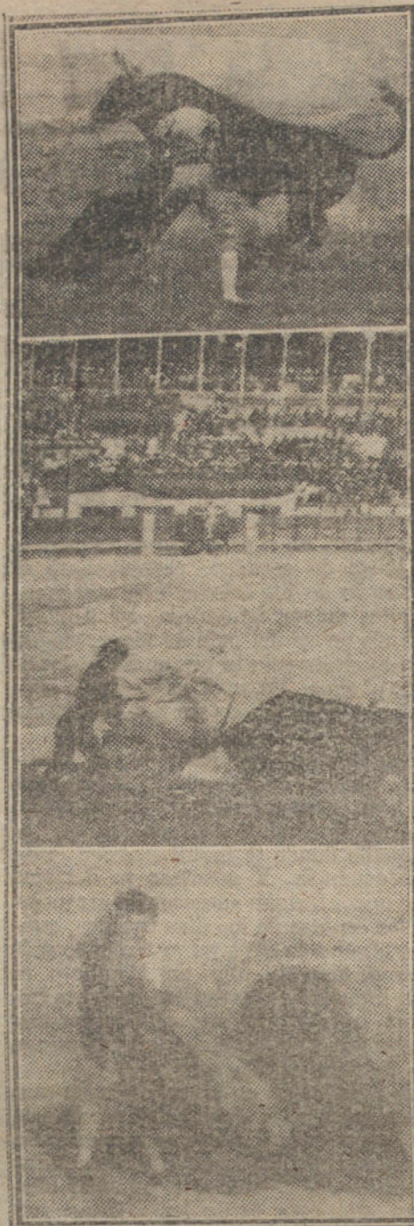
LOS TOROS DE ESTA TARDE.—1, Calito pasando de muleta; 2, Flores toreando de capa; 3, Belmonte rematando un quite.

echaba carne abajo. (Palmas de los amigos y protestas de los partidarios del honrado volapié.)