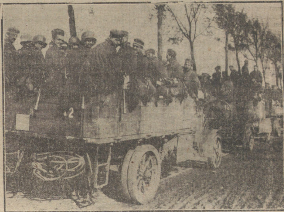
LOS ALEMANES EN LA GUERRA.—Transporte de tropas hacia la línea de fuego.

Se habla á la vez, de los planes de los aliados, para implantar una nueva forma de Gobierno en España, más en armonía con nuestros vecinos portugueses y franceses, de la unión de las izquierdas españolas, para desviar á la opinión hacia la guerra (cuyo primer acto de audacia será el mitin de la Plaza de Toros), y de las agitaciones populares, ya por medio de huelgas, ya por motines con cualquier pretexto.