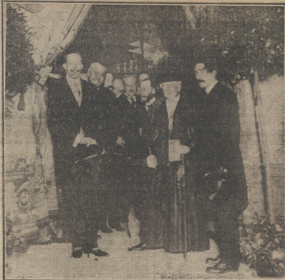
LA EXPOSICION DE TELAS ANTIGUAS.—Don Alfonso y Doña Isabel en el acto de la apertura.

PARIS. El periódico socialista «Volkrecht» cree que Fritz Adler no será ejecutado, fundado en que durante diez años, de 705 condenas á muerte el Emperador ha ejercido su prerrogativa imperial, conmutando la pena á 703.—Hallet.