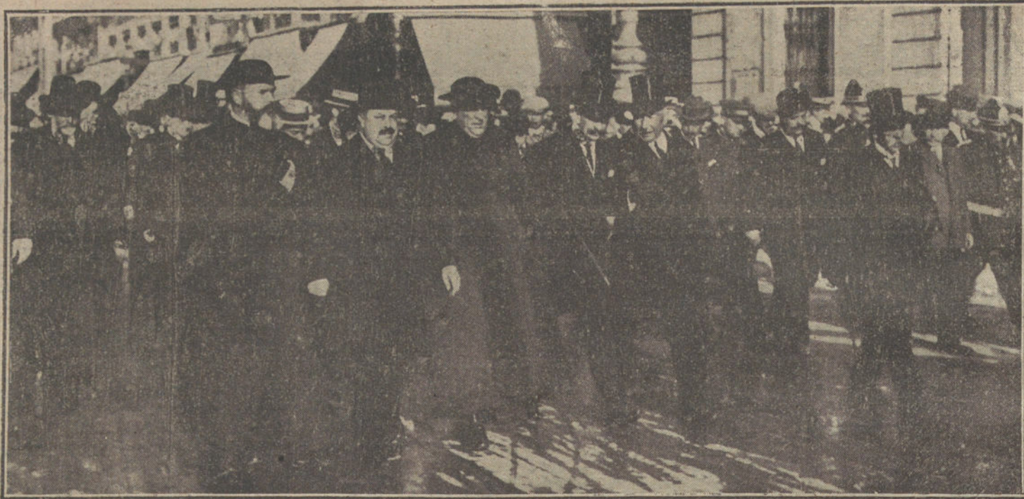
MANIFESTACION DE DUELO.—Presidencia del entierro de la madre del Sr. García Alvarez, muerta trágicamente a consecuencia de un accidente de ascensor.

Por efecto del golpe, el desdichado Francisco perdió el sentido y cayó al