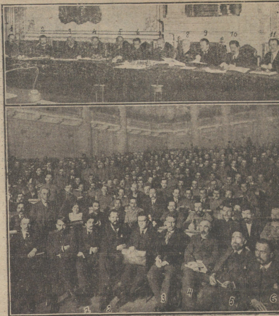
LA REVOLUCION RUSA. —Reunión del Gobierno provisional, del que forman parte V. Nohorof, secretario general del Consejo (1); Stchepkine, Interior (2); Makonilof, Instrucción pública (3); Godnef, secretario de Estado (4); Tereschenko, Hacienda (5); Kerensky, Justicia (6); Principa Lvof, Presidencia (7); Miliukof, Negocios Extranjeros (8); Nekrassof, Comunicaciones (9); Chingaref, Agricultura (10); Konovalof, Comercio é Industria (11).—Abajo: Constitución del Congreso de diputados, obreros y soldados. En primer término Steklor, jefe de los nacionalistas (1); Bogdonof (2); Skobelef, vicepresidente de la Cámara (3); Plekhanof (4); Tchédre, presidente (5), y Tzeretelli.

De pronto se estremece la tierra; los cristales de la cabina irrumpen su estoica inmovilidad, agitando en nerviosas convulsiones; un humo denso y caliginoso lo envuelve todo por completo. La serpiente de acero, arrastrándose con su habitual estrépito, ensordeciendo el silencio con su incesante quejido y vomitando al espacio densas nubes de la caseta. Después, poco á poco, con la lentitud que transcurren los minutos en el reloj, va disminuyendo el estruendo hasta dejar de percibirse del todo. El gigante