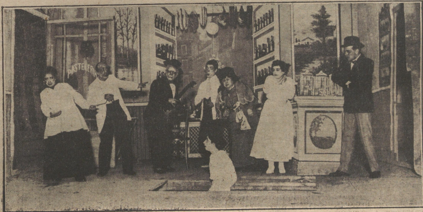
Una escena de «La tarasca del barrio», zarzuela que se estrena esta noche en el teatro de Novedades.

Cuelga el auricular, y se vuelve á mirar á Elvira, con una expresión indefinida de dolor, de desaliento, de angustia mortal. El timbre del aparato eléctrico, al agitar