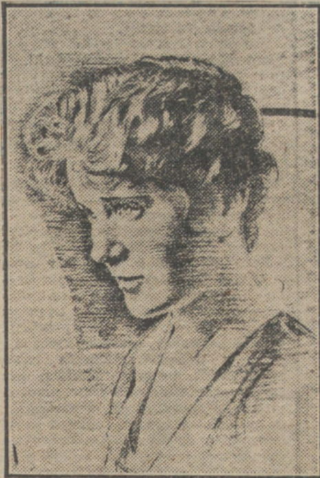
FIGURAS DE LA CINEMATOGRAFIA.—Mae Marsh, genial artista norteamericana, que ha obtenido éxito extraordinario en cuantas películas ha tomado parte.