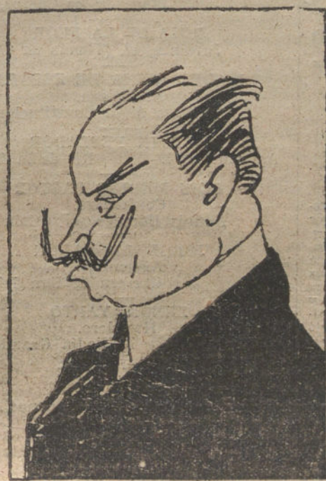
FIGURAS DE LA CINEMATOGRAFIA.—El notable director italiano Mario Caserini.