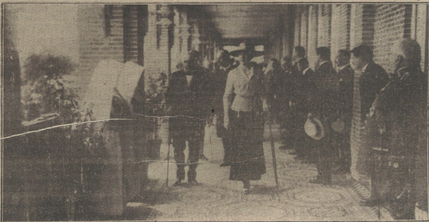
S. M. la Reina Victoria visitando el Sanatorio.