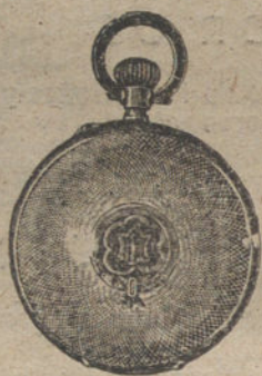
Núm. 5.031. — Ptas. 100.