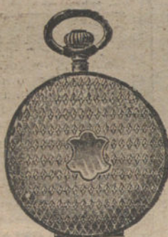
Núm. 5.029. — Ptas. 80.