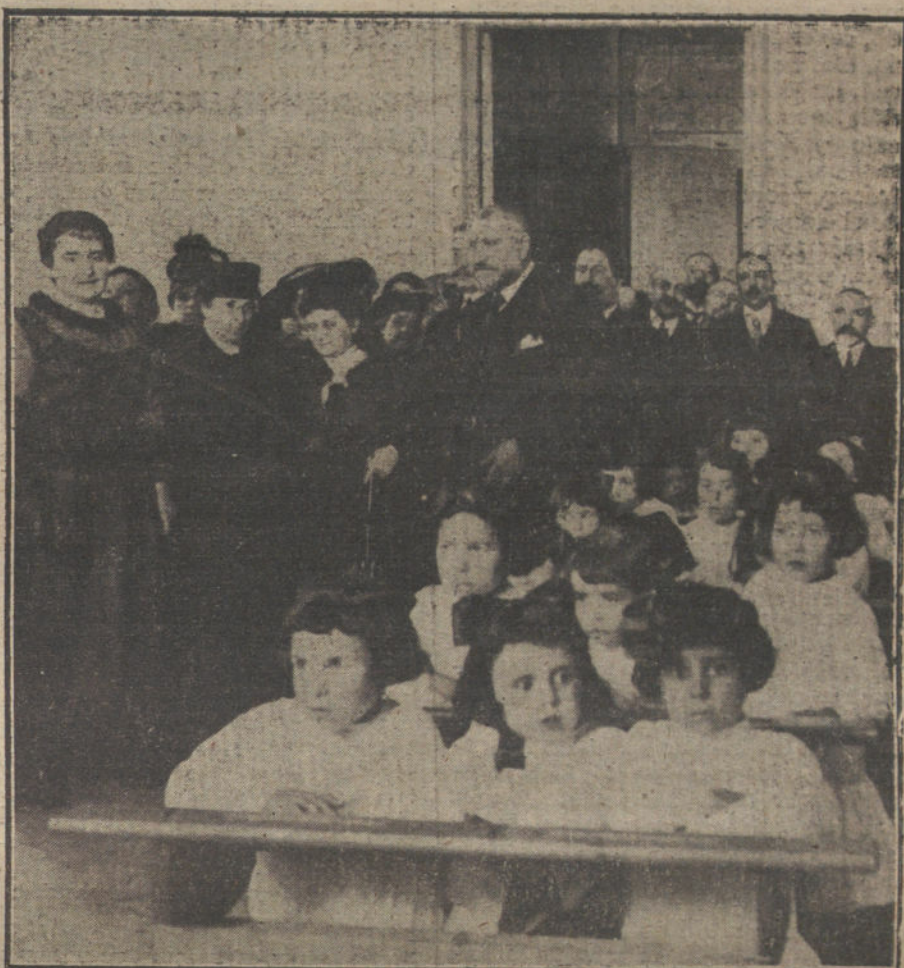
La condesa de San Rafael, con el ministro de Instrucción pública y el alcalde de Madrid, durante la visita que hicieron ayer tarde al Colegio del paseo de las Acacias.

Pertenecen esos hombres a la generación del desastre que durante los últimos años del pasado siglo hicieron de nuestro país escuela de escándalo y de desgobierno; fué la democracia que ellos representan una democracia de bullan-