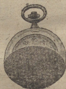
Núm. 3.517. — Ptas. 200.