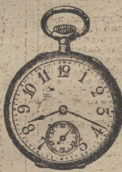
Núm. 806. — Pesetas 100.