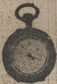
Núm. 5.004. — Ptas. 50.

Relojes de señora de oro de ley de 18 quilates