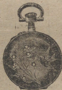
Núm. 5.020. — Con tapas y seis rositas. Ptas. 150.