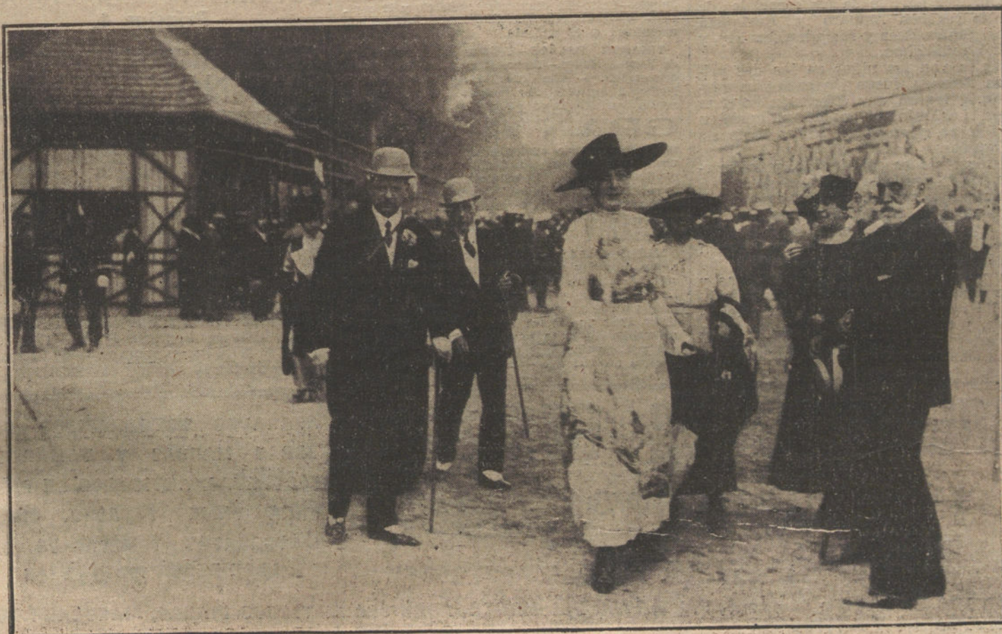
INAUGURACION DEL HIPODROMO DE ARANJUEZ.—S. M. la Reina paseando por el Hipódromo.

Yo sé que es necesario vivir conforme en todo con el medio social reinante, y este medio social no permite ciertas emociones que más bien pesan que dan valor a que las sienta. La opinión está preocupada, a su modo, pero preocupada, y que como horrores perezcan a montón.