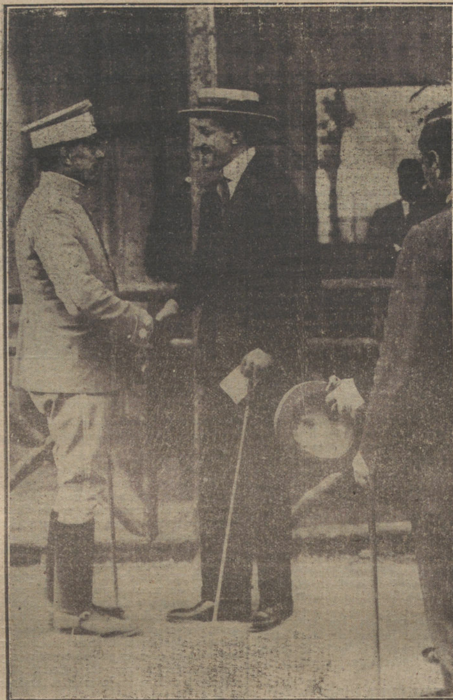
INAUGURACION DEL HIPODROMO DE ARANJUEZ.—S. M. el Rey, conversando con el duque de Tetuán, durante las carreras celebradas ayer tarde.

Al cumplirse el primer mes de la muerte del infortunado diestro Florentino Ballesteros, se ha celebrado en sufragio de su alma una misa de «Réquiem», á la que asistió la familia y numerosos amigos.