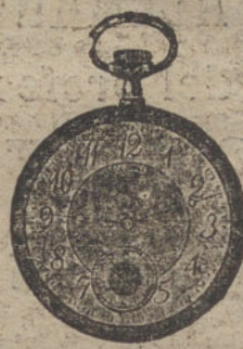
Núm. 5.010. — Ptas. 150.