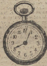
Núm. 5.009. — Ptas. 125.