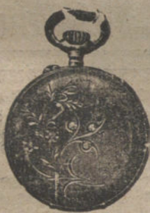
Núm. 5.026. — Con tapas y diamantes. Ptas. 90.