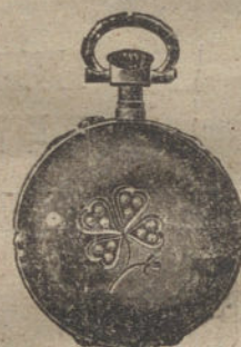
Núm. 5.012. — Con tapas y doce rositas. Ptas. 200.

La buena marcha de los relojes de la Casa Coppel se garantiza acompañando a cada reloj CERTIFICADO DE GARANTÍA