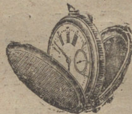
Núm. 4.032. — Ptas. 175.