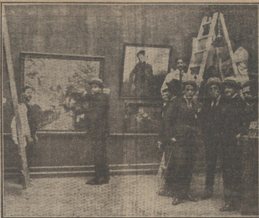
LA EXPOSICION DE BELLAS ARTES.—Operación del barnizado, que ha tenido lugar durante todo el día de hoy.

«Rusia, que por sí misma ha renunciado a conquistas, se encuentra colocada ante el dilema de si quiere renunciar a sus propios fines pacifistas en favor del imperialismo francés e inglés. Se trata para Rusia, no sólo de vencer a su propio Miliukof, sino también a los de los aliados, implantando la paz sin violencias y sin humillaciones, por la que también se muestra conforme, desde un principio, la socialdemocracia alemana».