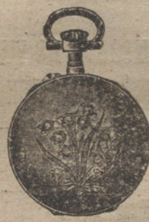
Núm. 5.018. — Con tapas y diez rositas. Ptas. 175.