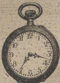
Núm. 801. — Pesetas 80.