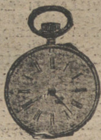
Núm. 5.005. — Ptas. 50.