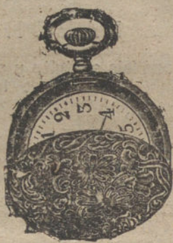
Núm. 5.020. — Ptas. 125.