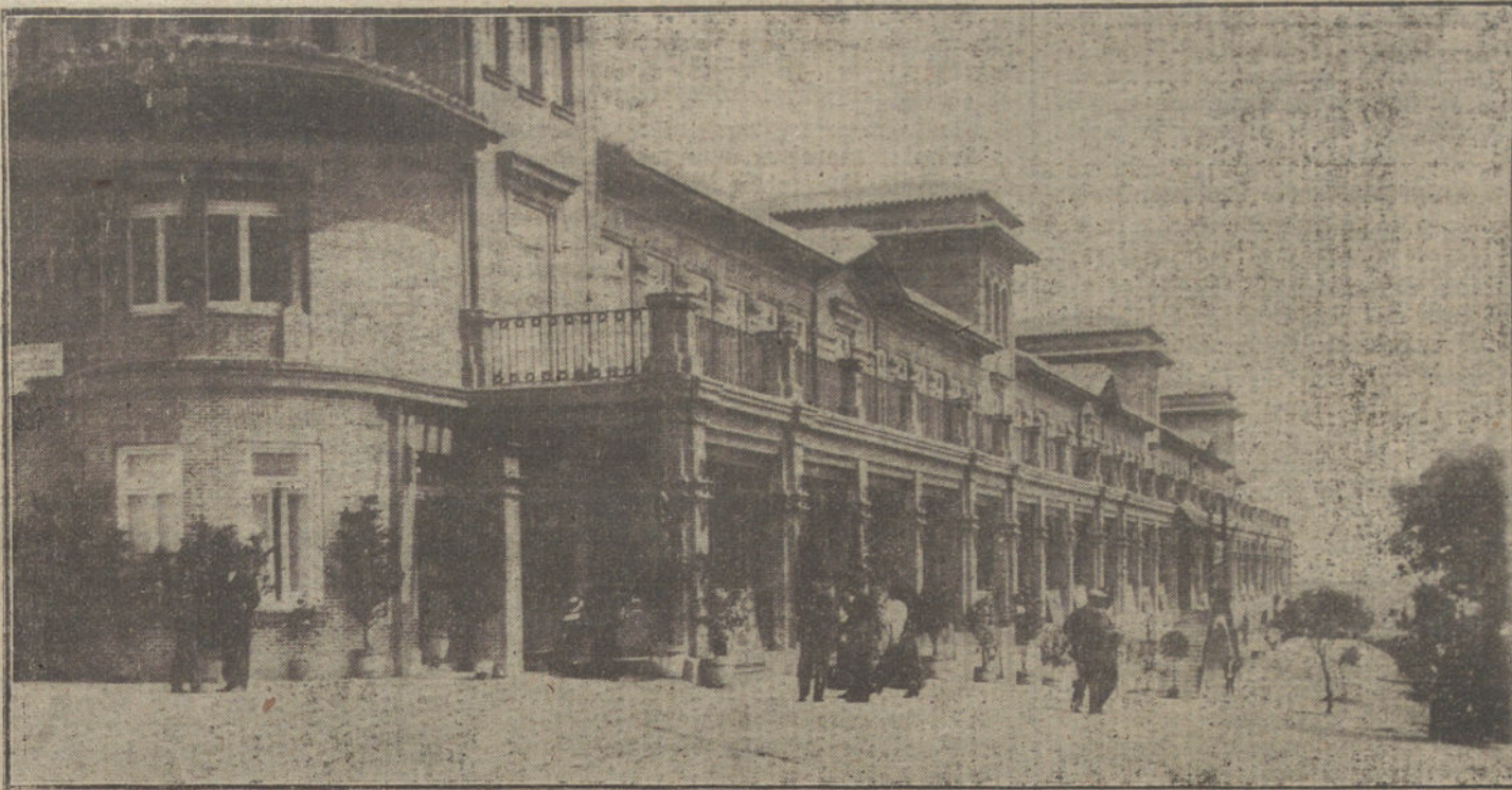
Vista general del edificio.

La capital de España cuenta, desde hoy, y gracias á la caridad inagotable que nuestro pueblo atesora, con otro Centro en el cual los desgraciados tuberculosos pobres encontrarán en él alivio y curación de sus terribles lesiones.