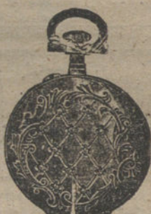
Núm. 5.019. — Con tapas y diez rositas. Ptas. 125.