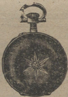
Núm. 5.023. — Con tapas y un diamante. Ptas. 125. El mismo, con un bri- llante. Ptas. 150.