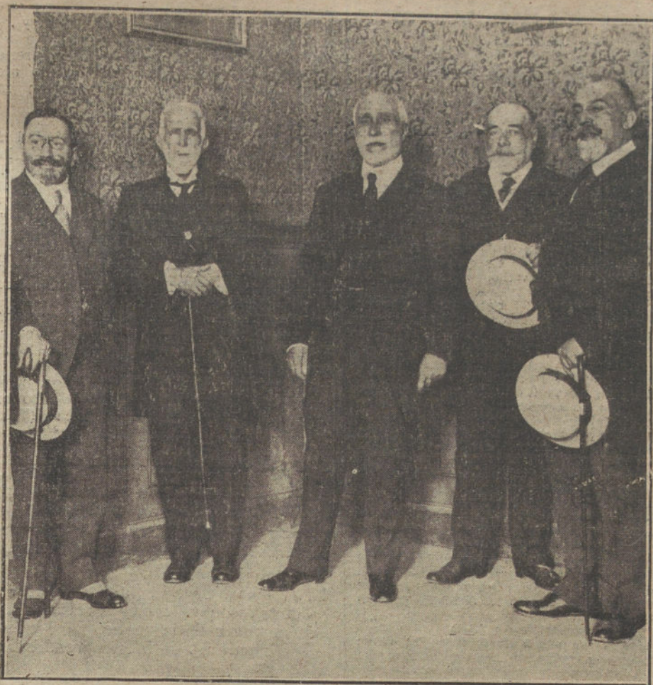
D. Antonio Maura, al terminar su conferencia de ayer en la Real Academia de Jurisprudencia y Legislación.

Ginés, á practicar determinados trabajos.