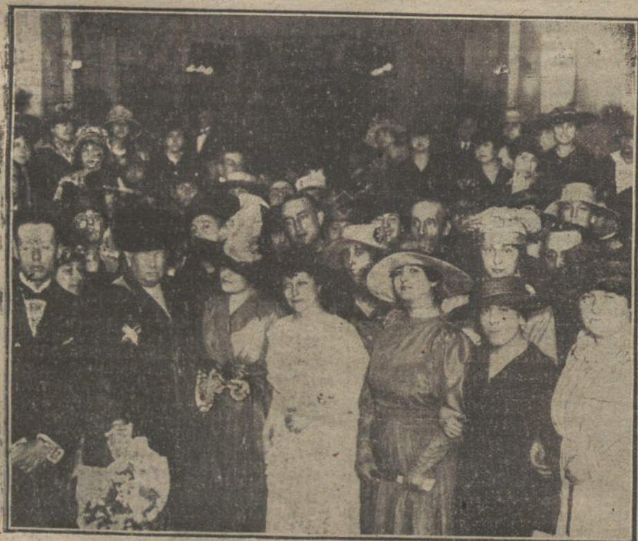
S. A. R. la Infanta Doña Isabel en la Fiesta de Caridad organizada por las antiguas alumnas del Colegio de Nuestra Señora de Loreto.