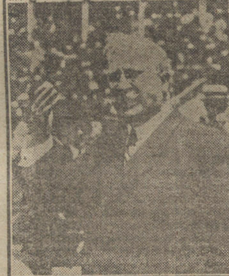
Gastrovido, Melquiades Alvarez y Lerroux, pronunciando sus discursos.

para que con este mitin se inicie una nueva era para la Patria española.