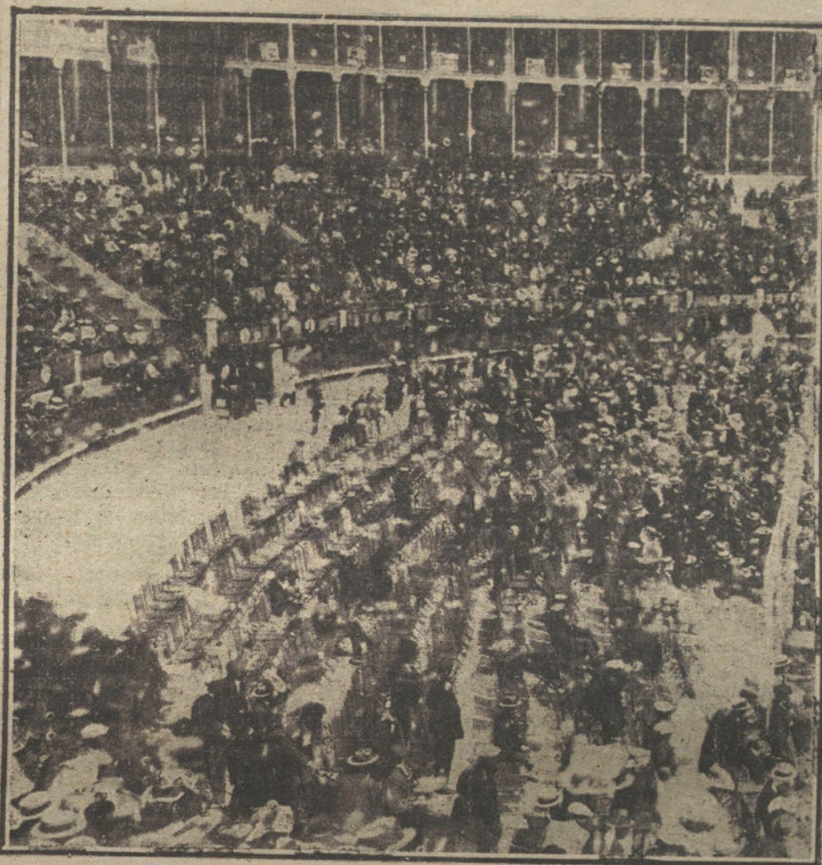
Otro lado de la Plaza de Toros, mientras hablaba Melquiades Alvarez.

En consecuencia, la organización obrera de Cataluña, firme en su propósito, declara: que enemiga de toda guerra, sin ser dominada por ninguna filia ni fobia, y consecuente con sus principios, ANTES QUE LA INTERVENCIÓN, «LA REVOLUCIÓN».