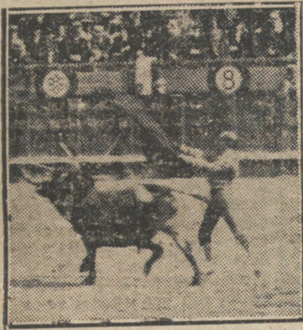
El Gallo en el primero.

Le pegan Zurito y Chano, y hasta le rajan la piel de un modo lamentable. El veragua mata dos caballos. Nada en quites.