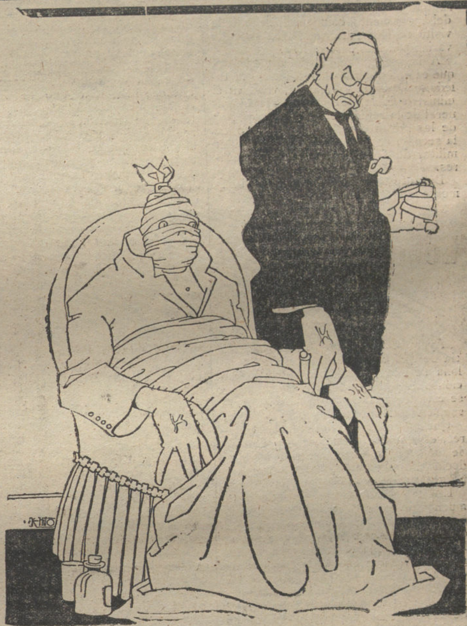
DESPUES DEL MITIN

El suelto del «Diario Universal», inspirado por el conde de Romanones y publicado pocas horas después de conferenciar éste con el marqués de Alhucemas, parece significar que el jefe del