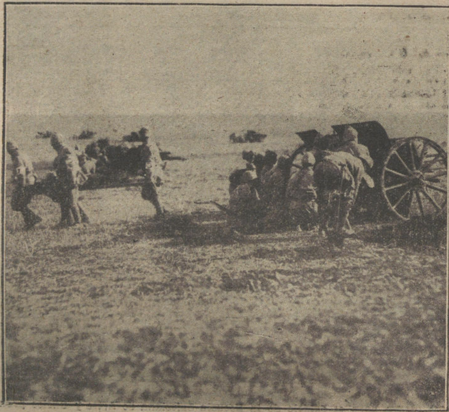
LAS OPERACIONES EN LOS BALKANES.—Artillería turca cerca de Medjidra.

Hace bien el águila nortea en remontar su vuelo prepotente a regiones donde fulge el oro con sus cien rayos de luz, y con la exactitud matemática de los números, esquivan la tragedia. El ciclope país «de las cuestiones prácticas», donde los hombres no pierden el tiempo en divagaciones pueriles, porque saben mejor que nadie cómo al correr de las horas el tiempo—ese mago de las crudas enseñanzas—va hilando el oro, según proverbio de sus hermanos los hijos de la activa Albión, tartamudea al pronun-