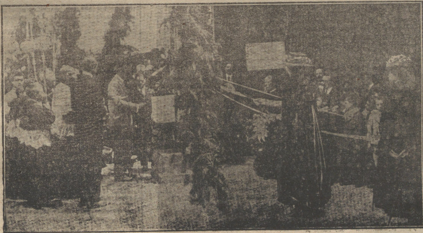
SS. MM. sosteniendo las cintas de la primera piedra para el edificio de la Escuela Galeana de Artes y Oficios para niños pobres, acto verificado esta mañana.

Rendez-vous deportivo y del Gran Mundo, durante el verano. Campo de golf é Hipódromo a diez y ocho minutos del Hotel