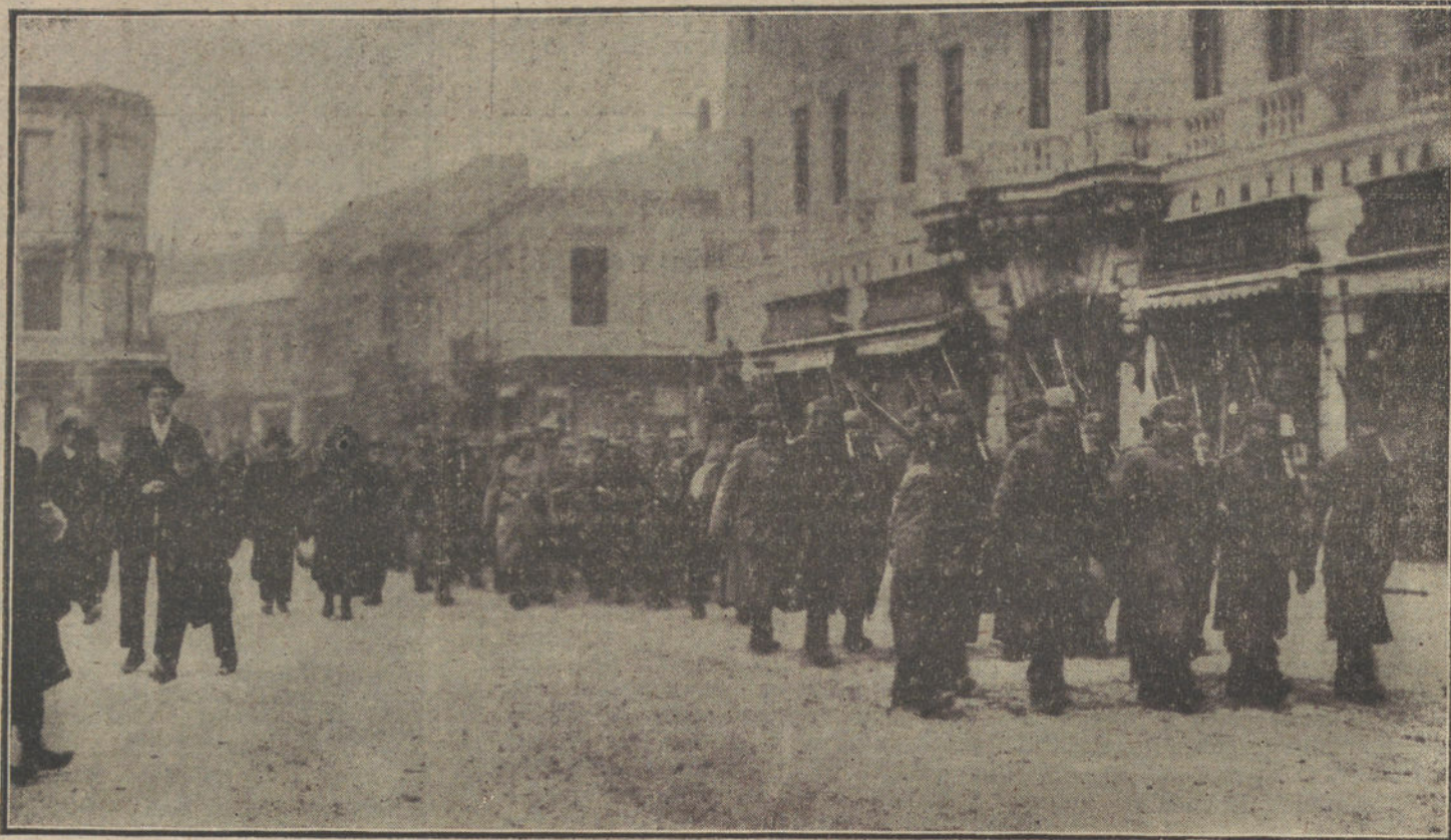
EN LAS REGIONES INVADIDAS.—Relevo de la guardia alemana en Bucarest.