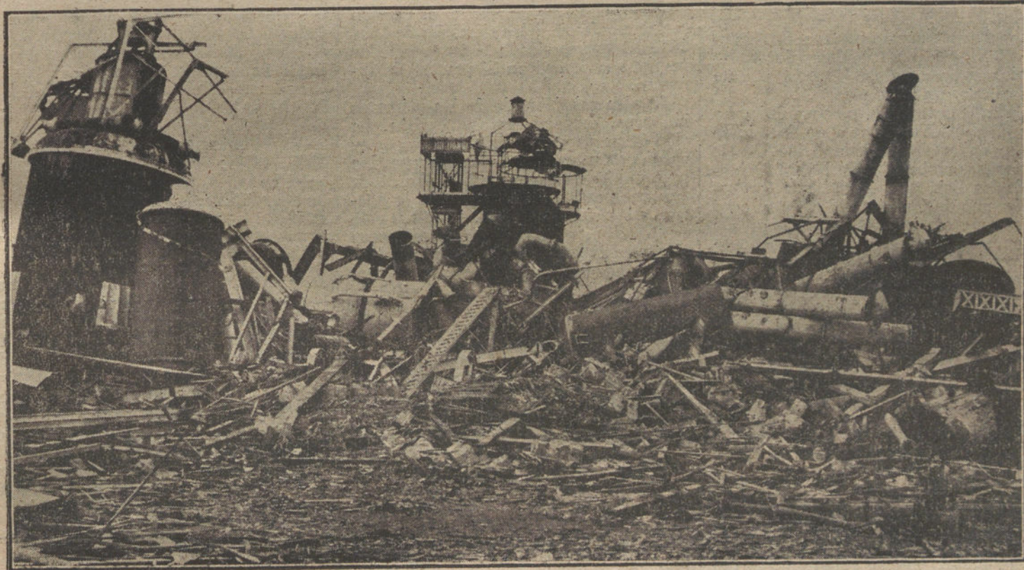
LA LUCHA EN FRANCIA. Aspecto de la azucarera de Jeancourt, después de los últimos bombardeos.