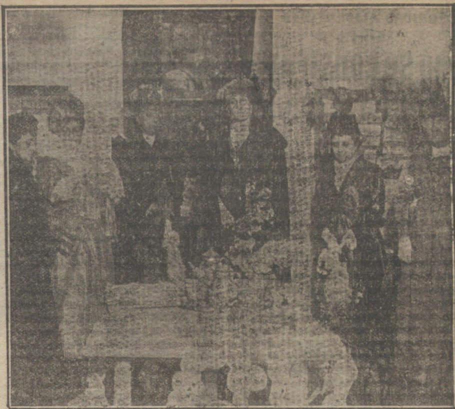
SS. MM. las Reinas Doña Victoria y Doña María Cristina é Infanta Doña Isabel, en la inauguración de la Exposición de Encajes.

El tonelaje bruto era de 4.622 toneladas; el neto, 2.903, y el desplazamiento, de 8.058.