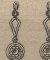
Núm. 3.—Pendientes 6 brillantes. Ptas. 350.