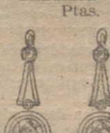
Núm. 5.—Pendientes 6 brillantes. Ptas. 775.