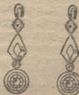
Núm. 1.—Pendientes 6 brillantes. Ptas. 225.

Monturas de platino y oro de ley 18 quilates contrastado