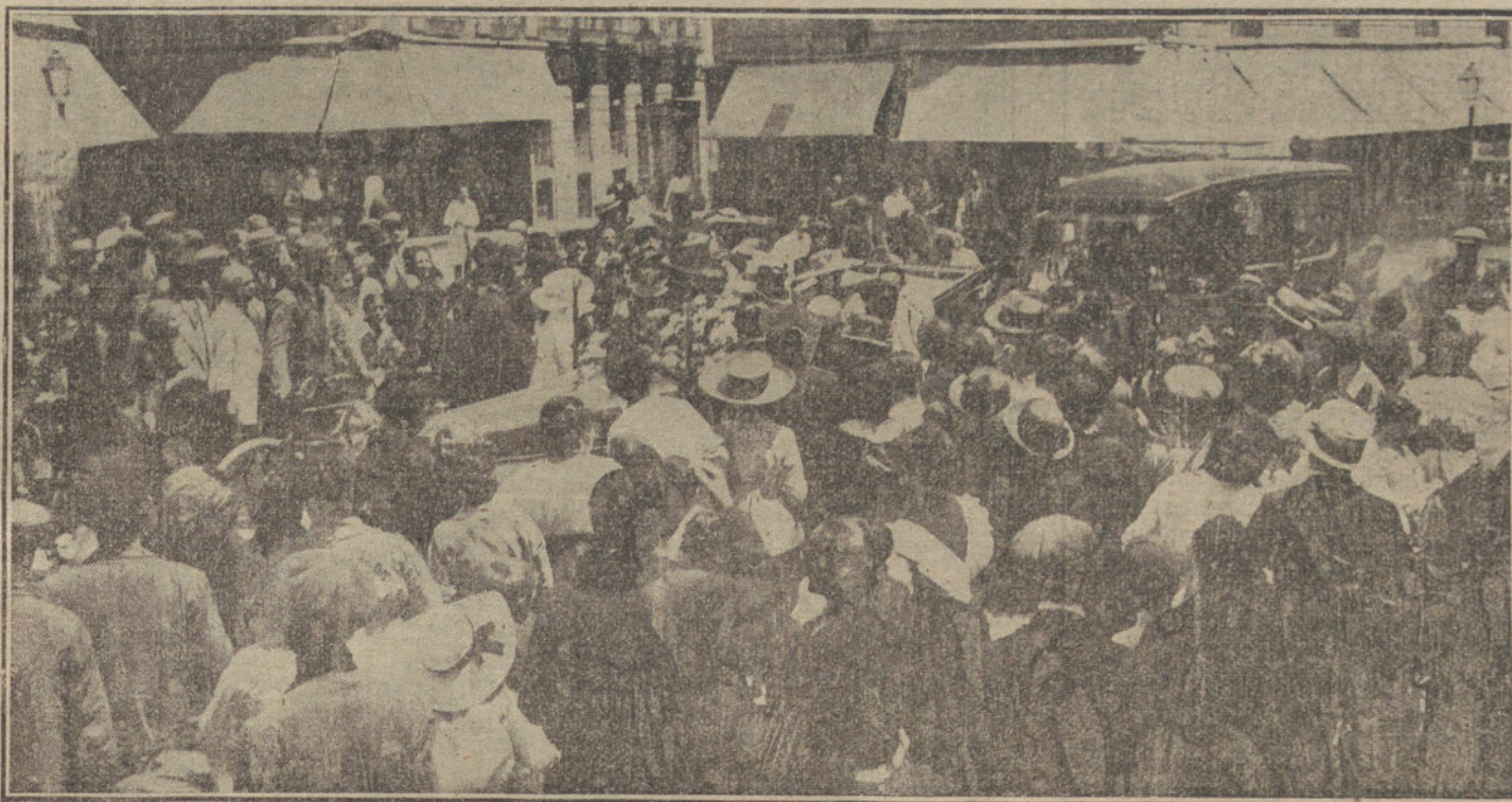
Los Reyes, aclamados por el público, durante su visita á las mesas de petitorio.

Madrid, inundado de sol, bajo un cielo radiante y con una temperatura estival, ofreció hoy espléndido marco á la popularísima fiesta de caridad.