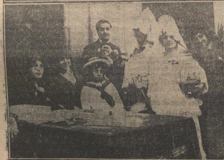
Pastora Imperio en la mesa del teatro de Romea. Debajo: Raquel Meller en la mesa del Trianon Palace.