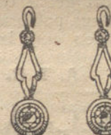
Núm. 2.—Pendientes 4 brillantes. Ptas. 275.