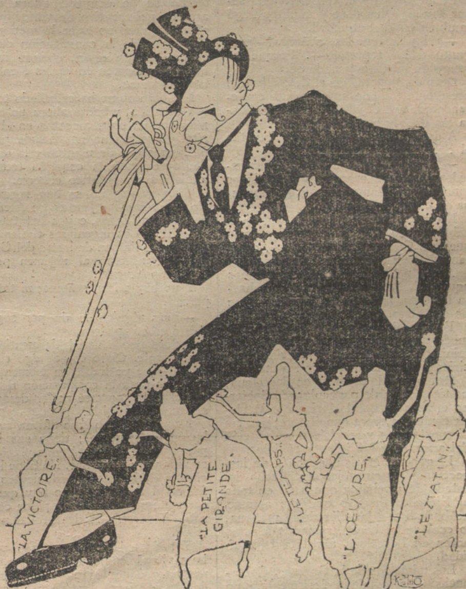
LA FIESTA DE LA FLOR