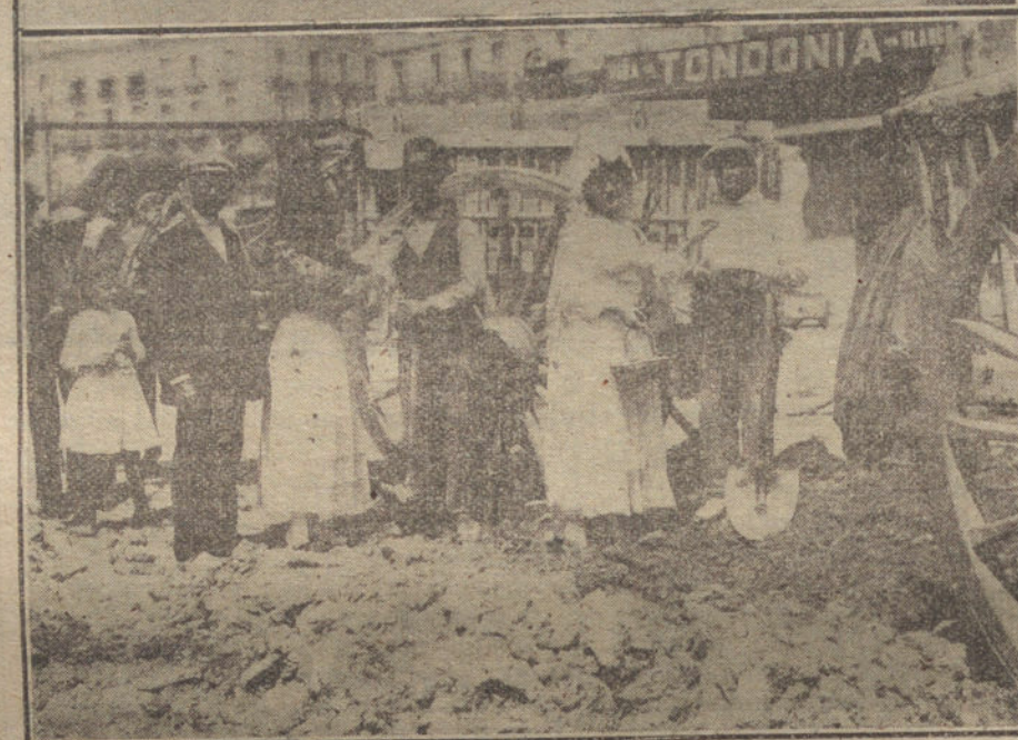
Señoritas vendiendo flores á unos músicos ambulantes. Debajo: Señoritas colocando flores á los trabajadores de las obras del Metropolitano.