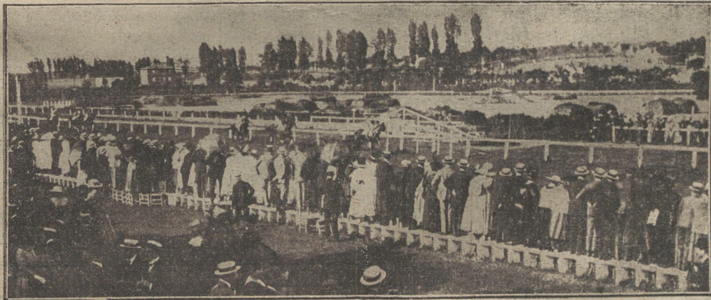
EN EL HIPODROMO DE LA CASTELLANA.—Un aspecto interesante de las carreras celebradas ayer.

Si, al fin, en ese comicio universal triunfa la causa de la paz, que no es otra que la de la razón y la justicia, habremos de bendecir al socialismo como fuerza renovadora, consciente y pujante; y que llega a reparar la equivocación de los otros partidos en momentos críticos para la historia de la Humanidad.