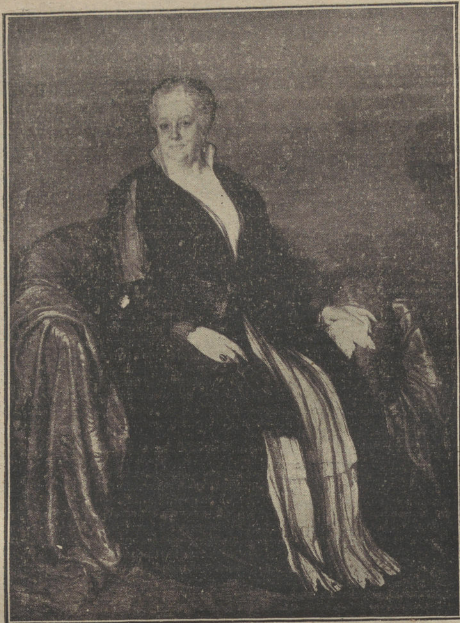
«Retrato», por Julio Moisés.

Tampoco es posible acoplarlas las dos en un solo local y bajo el mismo re-