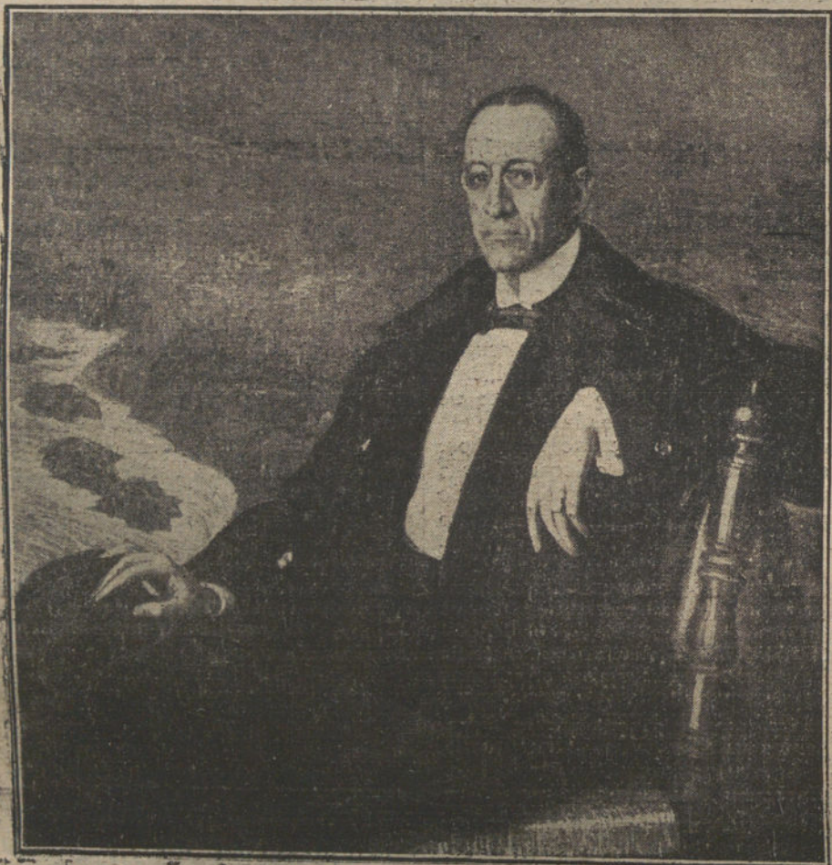
«Retrato», por Julio Moisés.

Primeras medallas, á Joaquín Mir, por su paisaje «Aguas de Moqueda»; á Eugenio Hermoso, por la composición titulada «A la fiesta del pueblo», y á