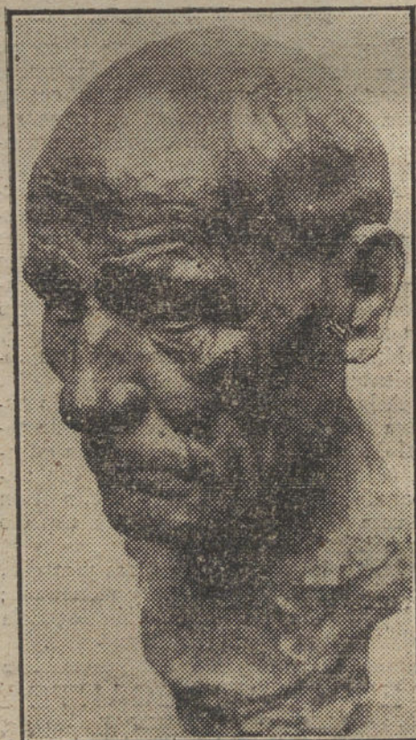
«El filósofo de Cuenca», estudio por Rubén.