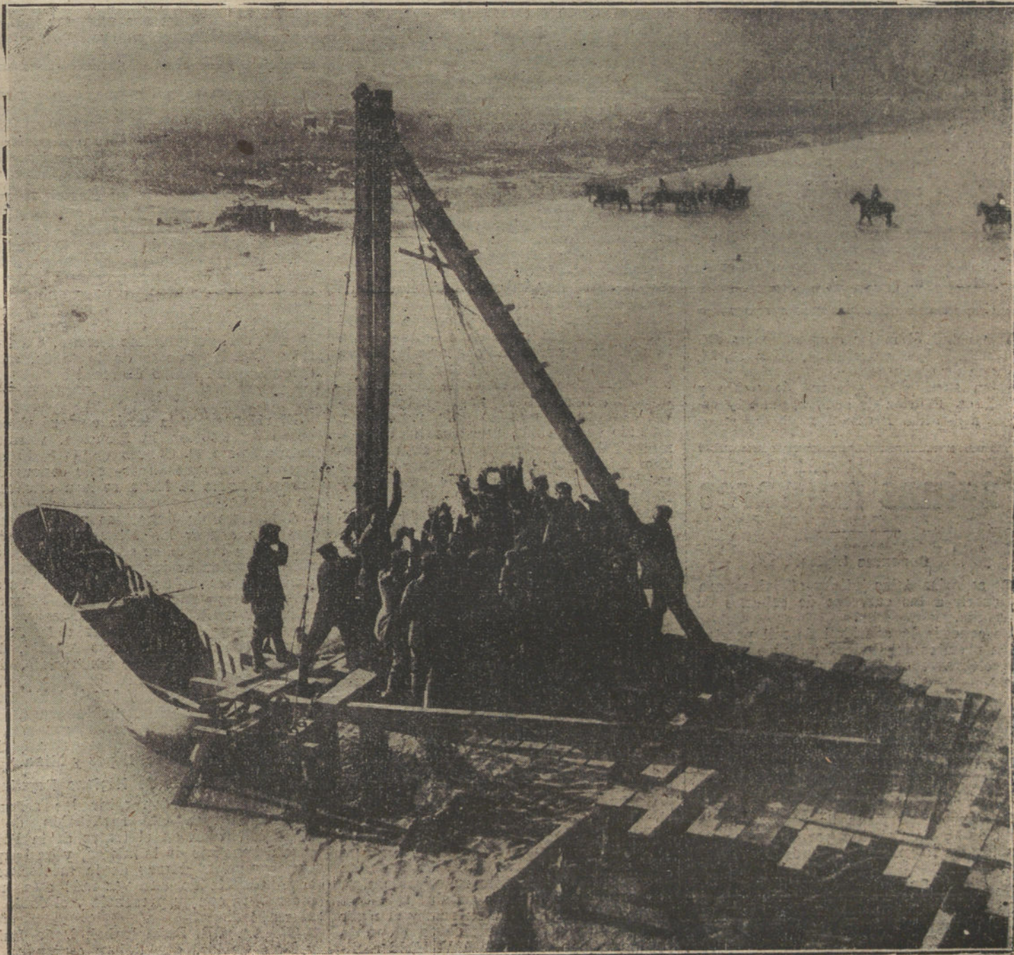
LAS NECESIDADES DE LA GUERRA.—Ingenieros alemanes construyendo un puente sobre el río Putna.