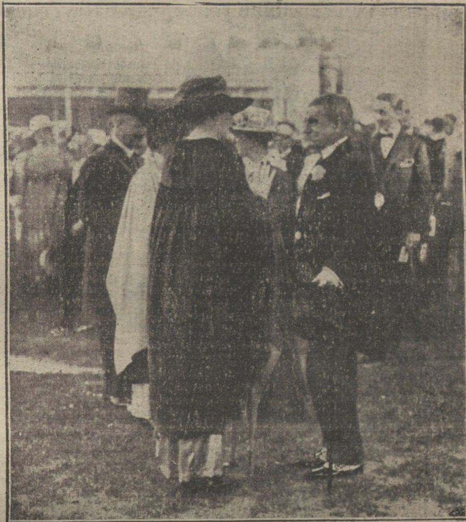
EN EL HIPODROMO DE LA CASTELLANA.—S. M. la Reina Victoria conversando con el embajador de Alemania, Principe de Ratibor, durante las carreras celebradas ayer.

«Se espera que los aliados responderán en breve a la Nota rusa referente a la paz sin anexiones. No se sabe si la respuesta satisfará al partido de Milinkoff, que sólo sostiene los principios nacionalistas, y si satisfará a los socialistas, cuyos únicos deseos son una paz inmediata, y cuya agitación se encamina a apartar todos los obstáculos que se oponen a la paz.»