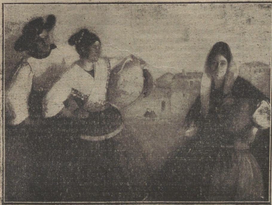
«Labriegos del campo de Arañuelo», cuadro de Manuel Cruz.