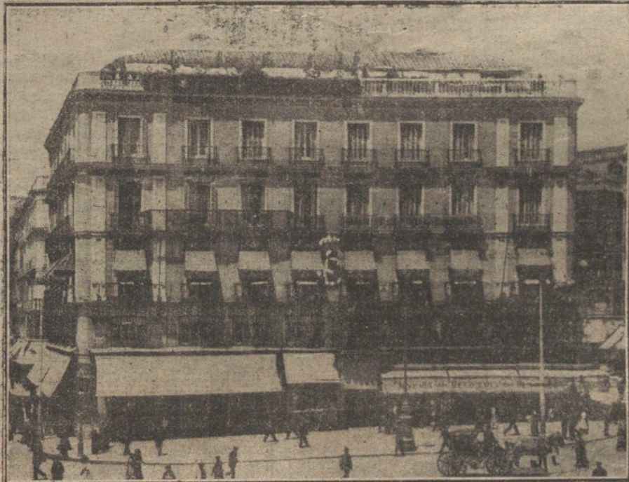
Edificio de la Puerta del Sol que ocupa actualmente el Centro de Hijos de Madrid.

—Sí, señores; el Centro ha fundado una orquesta de guitarras y bandurrias, que ya es conocida del público, pues en varios conciertos mereció los aplausos del auditorio y de la Prensa. El Centro ha organizado también las conferencias de divulgación de las grandezas históricas de la villa y corte, conferencias que comenzó