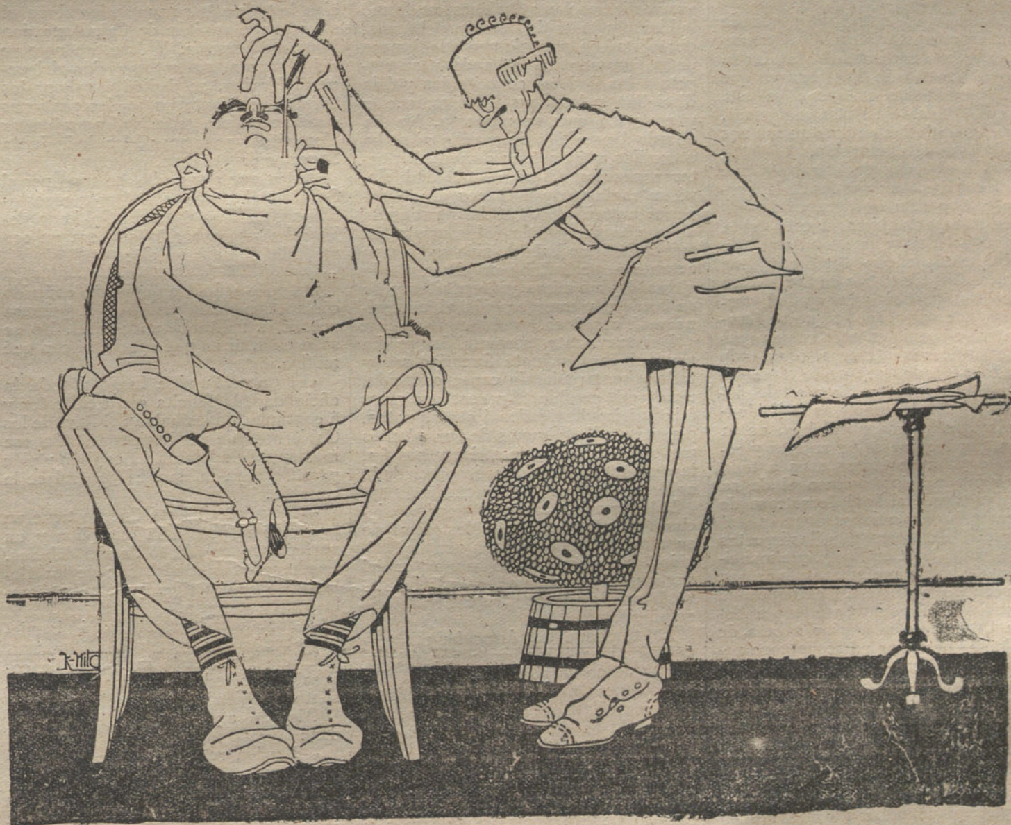
DESPUES DEL BOMBARDEO

WASHINGTON. La Cámara ha aprobado una ley sobre el seguro de guerra de los vapores mercantes, cuyos precios serán satisfechos por el Gobierno.