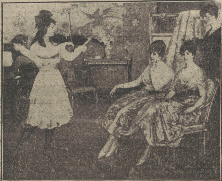
«Sonatina», cuadro de Eduardo Urquiola.

A nosotros no nos alegra el éxito. Hubiéramos preferido equivocarnos.