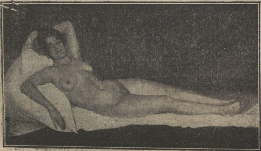
«Desnudo», cuadro de Gómez-Gálvez.

«Juan Matías el barbero», pasacalle, Chapí; «Danza gitana», Alonso; allegretto de la séptima Sinfonía, Beethoven; rapsodia en «re», Liszt; «Danza macabra», poema sinfónico, Saint-Saens; fantasía de «El asombro de Damasco», primera vez, Lina.