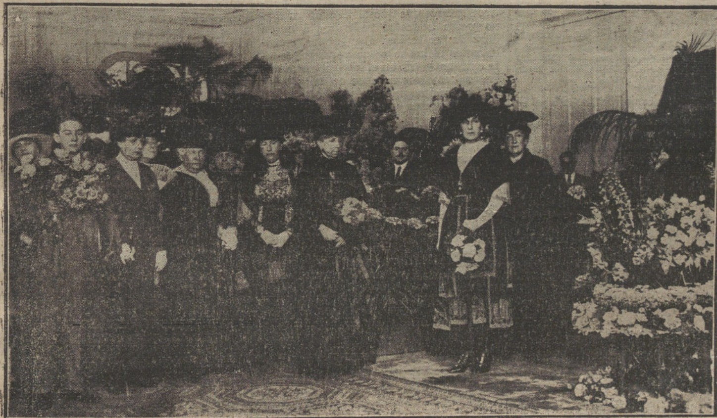
LA EXPOSICION DE FLORES.—SS. M. M. las Reinas Victoria y Cristina durante el acto inaugural, celebrado ayer tarde en el Retiro.

LA TAREA DE DEVOLVER TODOS LOS TRABAJOS QUE NO PUBLICAMOS SERIA ABRUMADORA, Y PARA EVITARLA, COMO PARA PREVENIR RECLAMACIONES, QUE RESULTARIA IMPOSIBLE ATENDER, RECORDAMOS QUE NO SE DEVUELVEN LOS ORIGINALES.