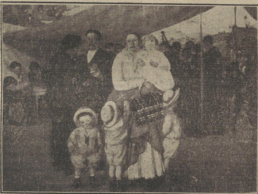
«Una romería en Asturias», cuadro de Nicanor Piñole.

Hubiérase hecho la protesta con la abstención, negando honradamente el concurso á un procedimiento inadmisiblemente, y no habíamos de ser nosotros—los primeros y los únicos que fustigamos el reglamento—quienes hoy nos levantáramos contra ese grupo de votantes,