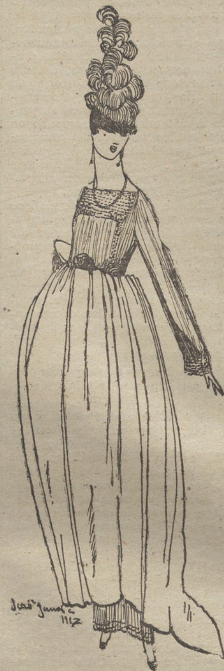
«Manet», traje de gasa negra bordado en azabache, falda tafetán rosa pálido. Modelo de la Casa Zamora.