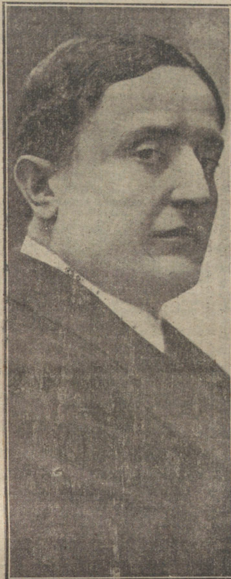
ENRIQUE VIDALI, notable figura de la cinematografía italiana.

Moreau ha establecido, de una manera razonada, una clasificación de los movimientos de estos músculos, relacionados con las emociones internas. Según él, en las pasiones que pudieran llamarse «opresivas», como la tristeza, el terror y los celos, la acción de los músculos superciliares predomina; por el contrario, en aquellas como el amor, la alegría y la curiosidad, que tienden a producir en el rostro una manifestación expansiva, prevalece la acción de los cigomáticos; lo que vulgarmente puede traducirse, porque los movimientos musculares son horizontales en la alegría y