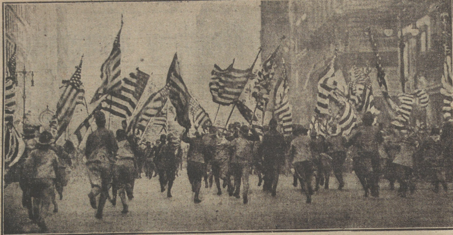
LOS NUEVOS FACTORES DE LA GUERRA.—Manifestación patriótica celebrada por los «boy-scouts» de los Estados Unidos.

Iba en convoy con otros vapores, y todos escoltados por cazatorpederos ingleses, que entablaron combate con unos