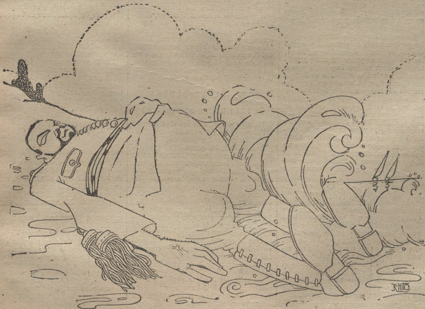
Empiezan á aparecer cadáveres.

Este estimó que debía aprobarse sólo el primer artículo del reglamento, que hace referencia á la constitución de las Juntas, y dejarse para un estudio más detenido el resto del articulado, ya que, según los informes del Gobierno, algunos jefes y oficiales habían mostrado deseos de introducir modificaciones. No se negó el Consejo de ministros á la aprobación total del reglamento, sino que creyó conveniente someterlo antes á una deliberación más extensa. En su vista, dijo por telégrafo al general Marina que el Gobierno reconocía la existencia oficial de esas Juntas, y respetaría su actuación. Más adelante, y cuando se hubiera conseguido una completa unanimidad, sería llegada la hora de concederle igual beneficio al reglamento.