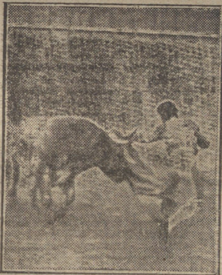
Algabeño rematando un quite.