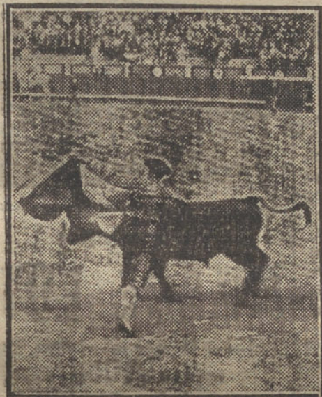
Malla veroniquando al primer miura.

Tardeando y dando la vuelta al redondel, aguanta cinco castañetazos el colo-