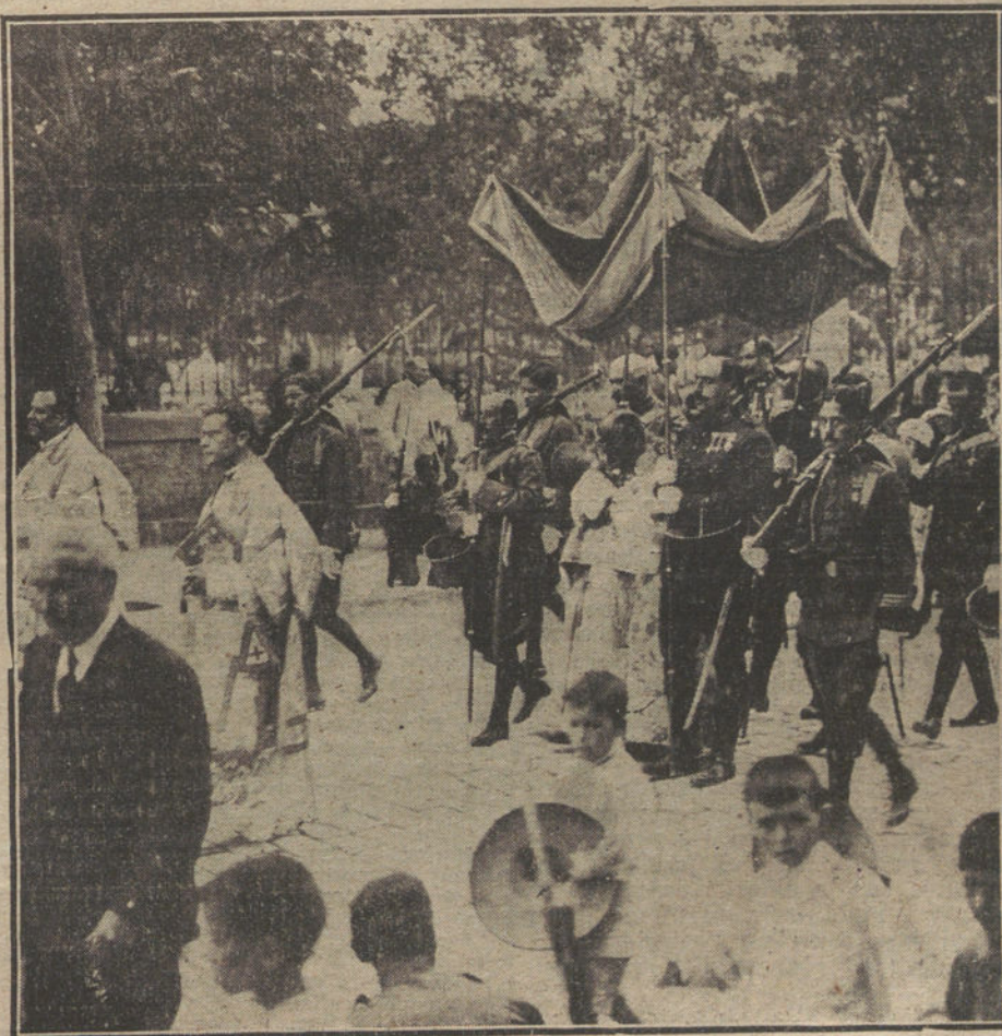
EL CORPUS EN MELILLA.—La solemne procesión, á la que asistieron las fuerzas de la guarnición, á su paso por la calle del general Marina.

Los cadáveres fueron trasladados á ésta, en donde, tras de practicarles la autopsia, fueron enterrados.