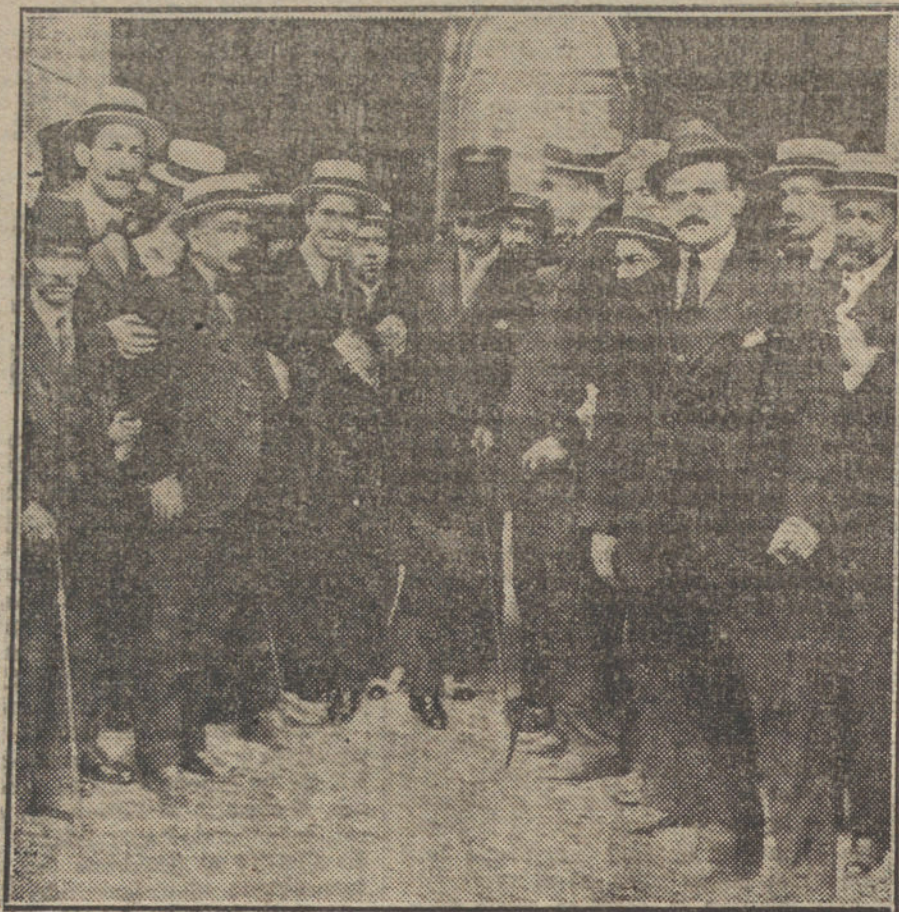
El marqués de Alhucemas saliendo de Palacio esta tarde, después de recibir de S. M. la ratificación de poderes.

No se ha querido terminar de una vez esta situación y la interinidad en que vivimos, y todo hace esperar que rotos los lazos de disciplina social, otras protestas del proletariado, aprovechadas por elementos extranjeros, seguirán á este acontecimiento de ahora, y que encontrándose el régimen por gobiernos fuertes que le defendan, el desastre será irreparable, y con él la Patria caerá en un estado de anarquía que hará imposible su reconstitución, y quizá su vida como país libre.