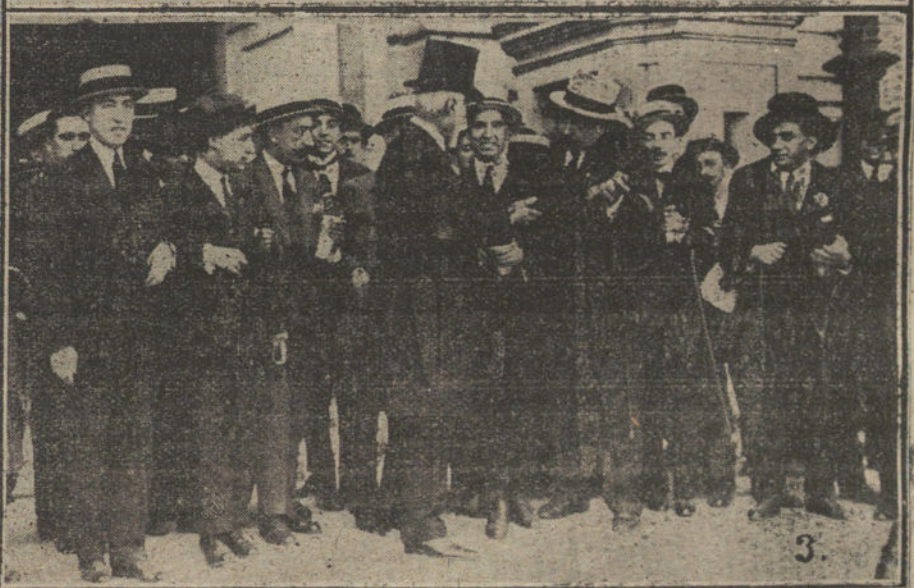
Núm. 1. El ex presidente del Consejo, conde de Romanones, después de ser consultado por S. M. acerca de la solución de la crisis. Núm. 2. El Sr. Maura a su llegada a Palacio. Núm. 3. D. Antonio Maura dando cuenta a los periodistas de su entrevista con el Rey.