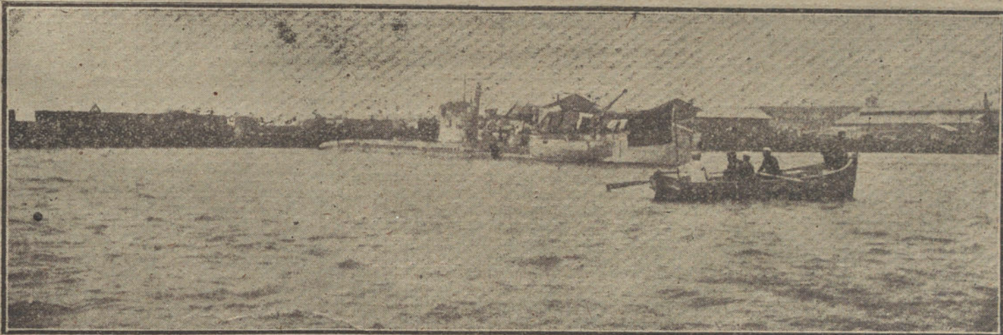
UN SUBMARINO ALEMAN EN CADIZ.—Llegada al puerto de Cádiz del submarino alemán averiado, cuya permanencia en aguas españolas está siendo tan discutida.