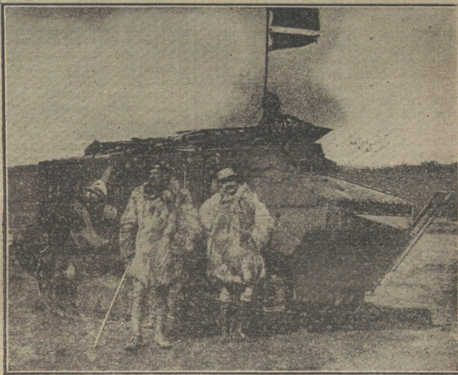
LA GUERRA EN FRANCIA.—Los nuevos tanques utilizados por el Ejército francés para la destrucción de alambradas.

En días anteriores hemos visto cómo el jefe de los liberales—jefe hasta ahora, en que ya empiezan á volverle la espalda los ex ministros—quería entregar al partido á un sacrificio estéril y contraproducente. El móvil también se sabe cuál fué. Romanones necesitaba los caminos libres, sin hombres que pudieran condenar su política y hacer más tirantes sus relaciones con la opinión, sin obstáculos que entorpeciesen sus miras personales. Y para todo eso le convenía dar al partido por fracasado, cuando el fracasado sólo era él.