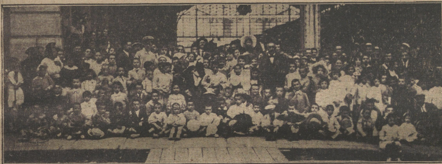
Las colonias escolares del Ayuntamiento en la estación del Norte, antes de partir para el Sanatorio de Pedrosa (Santander).

Para nosotros nos basta con la satisfacción de ver cómo en nuestra Patria, por una justa actuación fecunda, adquieren las instituciones militares, dentro siempre de su fidelidad al juramento hecho y en el cumplimiento estricto de la disciplina, un próspero desarrollo.»