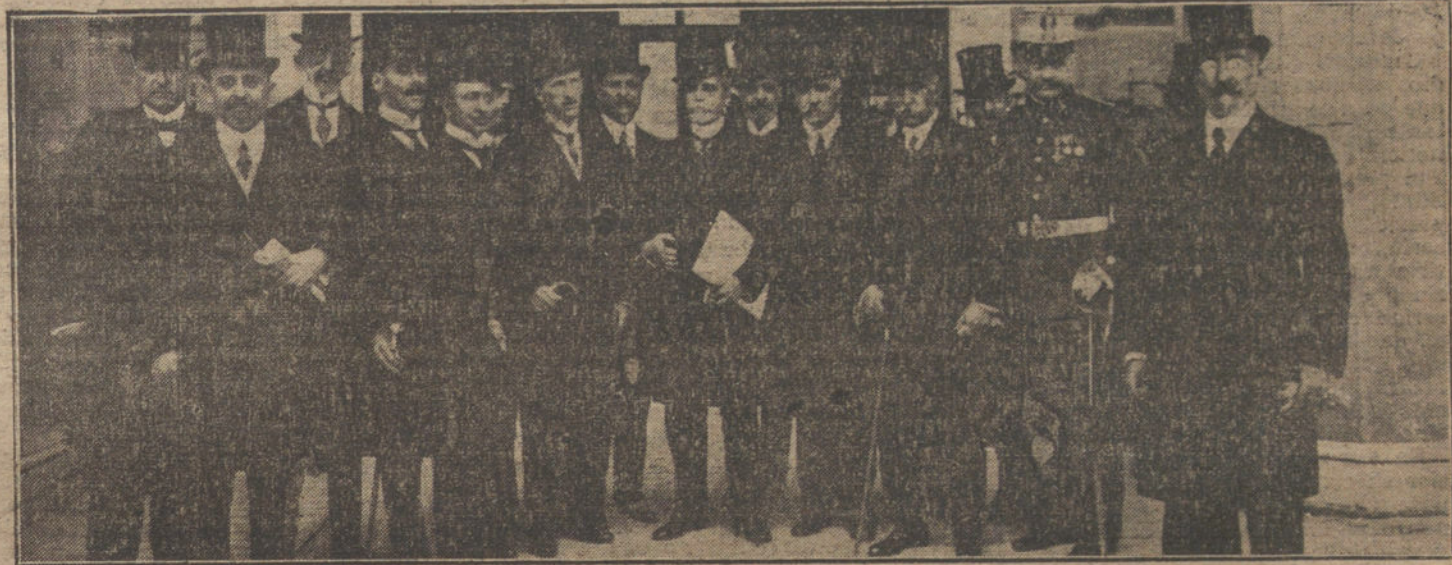
El Sr. Sánchez Guerra con los nuevos gobernadores, al salir ayer tarde de Palacio, donde fueron recibidos por Su Majestad el Rey.

Viene ésta, según se dice en el manifiesto, a despertar las dormidas energías del país para oponerse radicalmente, rotundamente, violentamente, a que continúe el actual estado de cosas. En reali-