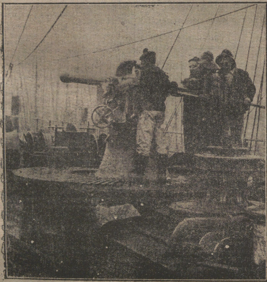
LA GUERRA EN EL MAR. Cañón de 95 milímetros, á bordo de uno de los barcos franceses que ejercen vigilancia en el Paso de Calais.