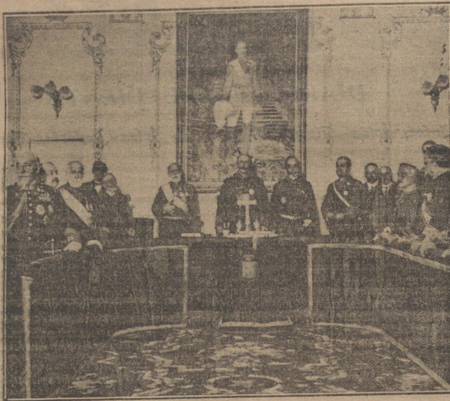
Toma de posesión del nuevo presidente del Consejo de Estado, acto verificado esta mañana.

—Fijando la nueva plantilla de los ciegos del Alto Aragón.