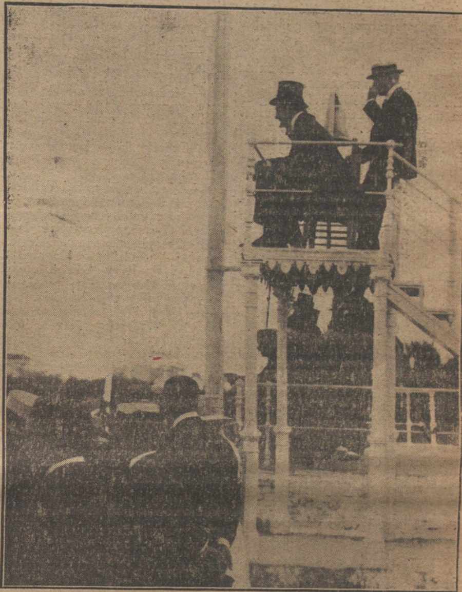
EN EL HIPODROMO DE LA CASTELLANA.—S. M. el Rey presenciando una de las carreras celebradas ayer.

No es el instante propicio para plantear pleitos personales, ni mucho menos para decidirlos con la mira puesta en aquellas mezquinas pasiones egoístas que pudieran justificar ante los ojos de la opinión pública que á todos nos contempla el innecesario desconcepción que padecen los hombres políticos y arruinar la sospecha, ya cercana á la convicción, de que son incapaces para restaurar la vida moral de la nación y ser cooperadores eficaces de la Corona en la ardua tarea del engrandecimiento de la Patria. La actual hora es de renovación; los partidos que se consuman en contiendas personalistas, sin atender por entero á su propia transformación espiritual, no sólo serán impotentes para asumir algún día la dirección de los destinos patrios, cuando esté planteada ante la humanidad