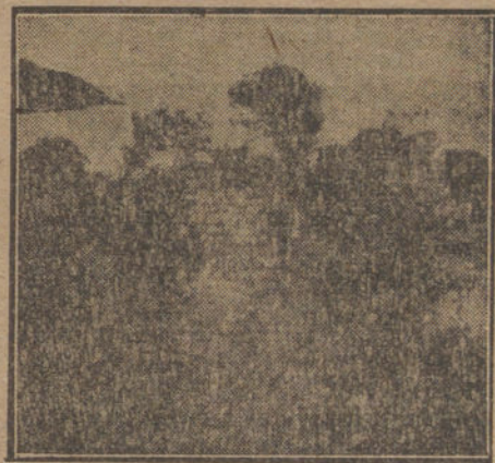
ALCAZARZEGUIR.—Ruinas del castillo.

Y así llegamos a esta situación tan complicada y tan enojosa, donde hasta el «Times» juega su papel. El «Times»,