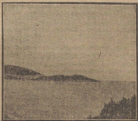
ALCAZARZEGUIR.—Vista de la bahía.

Había el Gobierno inglés enviado al Sultán algunas condecoraciones, como estímulo de condescendencia... Había salido para Rabat una Embajada anglofrancesa, que debía acordar con el Majzen la forma diplomática de justificar esta violación de los Tratados... Habían los franceses predisposto ya el ánimo de Muley Yusef para una negativa rotunda... Había