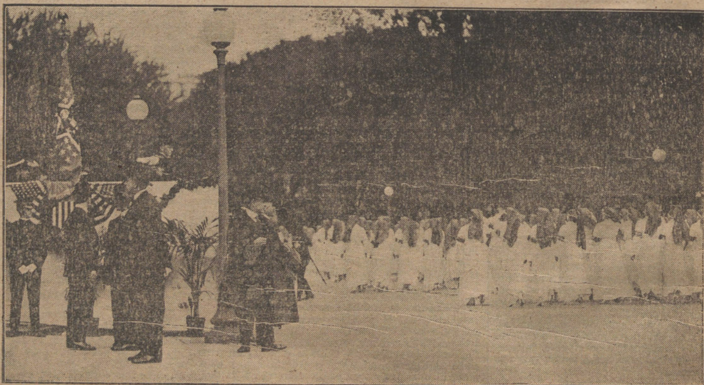
NORTEAMERICA EN LA GUERRA. —El Presidente de los Estados Unidos, Mr. Wilson, pasando revista al Cuerpo de enfermeras.

Mr. Lloyd George, hablando en la Cámara de los Comunes, dijo que la guerra era la mayor calamidad que se