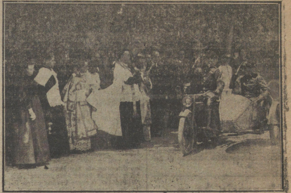
LA FIESTA EN SAN CRISTOBAL.—S. A. la Infanta Doña Isabel presenciando la bendición de «motos» militares.

El Tribunal correccional ha juzgado a tres propagandistas que operaban en los alrededores de las estaciones. El primero es un joven de unos diez y ocho años, que el viernes último, a media noche, estaba en la estación del Norte en medio de un grupo importante de soldados que esperaban la hora de marchar. El joven les arengaba contra la guerra, y al ver