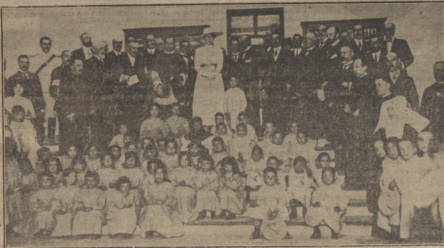
INAUGURACION DE NUEVOS PABEL LONES EN EL ASILO DE SANTA CRISTINA.—S. M. la Reina Doña Victoria con la Junta del Asilo y niñas asiladas.

Ha continuado la lucha de Artillería en la región del monumento de Hartebise. Los alemanes no han hecho ninguna nueva tentativa contra la posición que conquistaron el día 25. Según nuevos informes, entre las organizaciones que conquistaron aquel día se encuentra la Cueva del Dragón, que tiene más de cien metros de ancho y unos 300 de profundidad, y había sido transformada por los alemanes en una verdadera fortaleza.