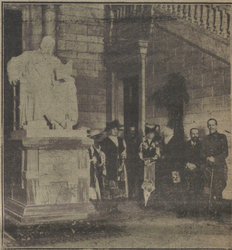
La Familia Real durante el acto de descubrir la estatua de Menéndez Pelayo.

No creemos que el sistema elegido por los ex ministros para aconsejar la jefatura del marqués de Alhucemas sea el más democrático, ni que con él se guarden todos los respetos que merecen las personalidades del partido. Imparcialmente, hemos de declararlo así. Tan faltos de razón están los que quieren a toda costa un Directorio, como los que imponen de esa forma la jefatura, que, de otra suerte, tampoco encontraría adversarios. En la conciencia del partido está que la dirección de éste debe ser encomendada a una persona de los prestigios y merecimientos del marqués de Alhucemas. Mas no estará de sobra, para que el nombramiento tenga toda la robustez necesaria, que