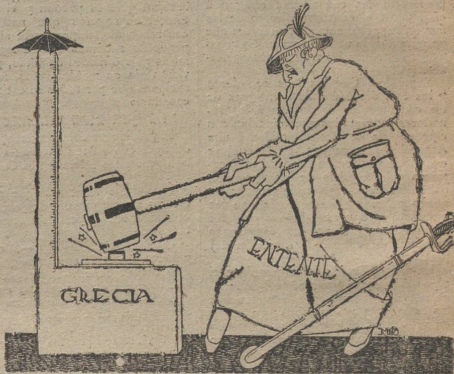
VERBENERAS Probando la fuerza.

Seguros de que no desatenderá nuestra petición, en bien del partido liberal, en el que constantemente ha figurado usted desde su ingreso en la vida pública, le anticipamos las gracias y nos reiteramos de usted afectísimos amigos y correligionarios, q. b. s. m., Alejandro Groizard, Miguel Villanueva, Amós