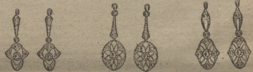
Núm. 4.—Cuatro brillan-tes y diamantes