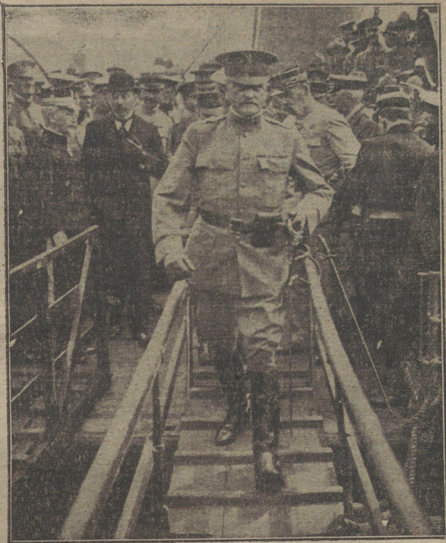
LOS NUEVOS FACTORES DE LA GUERRA.— Llegada á Francia del general Pershing, comandante en jefe del primer Ejército americano.

Por consiguiente, el alcanzar una paz rápida es nuestra principal tarea. caer á Rusia entre las garras de la clase de paz que deseamos. Una paz separada no puede resolver el problema que confronta á la revolución rusa. Una paz de esa naturaleza haría caer á Rusia entre las garras de la cábala de los imperialistas mundiales. De nuevo, y con gran rapidez, Rusia se vería arrastrada á una nueva guerra. Todas nuestras proclamas para