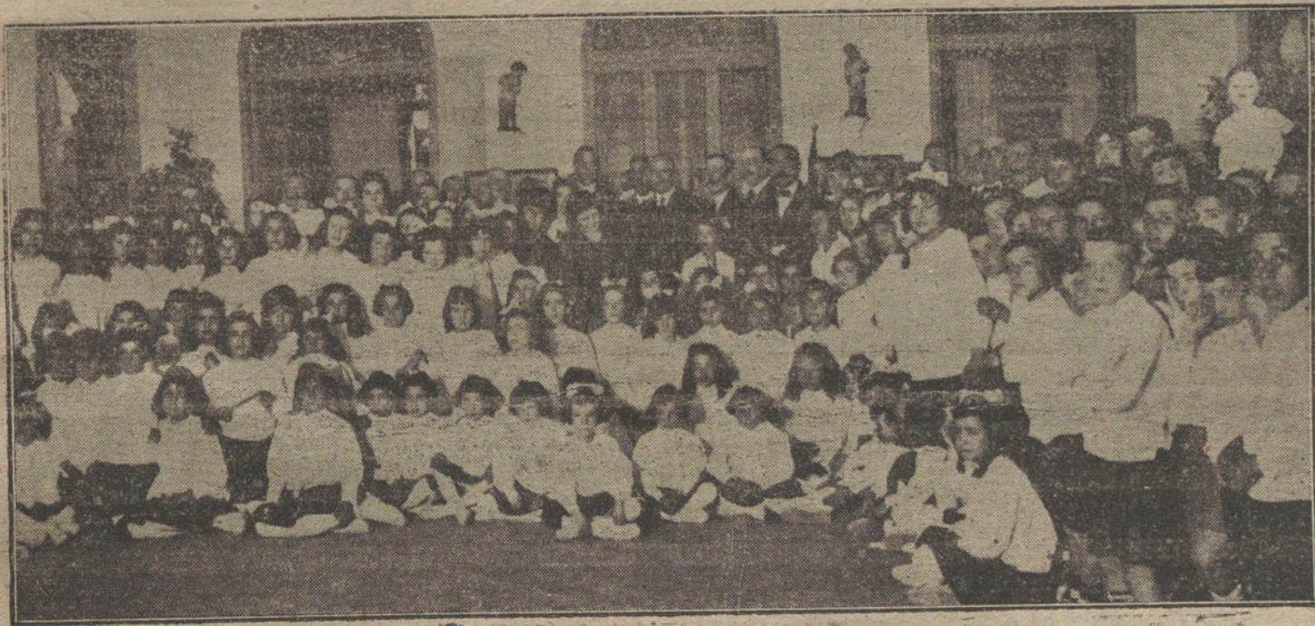
La condesa de San Rafael, el alcalde de Madrid, el Sr. Novo y otras personalidades, al terminar la fiesta de fin de curso verificada ayer tarde en las Escuelas Aguirre.

«Ayer tarde se reunieron, sin previa convocatoria, en el Círculo liberal, 26