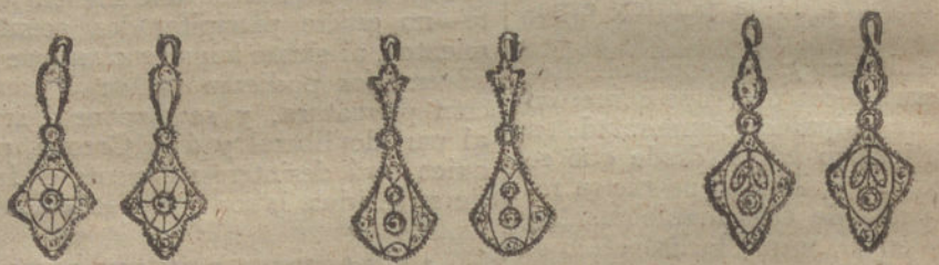
Núm. 1.—Dos brillantes y diamantes

Monturas de platino fino y oro de ley 18 quilates contrastado