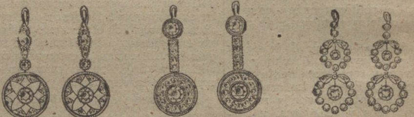
Núm. 7.—Cuatro brillan-tes y diamantes