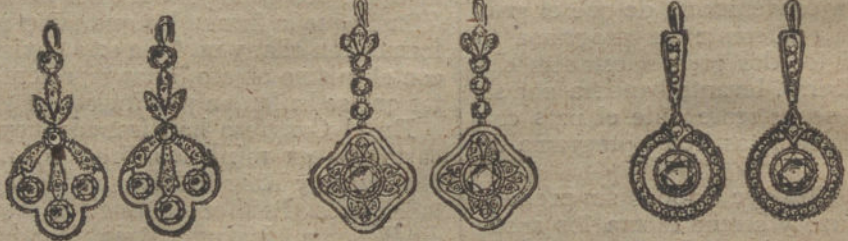
Núm. 10.—Diez brillan-tes y diamantes