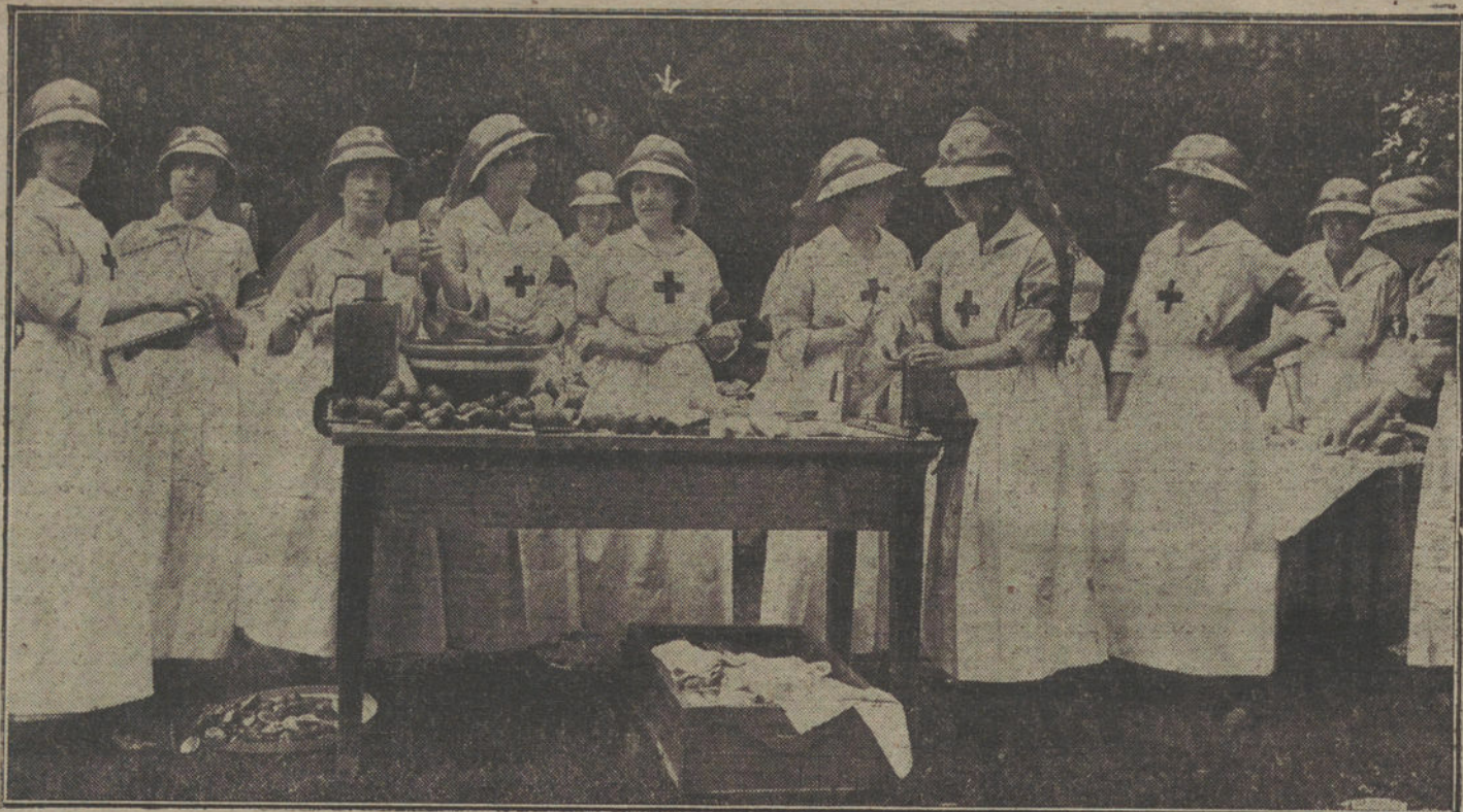
LAS NECESIDADES DE LA GUERRA.—Damas de la Cruz Roja norteamericana, preparando bebidas de limón para los heridos.

Mr. Lloyd George, en un nuevo discurso pronunciado en Glasgow, aludiendo á los esfuerzos hechos por Inglaterra para conseguir la solución victoriosa de la guerra, dijo que había un hombre que trabajaba tanto como el que más, y que éste era S. M. el Rey. Mr. Lloyd George ha declarado que