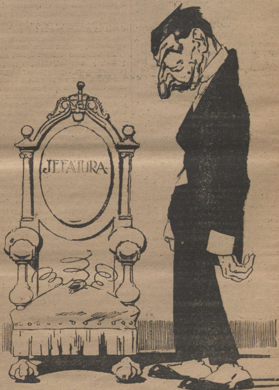
La verdad es que tal como han dejado el sillón cualquiera se sienta... (Caricatura de AGUSTIN.)

Además, como la neutralidad y la intervención constituyen hoy un programa esencial en la política española, dividiéndola en dos bandos, desde el