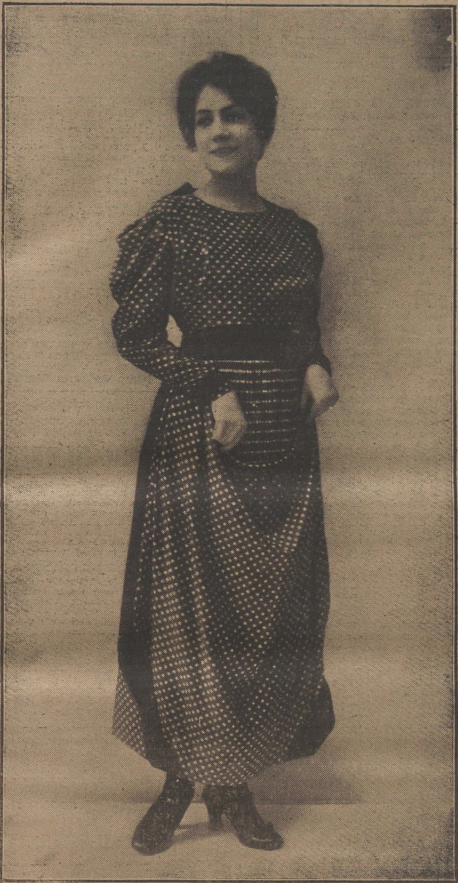
Sencilisimo y elegante traje-hata de los llamados de combinación, modelo de la casa Buzenet.