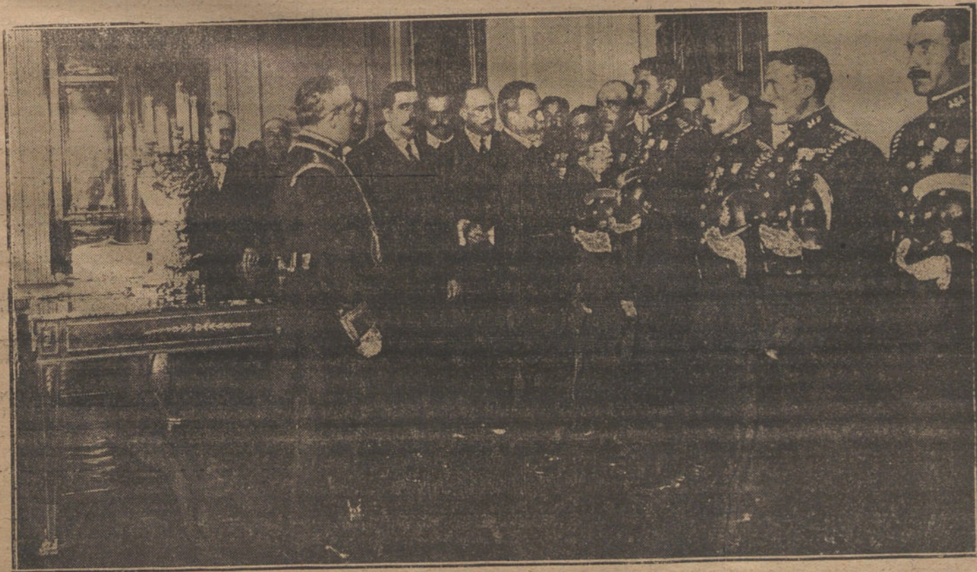
El ministro de la Gobernación, Sr. Sánchez Guerra, imponiendo la cruz de Beneficencia a los hombres que más se distinguieron en el incendio ocurrido en Avila el 1 de Julio de 1913.

momento en que el señor conde de Romanones afirma que casi todos sus adictos opinan lo contrario en ese problema interesantísimo para las instituciones y para el presente y porvenir nacionales, el señor conde de Romanones dejó «ipso facto» de ser jefe del partido liberal monárquico. Entonces suscribió su sentencia de muerte, y cuanto viene haciendo hasta la fecha es pura música.