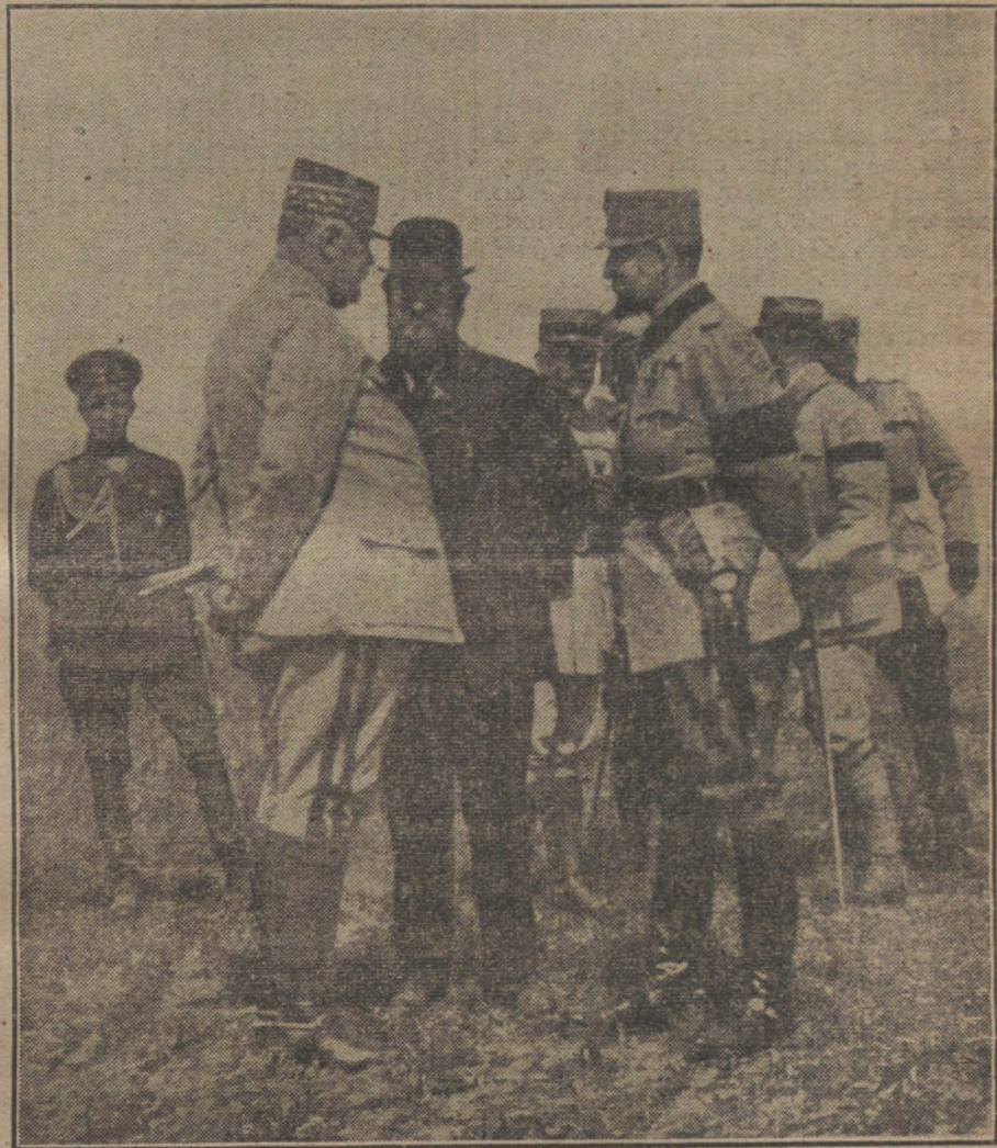
M. Albert Thomas y el general Berthelot, conversando con el Rey en el frente ru mano.

El conde de Romanones asaltó el Poder en 1915, pretextando que era preciso reorganizar el Ejército y la Hacienda; arriaron los proyectos del general Echagüe, y al llegar al Poder, las reformas de Guerra no se