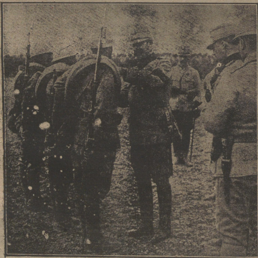
LOS RESTOS DEL EJERCITO RUMANO.—El Rey Fernando de Rumania condecorando á tres soldados de los que se han distinguido en las últimas operaciones.

Son muchas las casualidades, son muchas las cosas extraordinarias que se acumulan en una acción y en el personaje de Don Alvaro; mas son posibles, y eso basta para que no pueda decirse que