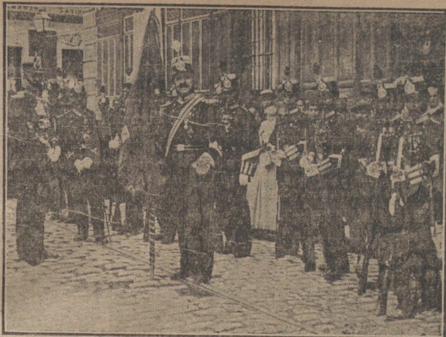
LA FIESTA DEL 7 DE JULIO.—Los milicianos catalanes a la salida de San Francisco el Grande, donde se ha celebrado una solemne función religiosa.

Buen chasco se llevaron los incomparables saineteros andaluces, cuando Pepe les diga: «Ya está estob» Bien entendido que ojalá se lleven los Quintero ese