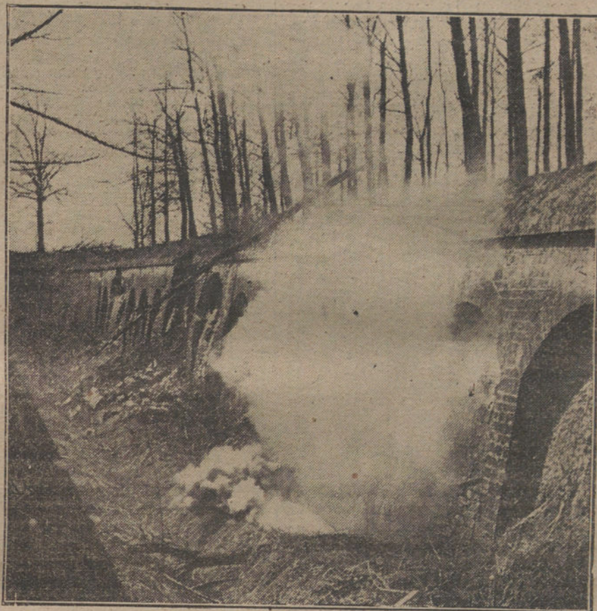
LA LUCHA EN FRANCIA.—Explosión de una granada junto á unas defensas de Aisne.

El conde de Romanones reconocía en su nota que no se puede gobernar en