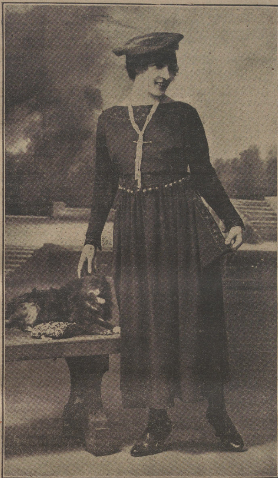
Elegante modelo, presentado por la casa Ernestine, de París, premiado en la reciente Exposición de vestidos.