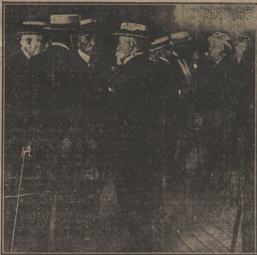
El general Marina, a su llegada esta mañana a Madrid, conferenciando con el señor Dato, ministro de la Guerra y general Echagüe.