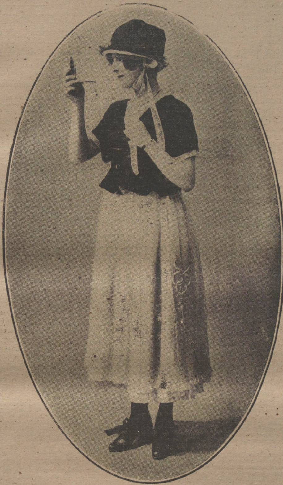
Elegantísimo traje de tul bordado y casaca de terciopelo, creación de la casa Ascott de París.