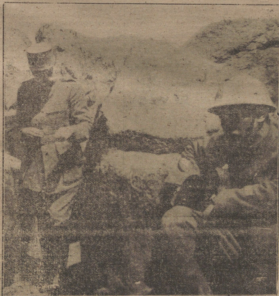
El general francés Sarraín en un puesto de observación del frente macedónico.

la convocatoria de la Asamblea de representantes del país. No hemos de insistir sobre ella, ya que la calificación de sediciosa que el Gobierno le aplica haría delictivo cualquier elogio.