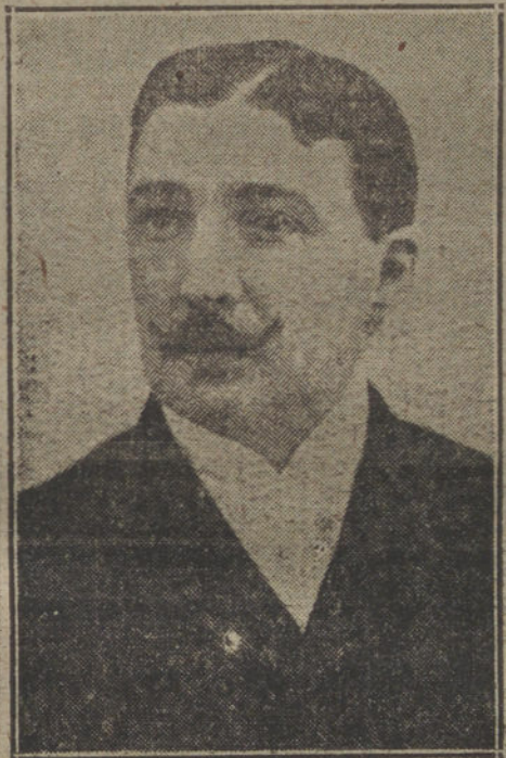
El marqués de Cortina.

Poco después de la una de la tarde, y en ocasión en que se hallaba reunido