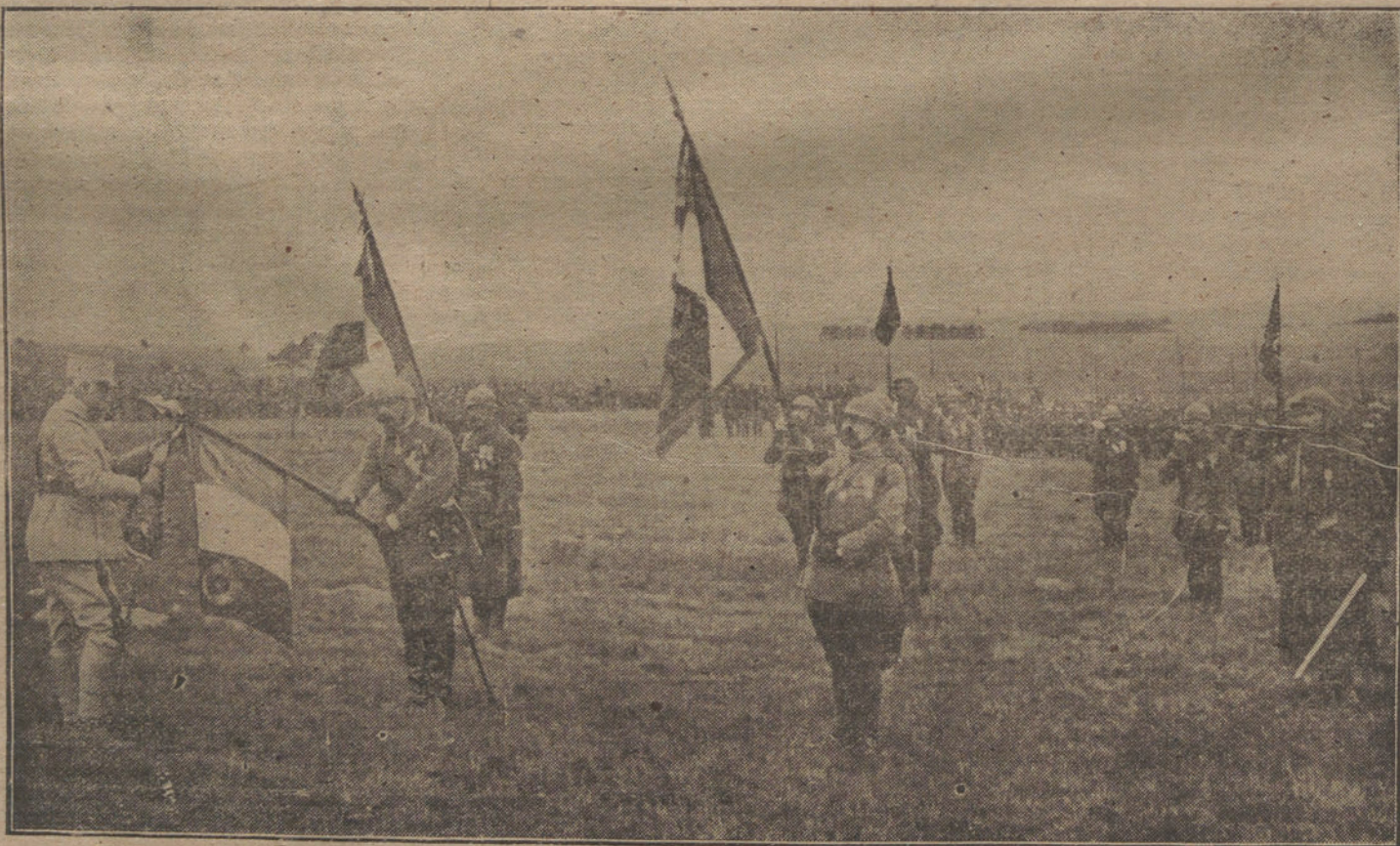
LA LUCHA EN EL NORTE DE FRANCIA. El general Anthoine, condecorando las banderas de los regimientos que han tomado parte en las últimas operaciones.

—Ciertamente—replicó el anciano—; pero el convencimiento ha llegado tarde.