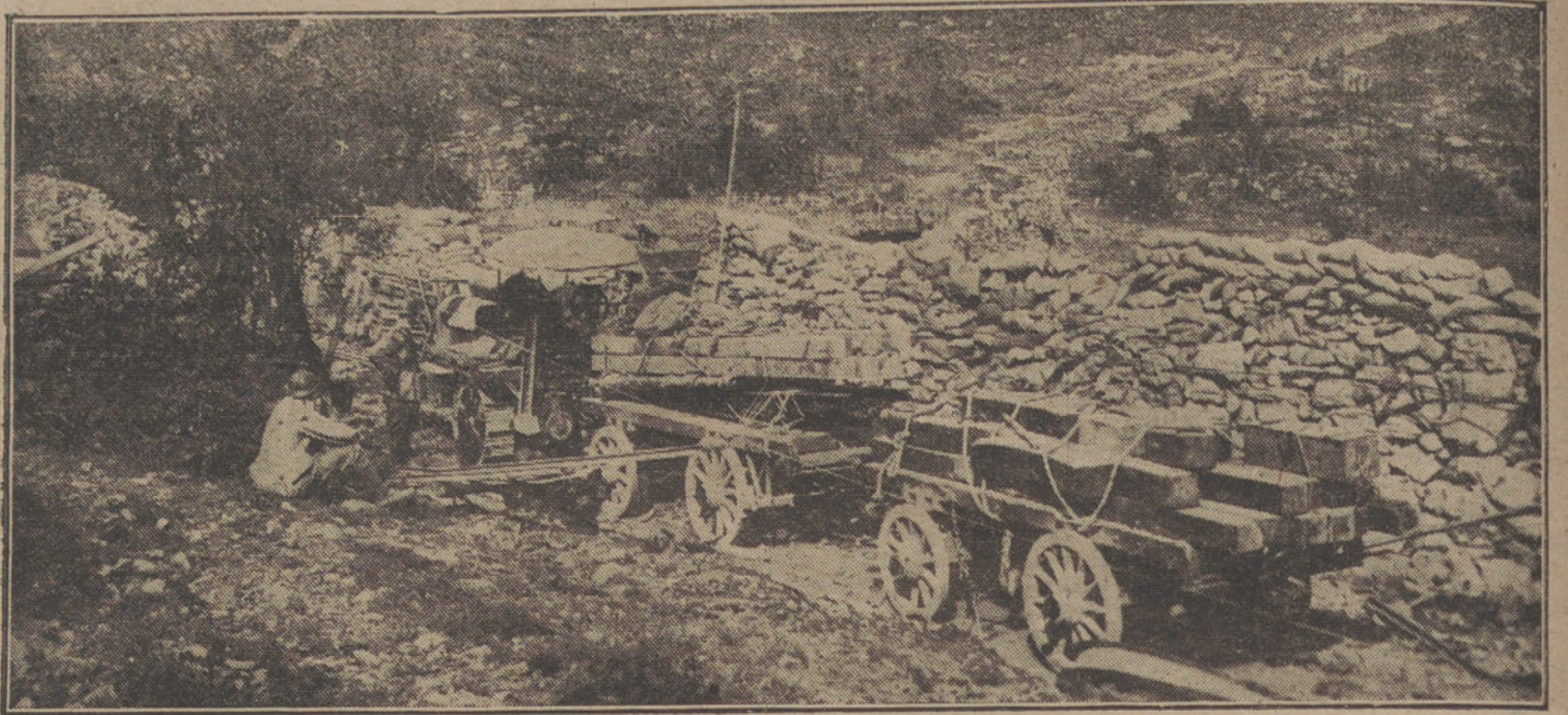
LA GUERRA EN EL FRENTE ITALIANO.—Piezas de Artillería y material para fortificaciones, transportado por máquinas de formidable tracción.