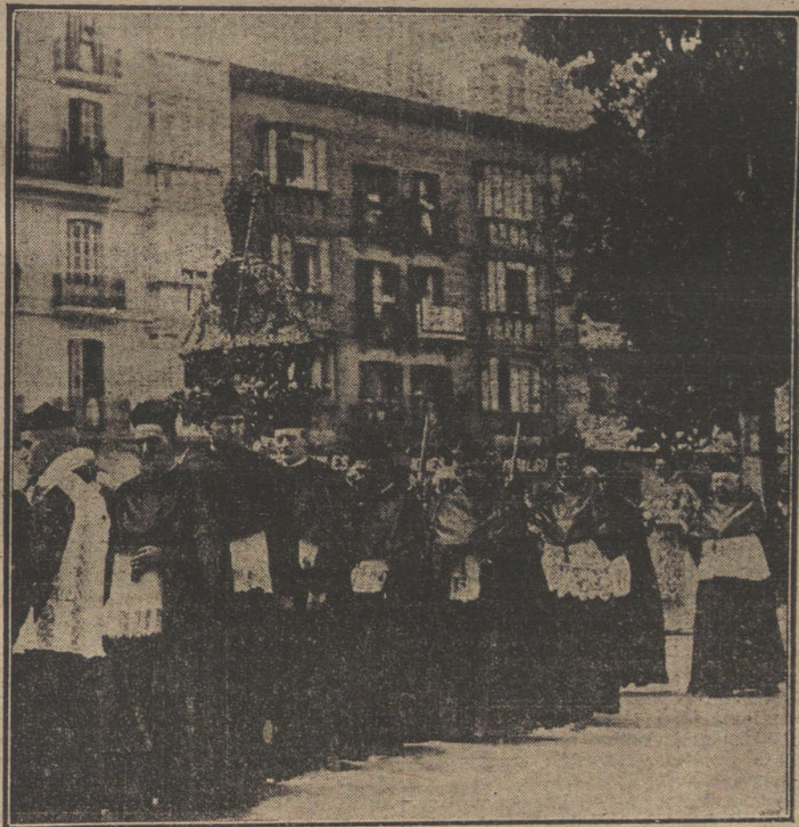
LAS FIESTAS DE SAN FERMIN EN PAMPLONA.—Un detalle de la tradicional procesión.

Almuerzos y comidas, 5 pesetas, con vinos de la Rioja. Música a todas horas. Teléfono 3.225.