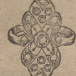
Núm. 14.—13 brillantes y diamantes. Ptas. 350.