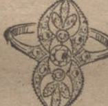
Núm. 10.—3 brillantes y diamantes. Ptas. 250.