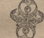
Núm. 11.—5 brillantes y diamantes. Ptas. 275.