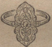
Núm. 9.—3 brillantes y diamantes. Ptas. 225.