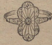
Núm. 3.—Un brillante y diamantes. Ptas. 95.