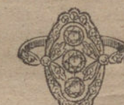
Núm. 12.—3 brillantes y diamantes. Ptas. 300.