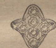
Núm. 16.—6 brillantes. Ptas. 400.