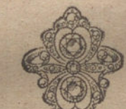
Núm. 19.—7 brillantes y diamantes. Ptas. 500.