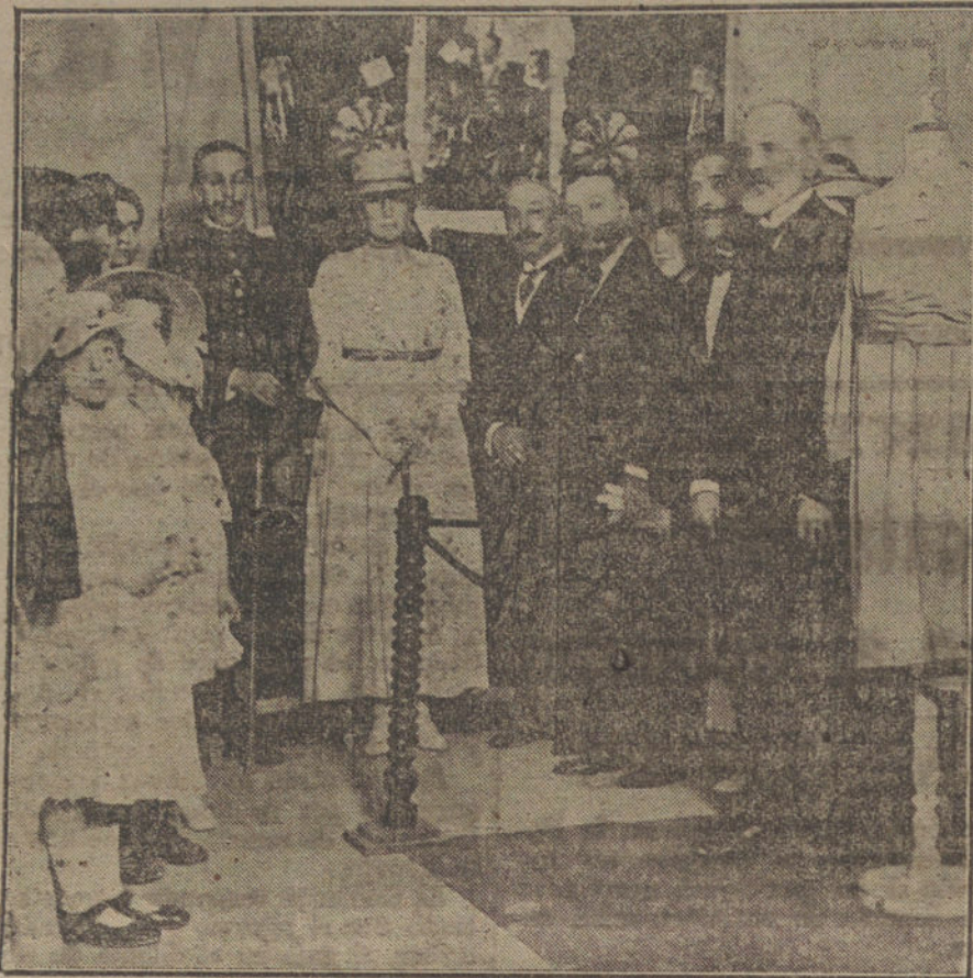
SS. MM. durante la clausura de la Exposición de labores, celebrada en el Centro Instructivo Comercial