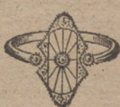
Núm. 1.—Un brillante y diamantes. Ptas. 85.

Monturas de platino fino y oro de ley 18 quilates contrastado