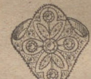
Núm. 15.—5 brillantes y diamantes. Ptas. 375.