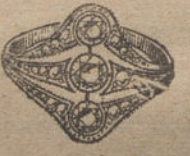
Núm. 17.—3 brillantes y diamantes. Ptas. 425.