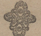
Núm. 13.—7 brillantes y diamantes. Ptas. 325.