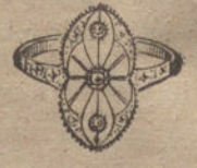
Núm. 4.—3 brillantes y diamantes. Ptas. 100.