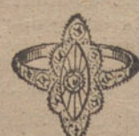
Núm. 2.—Un brillante y diamantes. Ptas. 90.