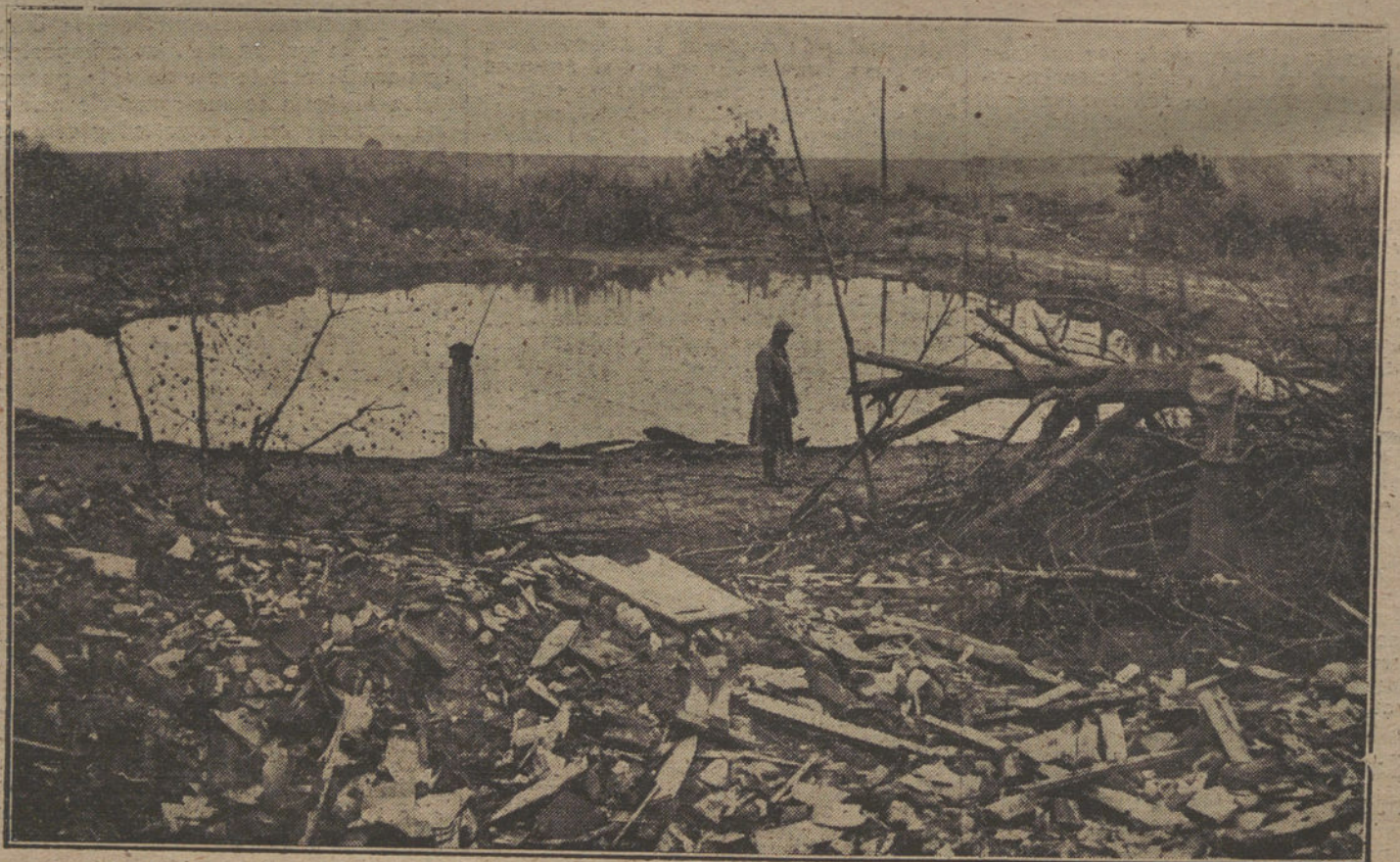
LOS DANOS DE LA GUERRA.—Ruinas de una pequeña villa del Norte de Francia, que ha sufrido durante las últimas operaciones repetidos bombardeos de ambos beligerantes.

Iglesia pontificia.—A las seis y media de la tarde, función de la Pia Unión de San Antonio, predicando el P. Amurrio.