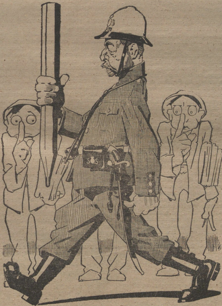
EL POLITICO Y LA MODA

Claro está, por lo tanto, que toda reunión de diputados que no haya sido convocada dentro de los términos constitucionales, no podrá ser considerada sino como una reunión particular, y en modo alguno podrá llamarse Congreso de Diputados ó Parlamento, ni sus acuerdos ni deliberaciones alcanzar el