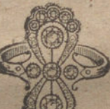
Núm. 18.—5 brillantes y diamantes. Ptas. 450.