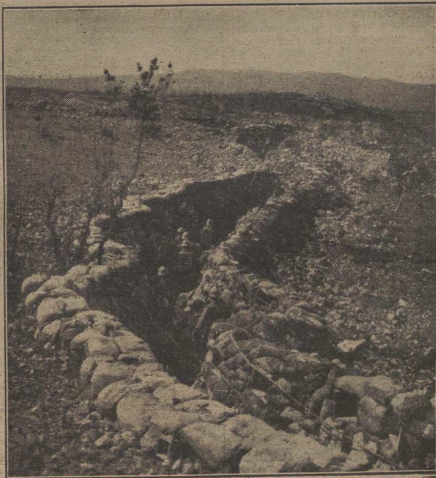
LAS NECESIDADES DE LA GUERRA.—Soldados italianos en las trincheras del frente austriaco. (Fot. LOUIS H.)

NUMERO DEL TELEFONO DE LA ADMINISTRACION DE «LA TRIBUNA» (PLAZA DE CANALEJAS, 6), 5.551