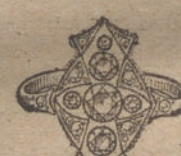
Núm. 20.—13 brillantes y diamantes. Ptas. 525.

Factura de garantía en todas las compras