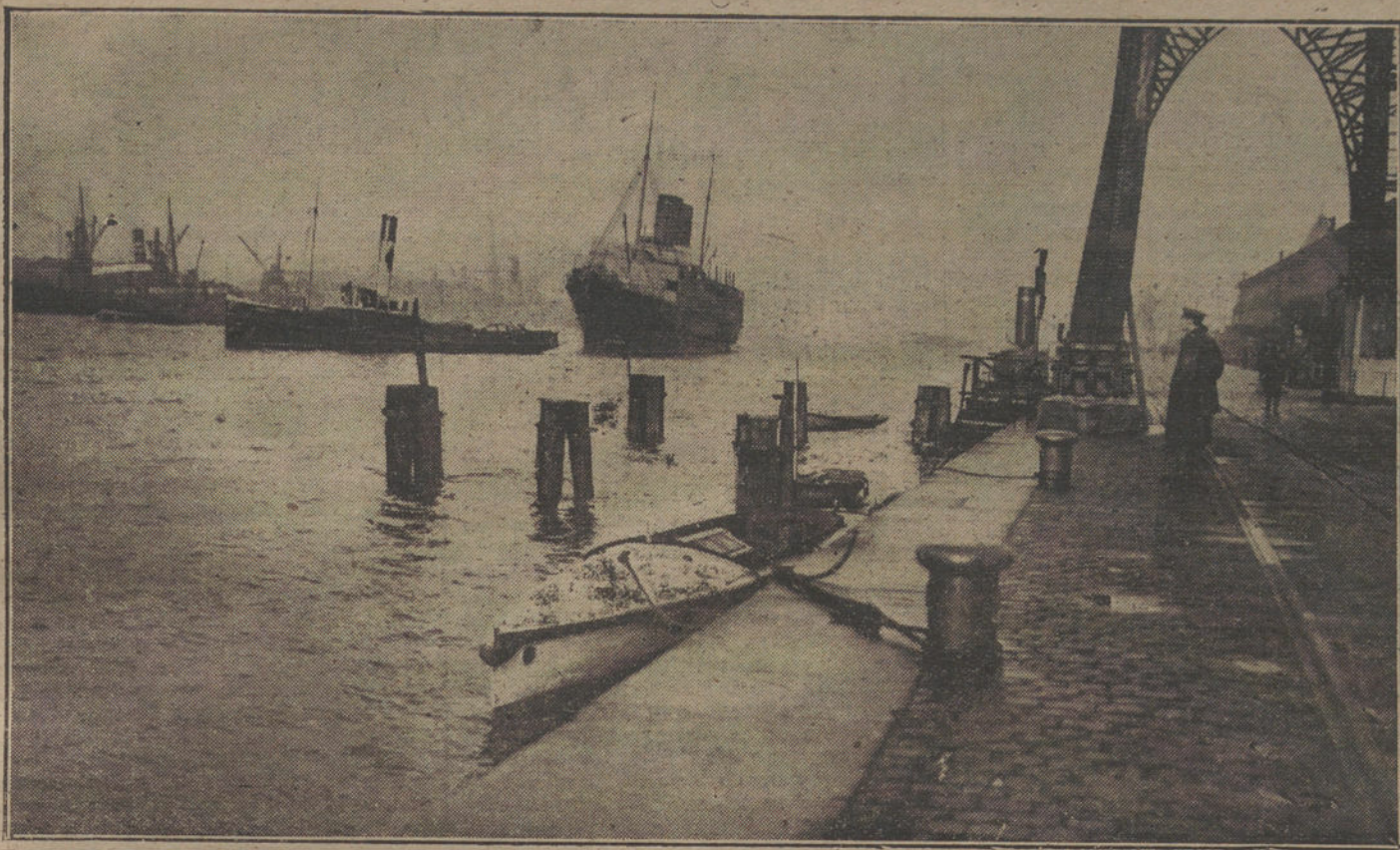
LA GUERRA EN EL MAR.—Aspecto del puerto de Rouen, vigilado por las tropas a la llegada de un transporte.

SAN ILDEFONSO. SS. MM. los Reyes son esperados hoy en ésta, adonde llegarán en automóvil, para veranear.