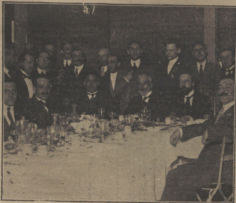
Mesa presidencial del banquete ofrecido anoche al Sr. Ro-

El comentario del periódico socialista «Avanti» ha sido tachado por completo por la censura.