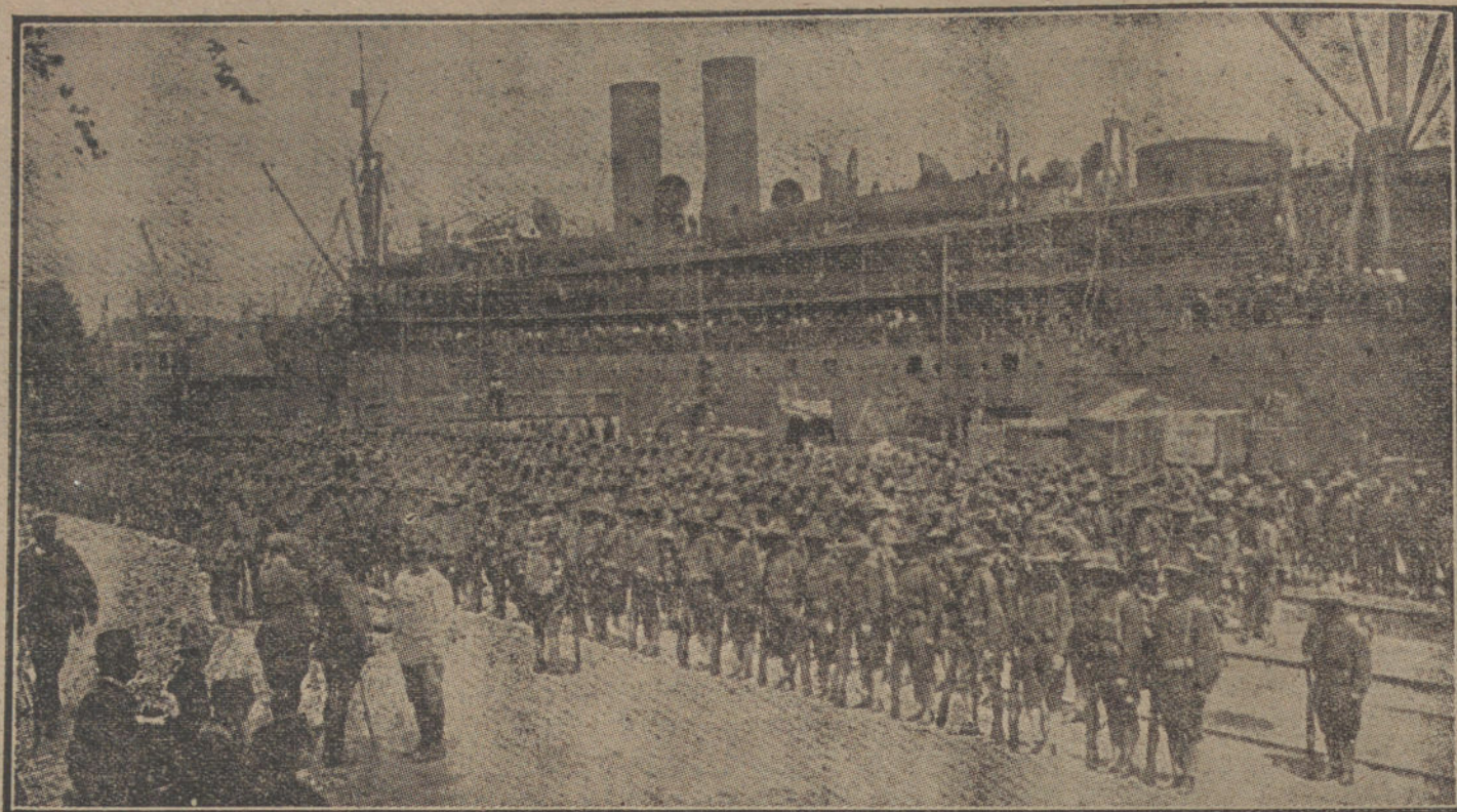
LOS NUEVOS FACTORES DE LA GUERRA.—Llegada á Francia de la primera división americana.

VALENCIA. En la Cámara de Comercio han celebrado los cosecheros y exportadores de patatas, naranjas, cebollas y frutas frescas una reunión, tratando de los perjuicios que les irroga la prohibición de las exportaciones, decretada por el Gobierno francés, y acordando dirigirse al Gobierno español para que gestione con aquél el cese de la prohibición.