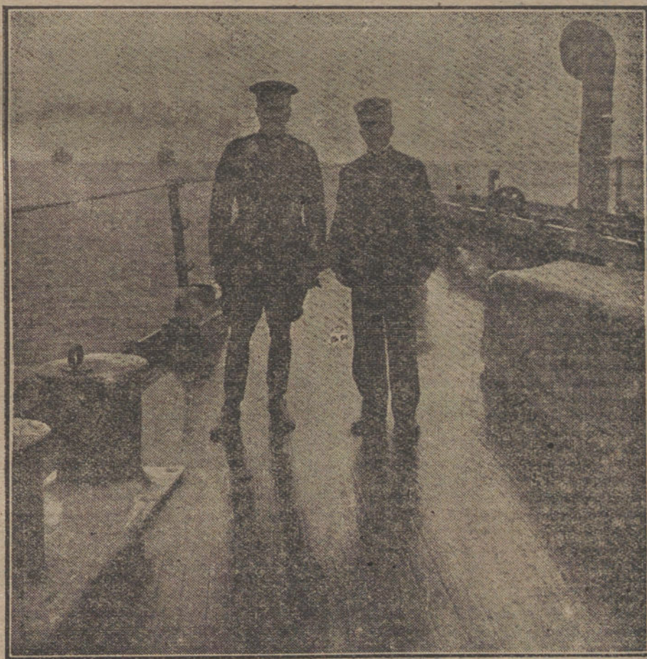
LOS PRIMEROS CONTINGENTES AMERICANOS EN FRANCIA.—El general Pershing y el vicealmirante Gleaves á bordo de uno de los barcos de guerra.

El Comité franco-suizo del Alto Ródano, que tiene por objeto coordinar los esfuerzos de ambos países, se reunió en Septiembre de 1915 en Lyon, y ya el Sindicato francés, terminados sus trabajos, ha calculado prudencialmente que el tonelaje anual de Lyon-Ginebra por vía fluvial alcanzaría unas 300.000 toneladas, sin causar perjuicio alguno á los ferrocarriles.