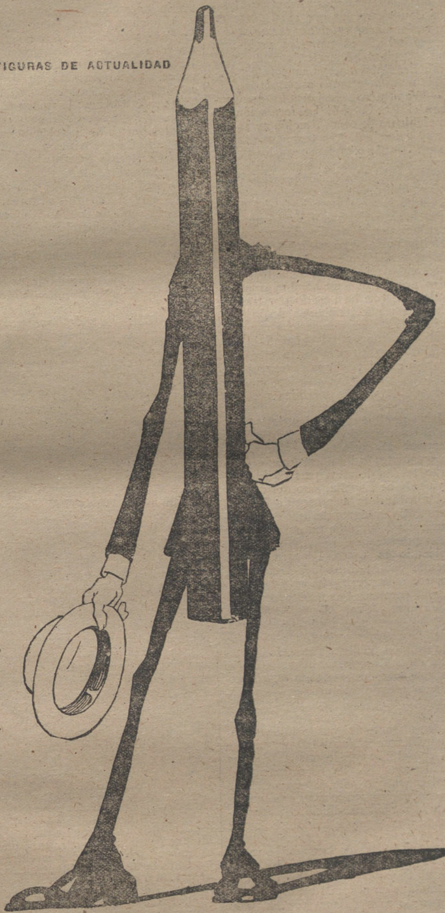
DON LAPIZ En las actuales circunstancias es á lo único que se le ve la punta. (Caricatura de AGUSTIN.)

depositario al Seminario de los títulos de la Deuda precisos, para que con sus rentas se pague la carrera militar á dos hijos de guardias civiles.