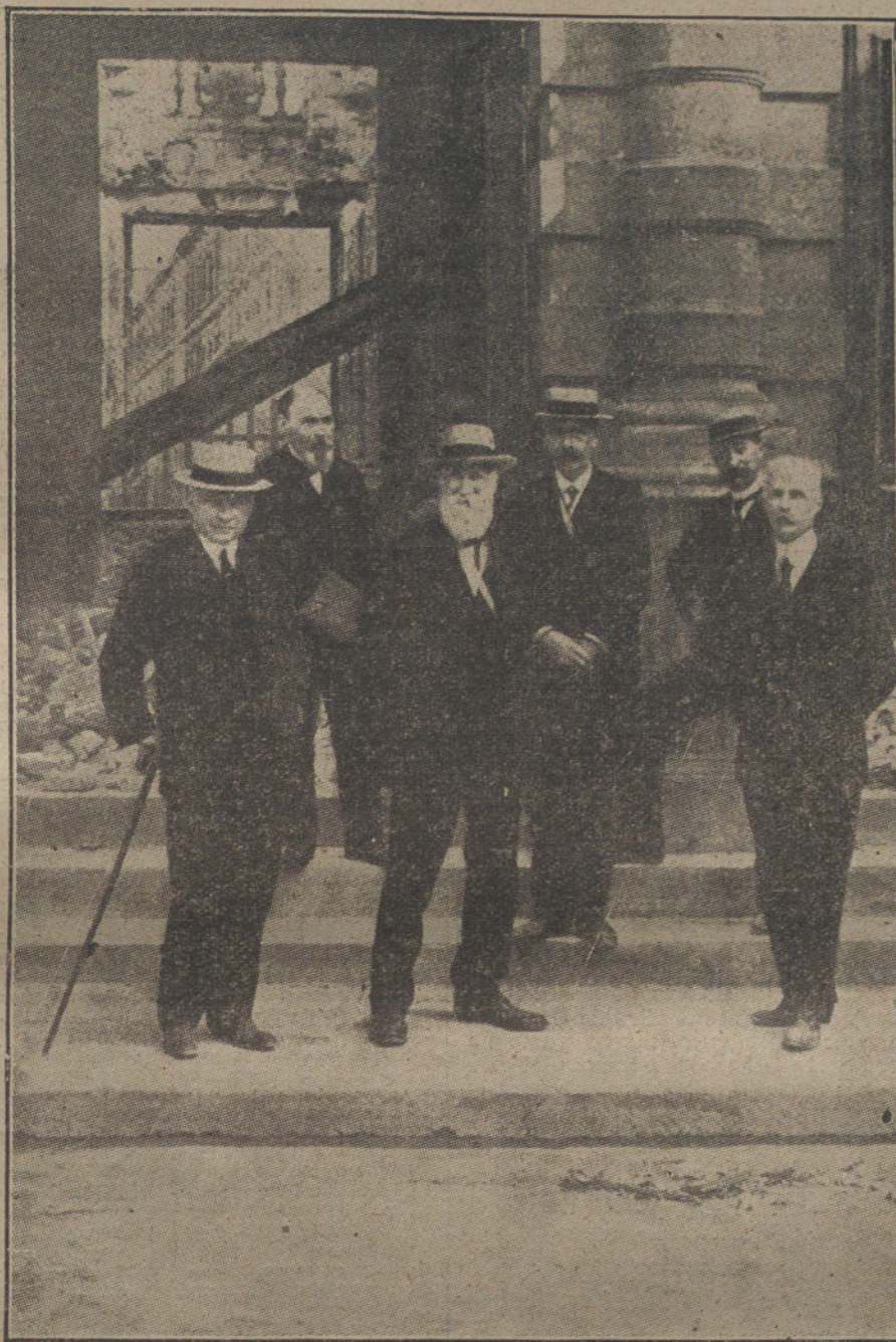
LA GUERRA EN FRANCIA. El Ayuntamiento de Reims, a la puerta del Palacio municipal, destruido en uno de los últimos bombardeos.

La Asamblea de las Diputaciones vascas comenzará mañana, a las diez. Reina gran entusiasmo.