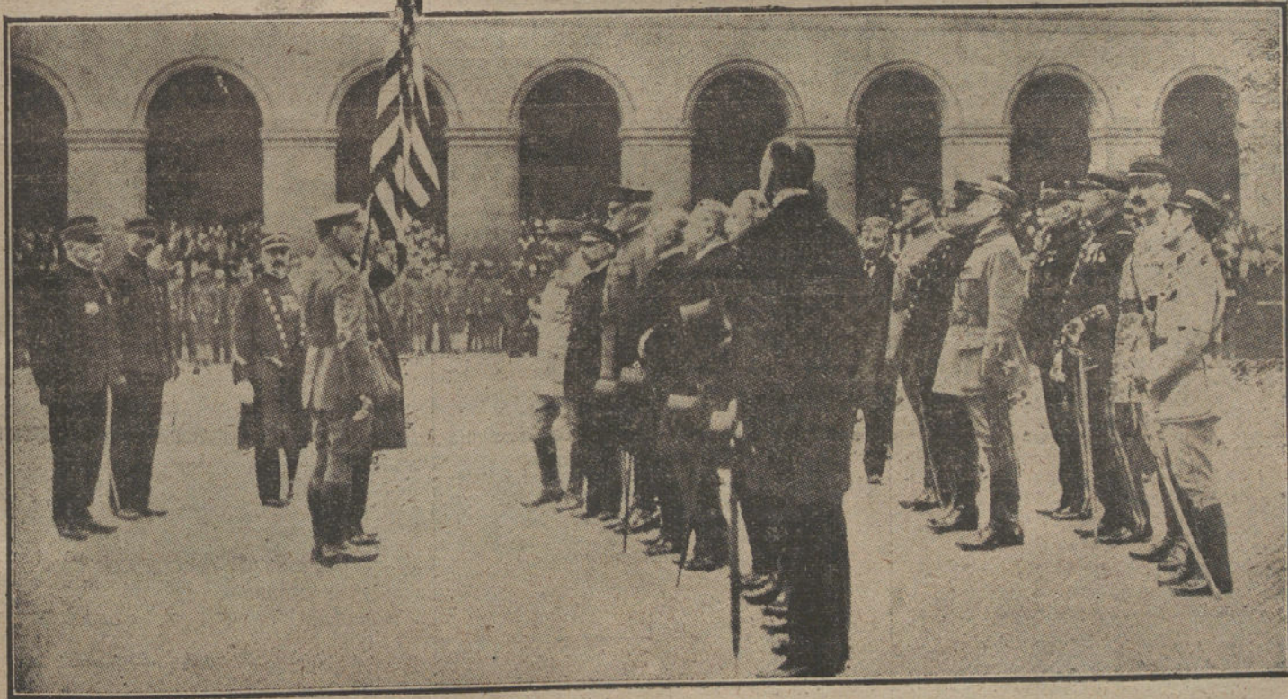
FRANCESES Y NORTEAMERICANOS.—Fiesta celebrada en el cuartel de Invalides de París para presentación de los voluntarios norteamericanos que tomaron parte en la guerra del 70.

Respecto a la solución propuesta por el Sr. Cambó y sobre formación de un Gobierno nacional o de concentración, hice