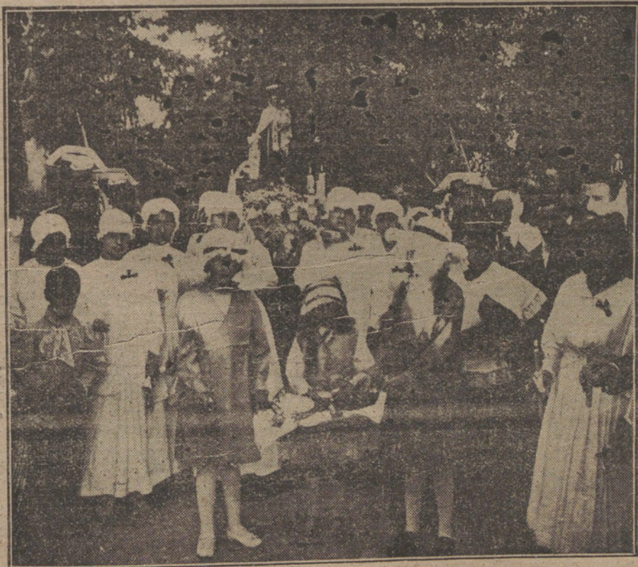
LA FIESTA DE LA VIRGEN DEL CARMEN. — Procesión verificada ayer tarde en Instituto Rubio.