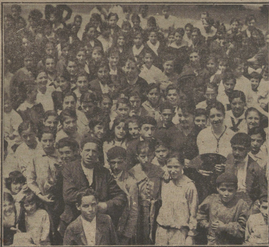
Manifestación de modistas, en huelga, verificada en Santander, y que dió lugar a la intervención de la fuerza pública.