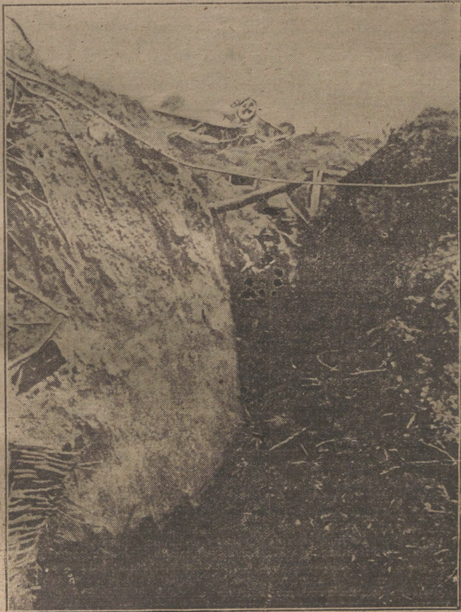
LA GUERRA EN FRANCIA.—Trinchera francesa en un puesto avanzado de observación.