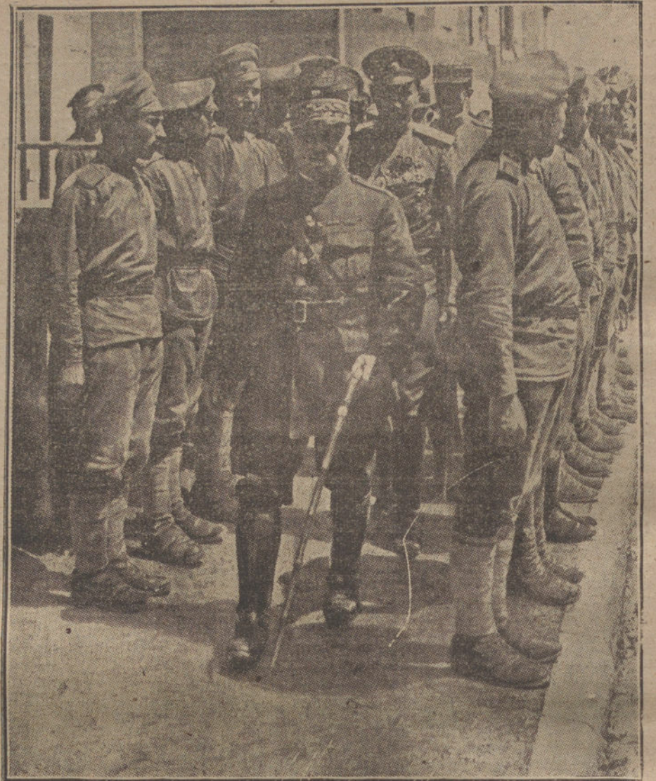
LOS ALIADOS EN LA GUERRA.—Llegada á Francia de los primeros contingentes rusos.

NUMERO DEL TELEFONO DE LA ADMINISTRACION DE «LA TRIBUNA» (PLAZA DE CANALEJAS, 6), 5.551