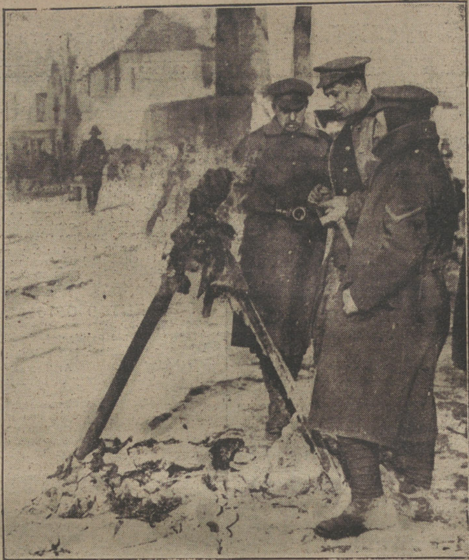
LA GUERRA EN FLANDES.—Soldados ingleses de vigilancia, a la entrada de una aldea.

En el término municipal de Brazortas, hallándose cargando una escopeta el guardia Tomarot, se le disparó el arma, causándole el proyectil una herida grave en una pierna.