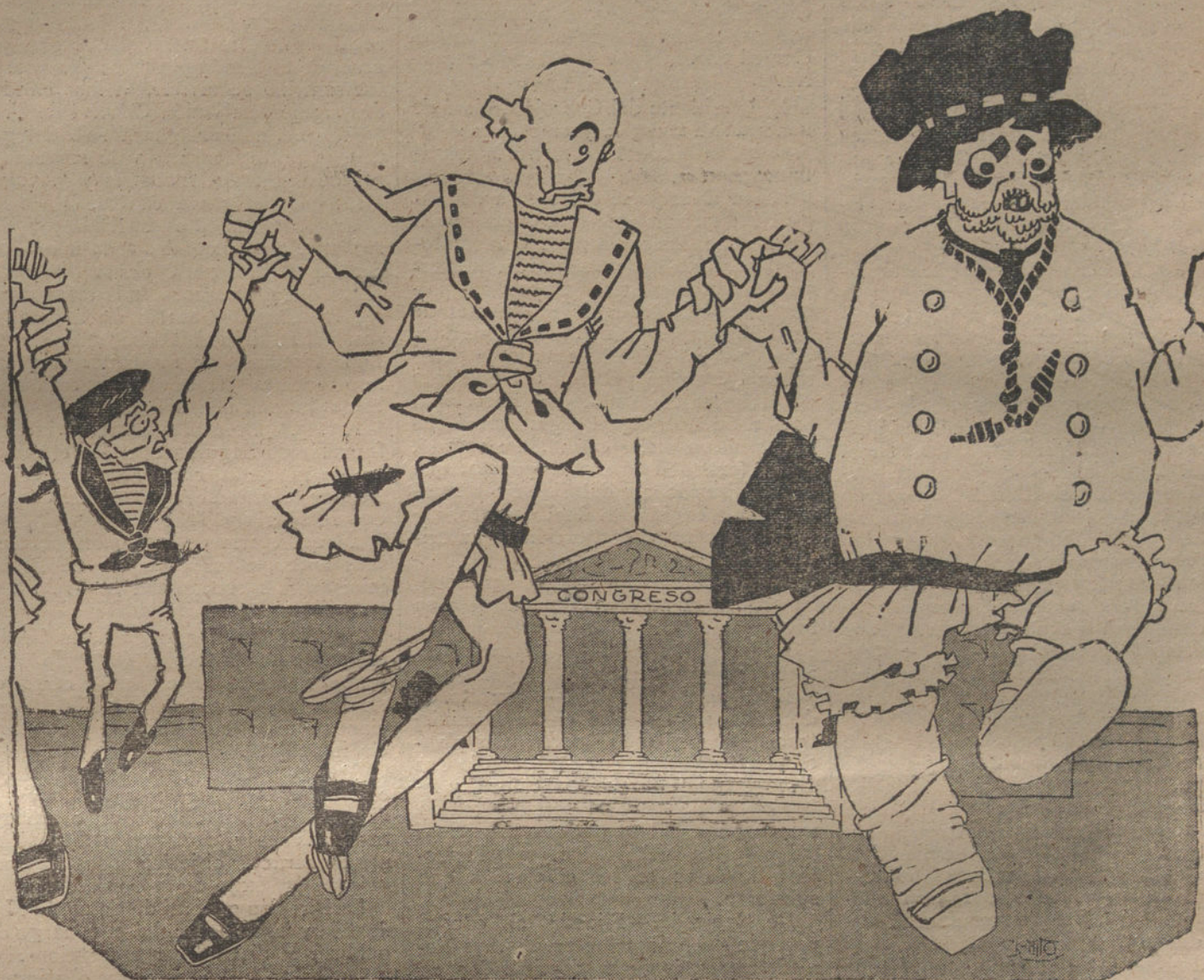
JUEGOS DE CHICOS «A tapar la calle, que no pase nadie.»

Las profanas se celebran con la mayor concurrencia.