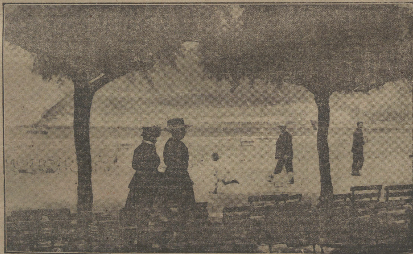
EL VERANEO DE LA FAMILIA REAL.—S. M. la Reina Doña Victoria, por el paseo de la Concha, de San Sebastián.