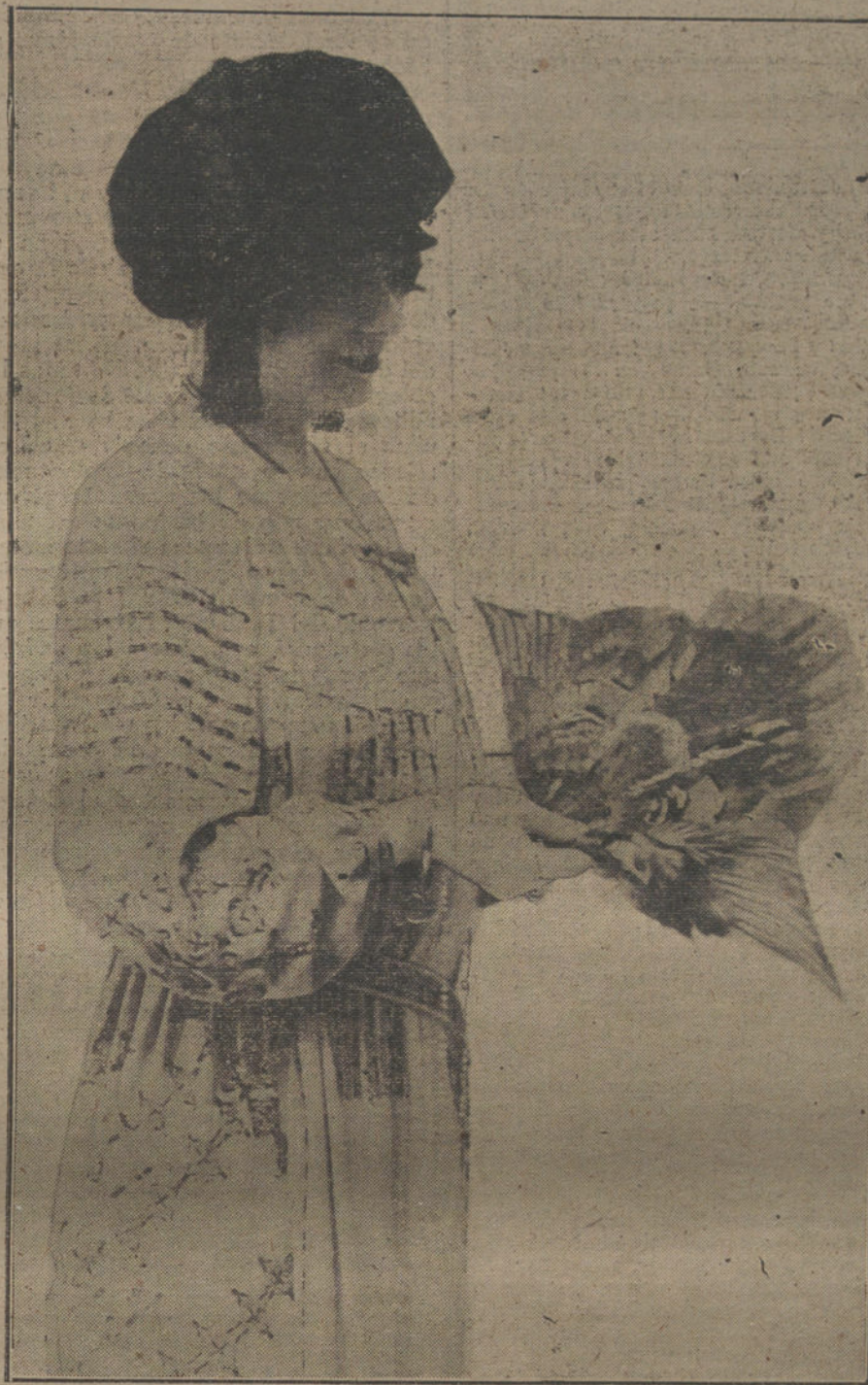
Traje-bata y originalísimo abanico, modelo de la Casa Duvelloy.