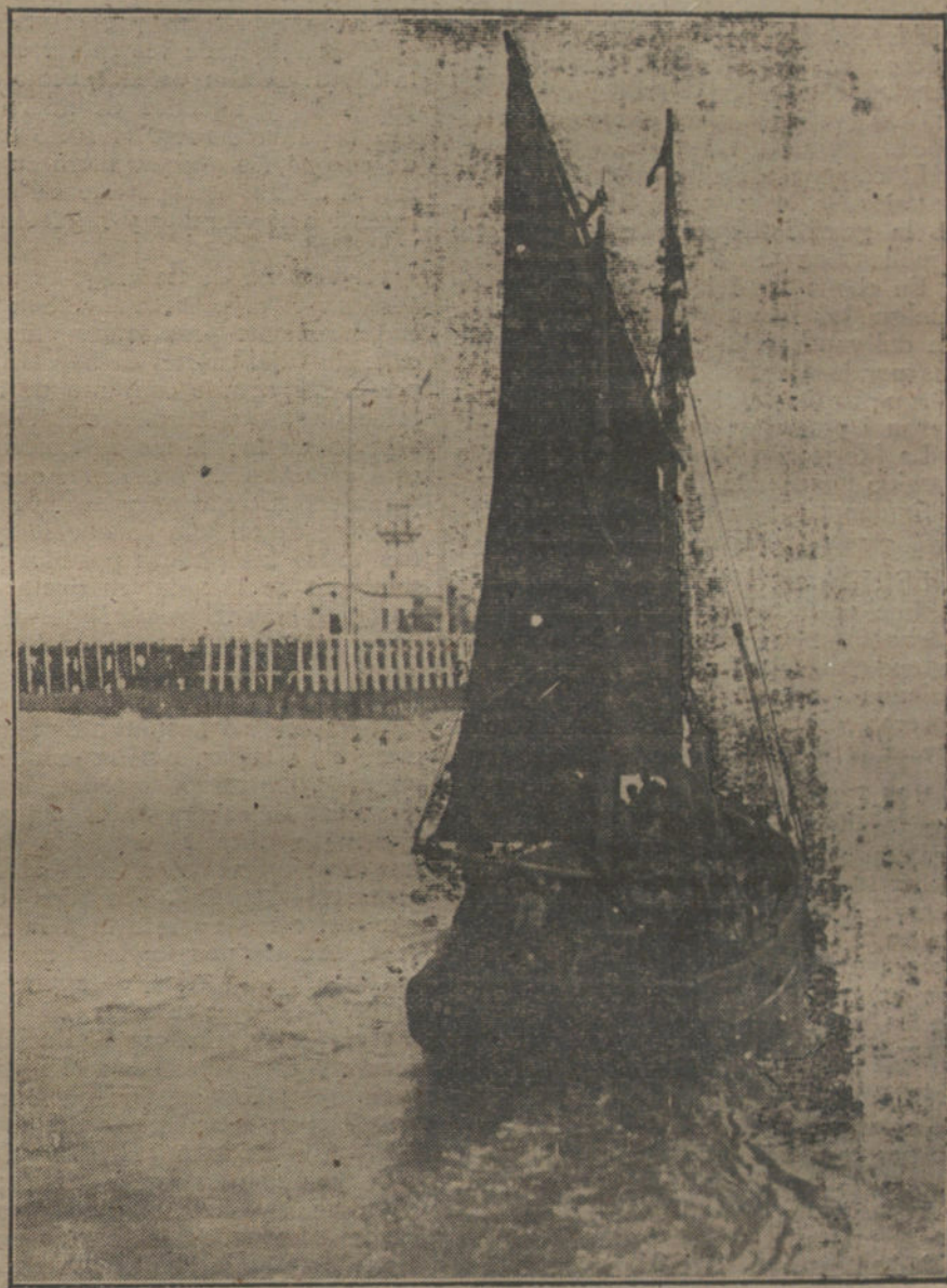
LA GUERRA EN EL MAR.—«La mina», velero armado para la vigilancia de las costas francesas.

No queremos entender la conminación, ó simplemente el reproche que esas líneas encierran. Mentar el agradecimiento al Gobierno por unas exiguas ventajas materiales; hablar de sacrificios y gestiones que, beneficiando a todos, beneficiaban también al «A B C», y no en grado menor que a los demás; erigirse en Mecenaz de los periódicos, evocando los esfuerzos pasados, para obligar con la gratitud, son tópicos de muy mal gusto, que no