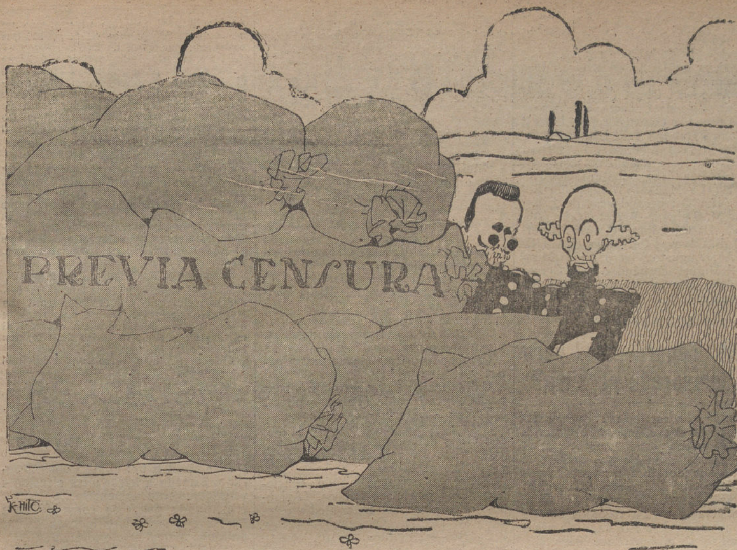
LA VIDA EN LAS TRINCHERAS