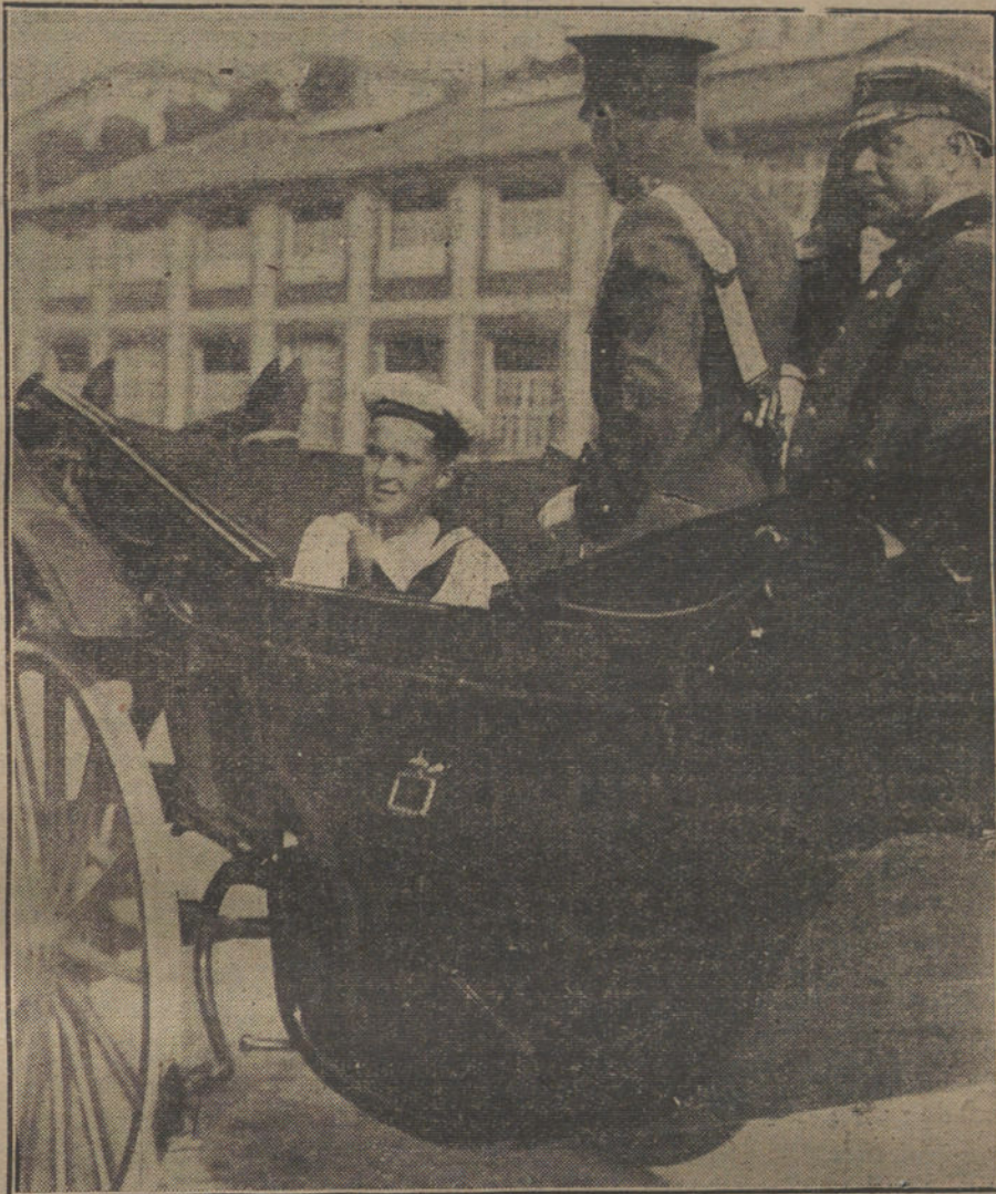
EL VERANEO DE LA FAMILIA REAL.—El Principe de Asturias á su llegada á Santander.

¿Cuándo, dónde y de qué manera ha encontrado plausibles LA TRIBUNA esos procedimientos de «boycott», ensayados por parte de la Prensa barcelonesa contra el «A B C»? Por no hallarlos, no ya plausibles, sino ni siquiera explicables, nos parecía igualmente