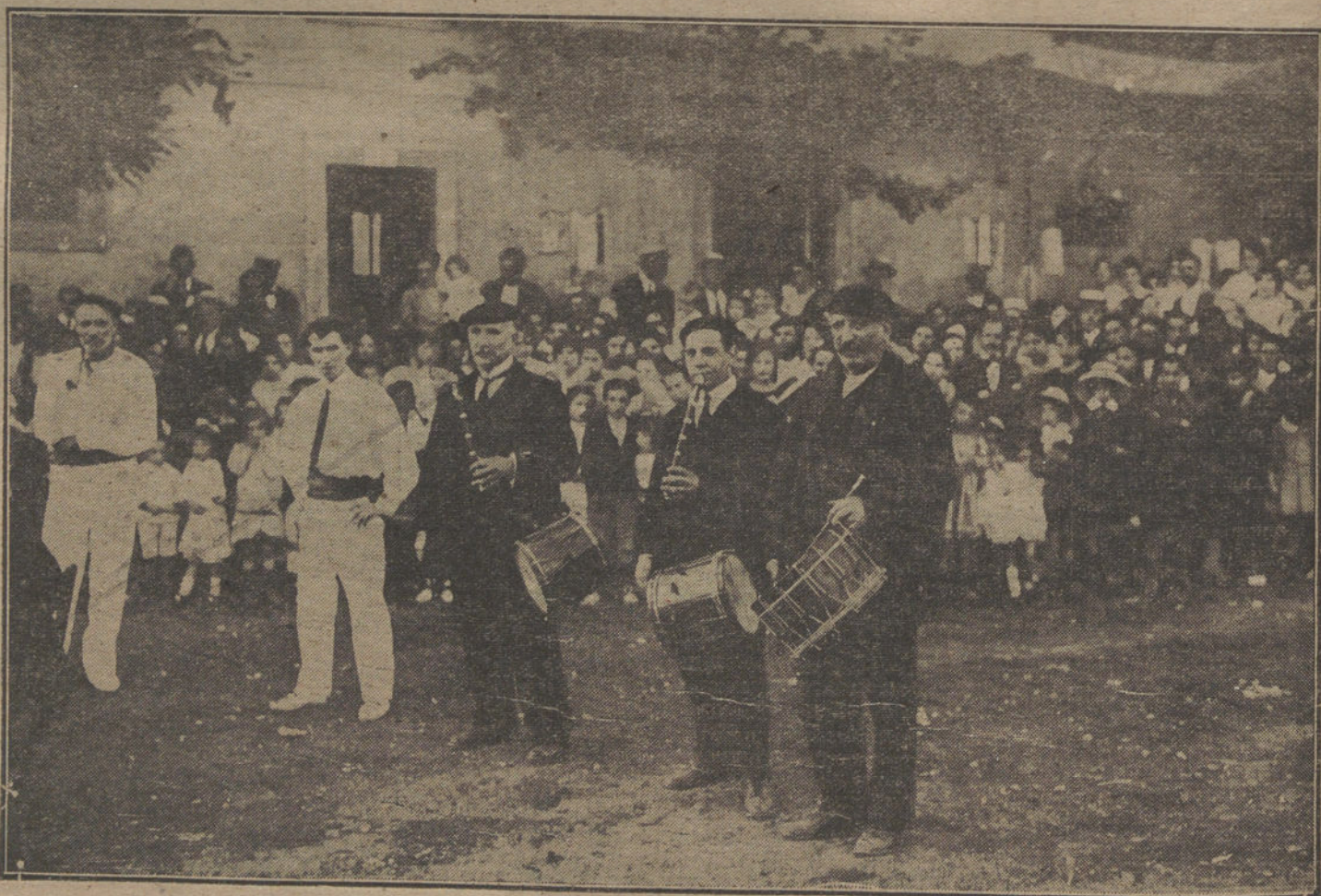
FIESTAS DE VERANO.— Los típicos «Gkistularis», que toman parte en los festejos celebrados en Renteria.

Los aviadores compiten entre sí en vuelos de varias horas de reconocimiento y de larga distancia, durante los cuales, arrojando bombas y atacando