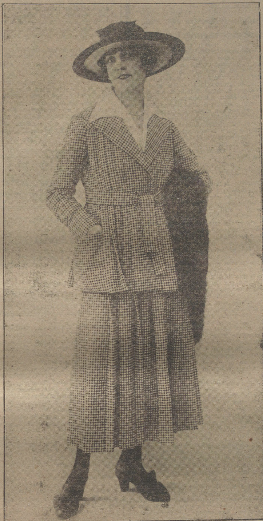
Sencillo y elegante traje de mañana, presentado por la Casa Acavone, de París.

con ametralladoras, tratan de sembrar la mayor confusión en las columnas rusas en retirada. Pequeñas y grandes cantidades de prisioneros rusos afluyen por todos los caminos a los puntos de concentración. El botín, dispersado por el enorme campo de operaciones, no puede aún calcularse, ni aproximadamente. Unos tres mil kilómetros cuadrados de terreno han sido ya arrebatados a las manos de los rusos. Igualmente han sido ya compensadas hace tiempo las ventajas territoriales que pudo alcanzar Brusiloff en su última ofensiva. En impetuoso ataque tomaron los centrales la ciudad de Tarnopol, que estaba ardiendo por muchos puntos, y la altura de Grel Zahira, situada al Sur rechazando sangrientamente contraataques rusos.