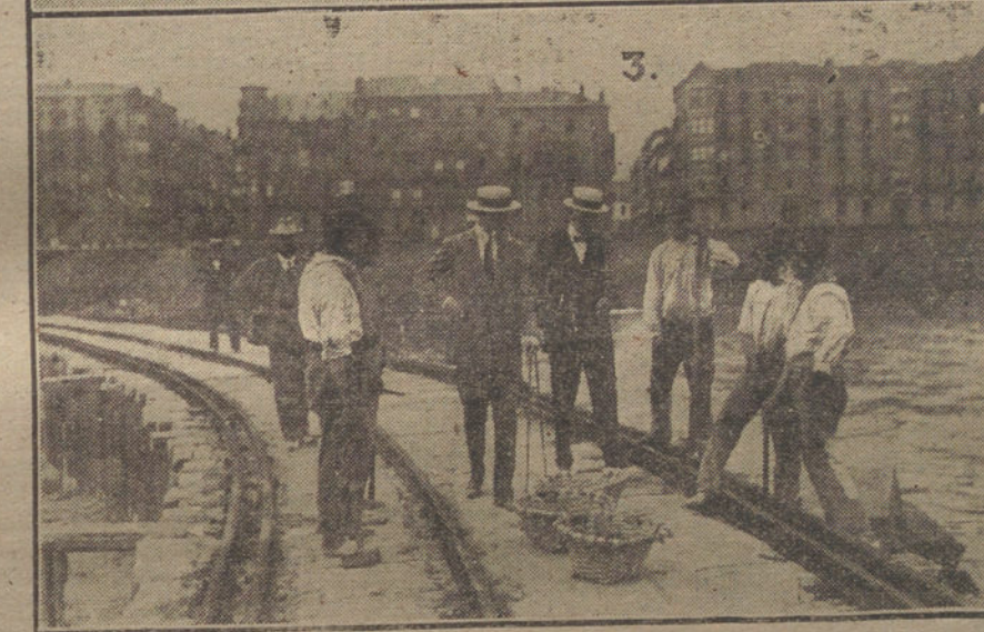
LAS REFORMAS DE SAN SEBASTIAN. —Número 1: S. M. el Rey viendo los planos del proyectado gran paseo del Monte Urgull.—Número 2: S. M. la Reina Cristina inaugurando el trozo terminado del paseo del Monte Urgull.—Número 3: Visita de S. M. el Rey, acompañado del duque de Miranda, al barrio de Gros, donde se efectúan trabajos para construcción del nuevo puente y parque.