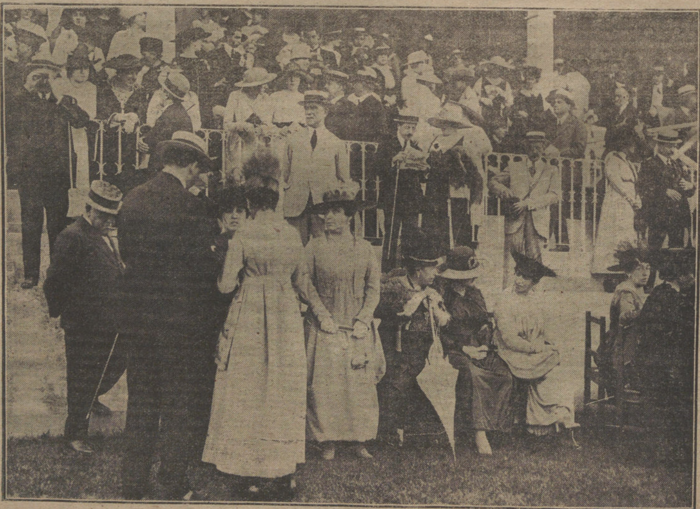
CARRERAS DE CABALLOS EN SAN SEBASTIAN.—Un aspecto de las tribunas del Hipódromo de San Sebastián durante las carreras verificadas el día de Santiago.

El periódico socialista «Internationale Korrespondenz» comenta los últimos discursos de Carson y Lloyd George, así co-