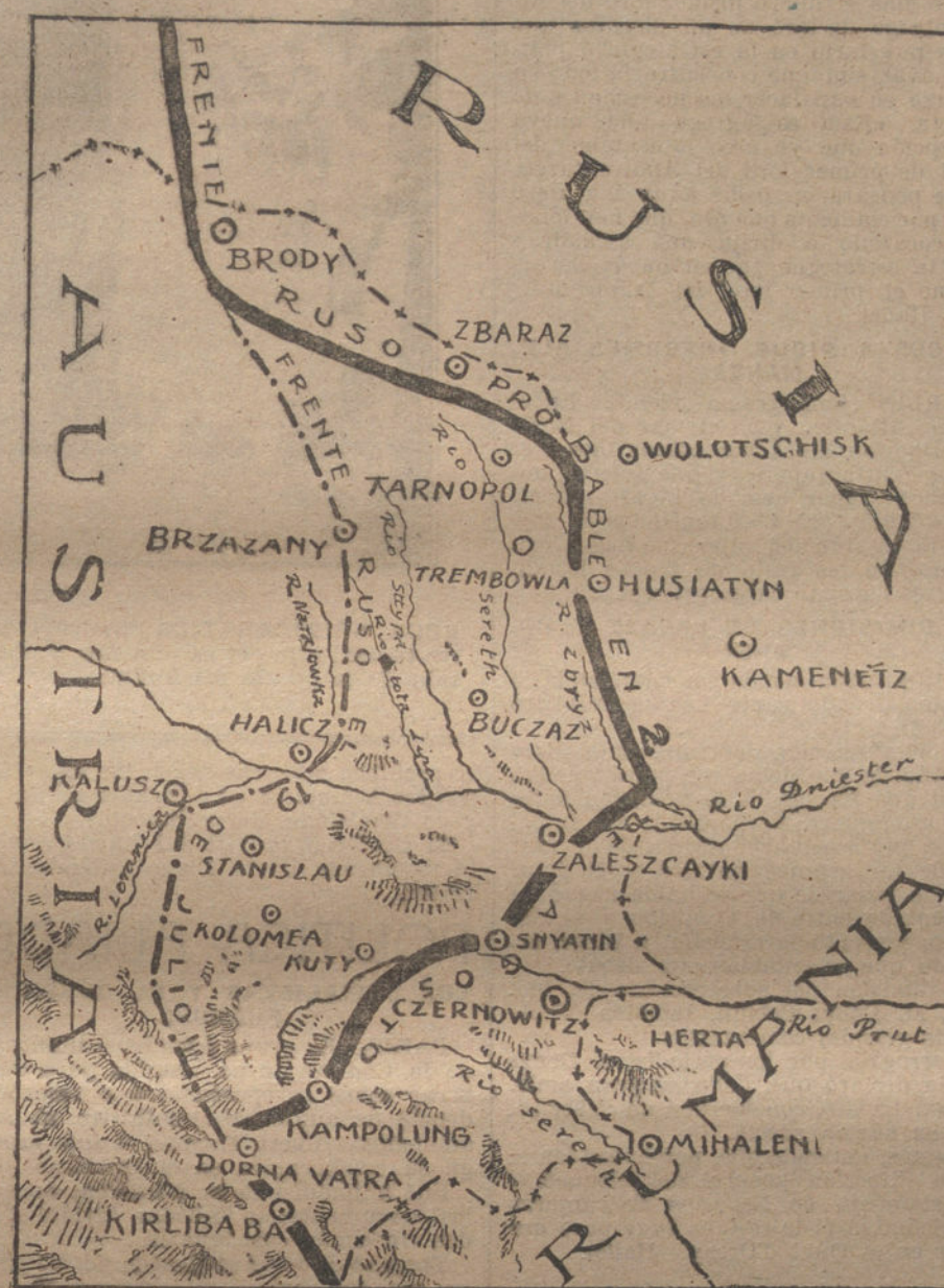
Situación actual de la línea de combate en el frente austrorrumano.

En este aspecto ha podido el canceller del Imperio hacer muy interesantes declaraciones criticando las Asambleas secretas de la Cámara francesa, donde fue acusado el Gobierno por los elementos parlamentarios pacifistas, que censuraron el hecho de haber concertado Francia, días antes de la revolución rusa, planes conquistadores con el Gobierno zarista. Francia se hizo prometer en esos tratos, no sólo la Alsacia,