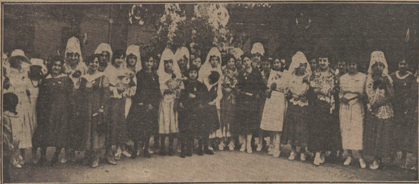
LOS FESTEJOS DE LOS CUATRO CAMINOS. —Grupo de bellas señoritas de aquella barriada que han repartido comidas y donativos en metálico á los pobres del distrito.