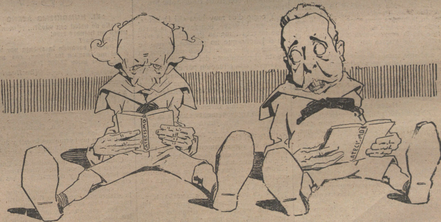
LOS MANDAMIENTOS DE LA LEY... DEL EMBUDO

Mañana, pasado, al otro, quizás, estaremos otra vez bajo el lápiz del censor. No sabemos lo que harán los periódicos. Pero decimos que el silencio obligado no servirá de nada, como no sea de acicate y estímulo para que la revolución se abra camino y alcance proporciones turbulentas, que nunca debió tener este movimiento ciudadano, sereno, meditado, patriótico y regenerador.