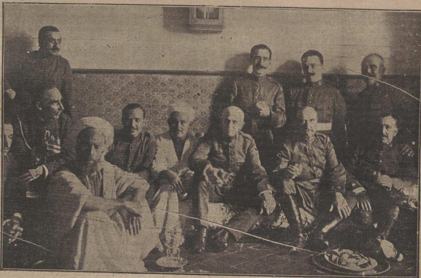
LAS PASCUA MORA EN MELILLA. —El general Monteverde, el coronel Suárez-Inclán y los oficiales de la Oficina Indígena, tomando el té en casa del Bachir, representante del Sultán, al que felicitaron con motivo de la celebración de la Pascua.

Todas las tentativas de los rusos y rumanos por medio de ataques en el valle de Putna, para influir en las operaciones de la Bucovina, fracasaron