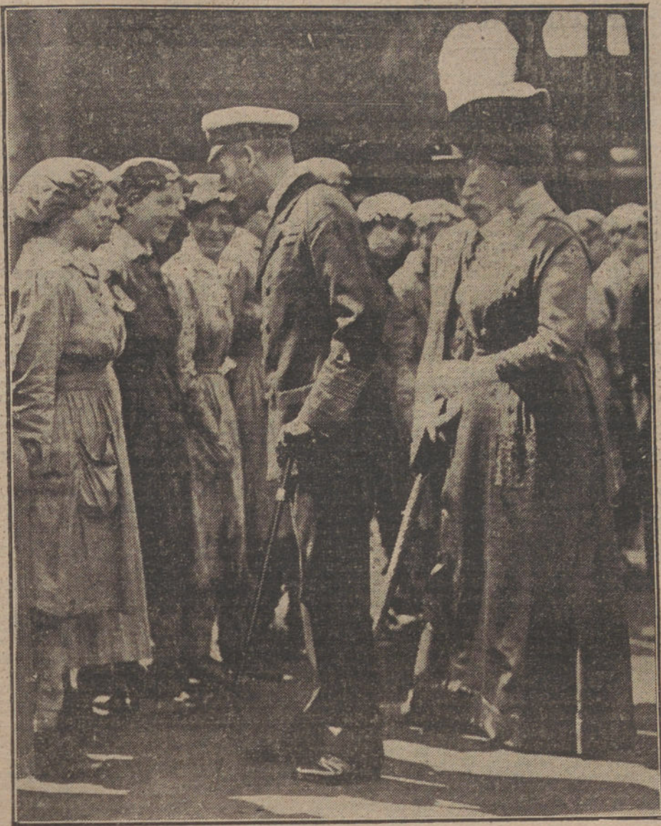
LA GUERRA DESDE LONDRES.—Los Reyes de Inglaterra durante la visita á una fábrica de municiones, conversando con algunas operarias.

ante la heroica resistencia de nuestros defensores. Entre tanto, hemos conseguido desalojar á los rusos de todas sus posiciones en la región de la desembocadura del Ebrucz, en el Dniester.