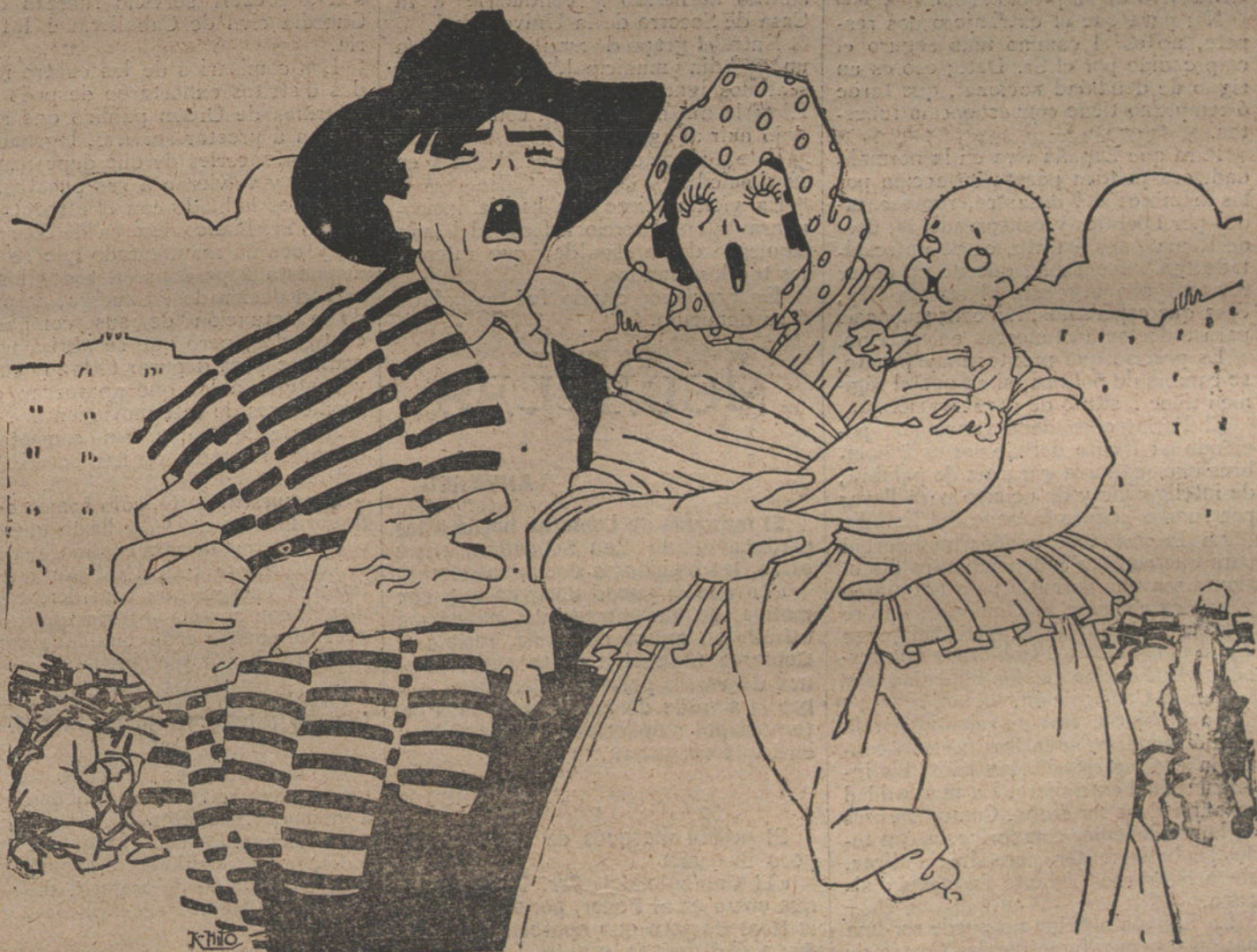
LA BOLA DE GOBERNACION

Esa política que hemos contemplado durante el presente año, desde el Poder representada por liberales y conservadores, no quiere ir al Parlamento, porque ni Romanones, ni García Prieto, ni