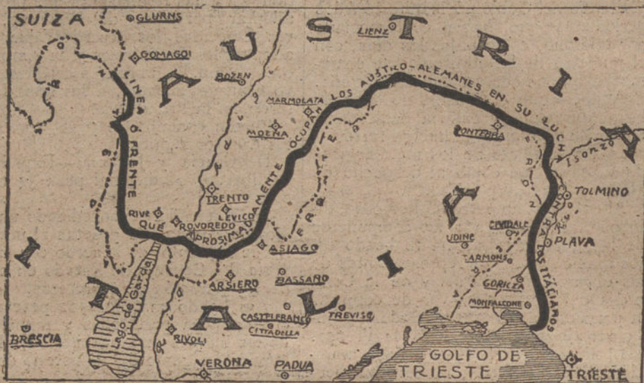
La línea de fuego en el frente italiano.

Los atacantes no proseguirán sus intentos de avance hasta que su Artillería