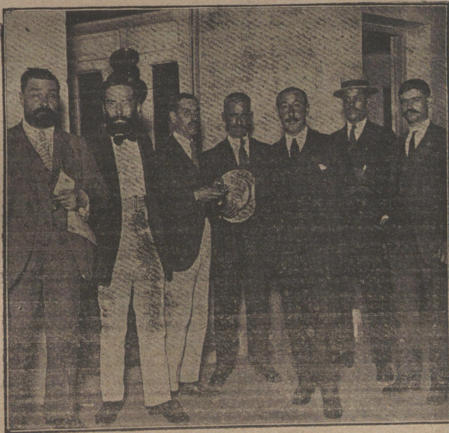
EL CONFLICTO FERROVIARIO.—Los delegados del Sindicato general, saliendo de la Casa del Pueblo, donde se reunieron ayer, para acordar la contestación que han de dar á las Compañías.

La censura debe tener presente la precipitación, la que podemos llamar ale-