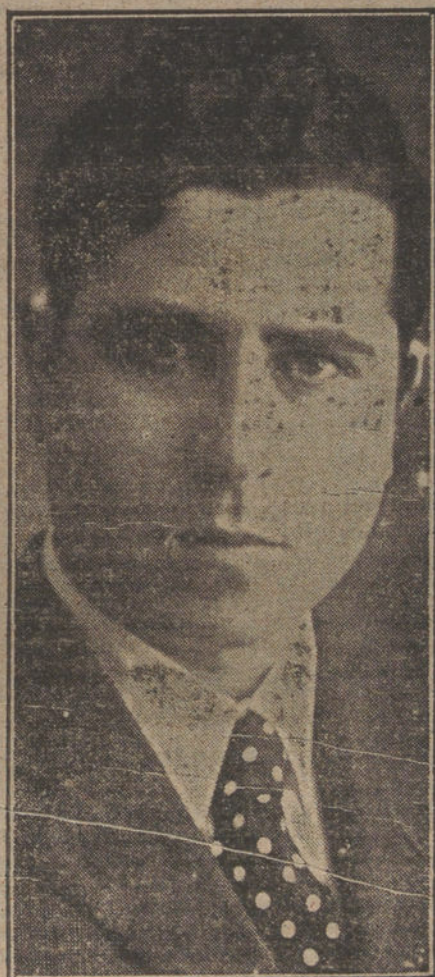
Ramón Gómez de la Serna, que acaba de publicar tres nuevos libros «Greguerías», «Senos» y «El circo».