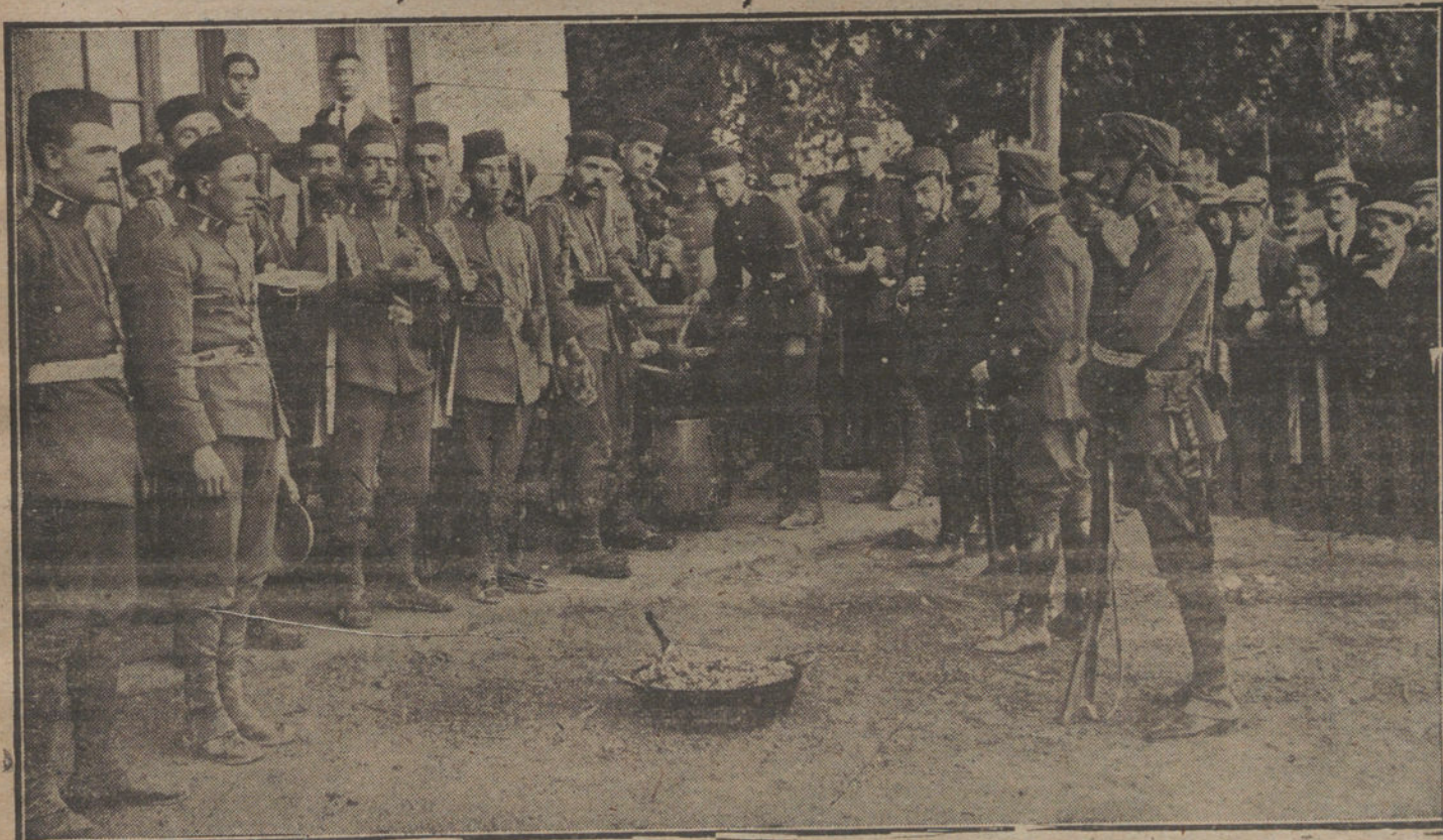
Soldados del regimiento de Ferrocarriles que prestan servicio en la estación.

Como medida de precaución, las autoridades ordenaron que las puertas de la estación que dan al paseo de la Boma-