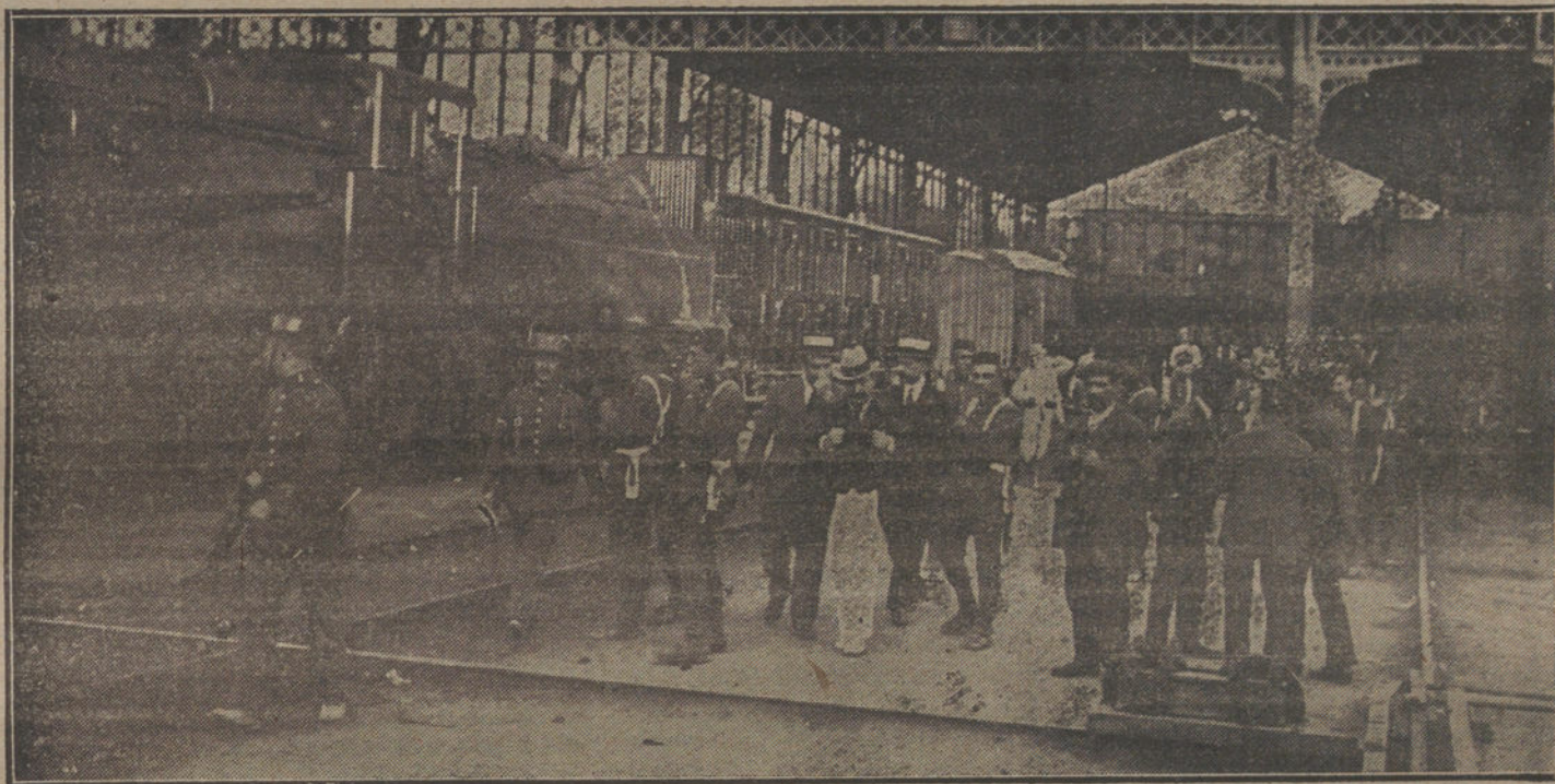
Aspecto de los andenes de la estación del Norte al comenzar la huelga de ferroviarios.

No creemos, sin embargo, a pesar de los reiterados optimismos ministeriales y de las buenas impresiones del parte oficial, que el triunfo esté descontado. Precisamente de la desorganización de los obreros puede surgir el verdadero conflicto de orden público. Al darse cuenta éstos de que han sido víctimas de una maniobra política enminada a afianzar una situación desdichada, arrearán en la protesta, y buscarán repre-