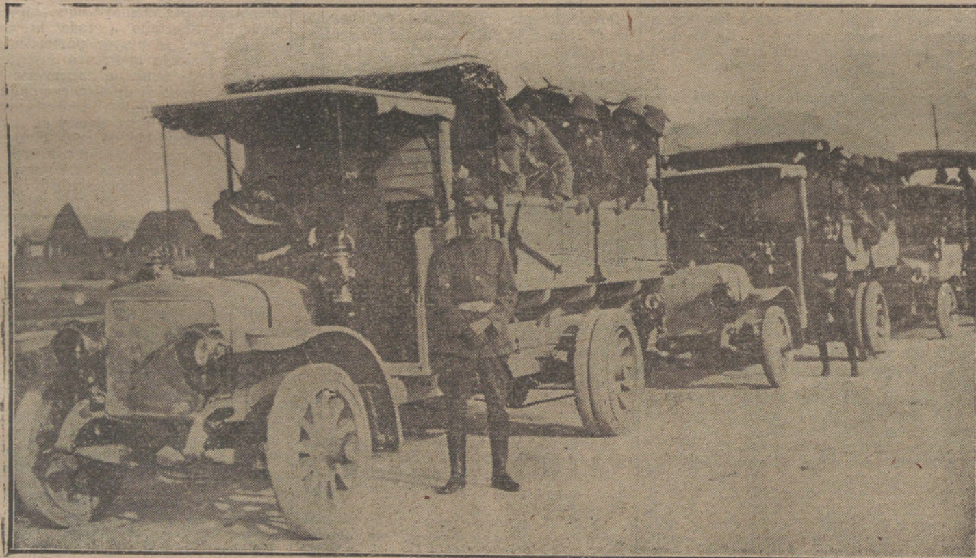
NUESTRAS TROPAS EN AFRICA.—Ensayo de transporte de tropas en los camiones automóviles de Ingenieros afectos á la Comandancia general de Melilla. Marcha de dos compañías del 68 á Monte Arruit, con equipo completo é impedimenta.