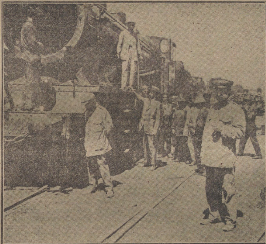
El duque de Zaragoza, disponiéndose a conducir uno de los trenes que han salido esta tarde.

Regístrase a primera hora algún incidente de escasa importancia, y fué detenido un huelguista llamado Andrés Gutiérrez, por haber amenazado con degollar a varios obreros que se dirigían al trabajo.