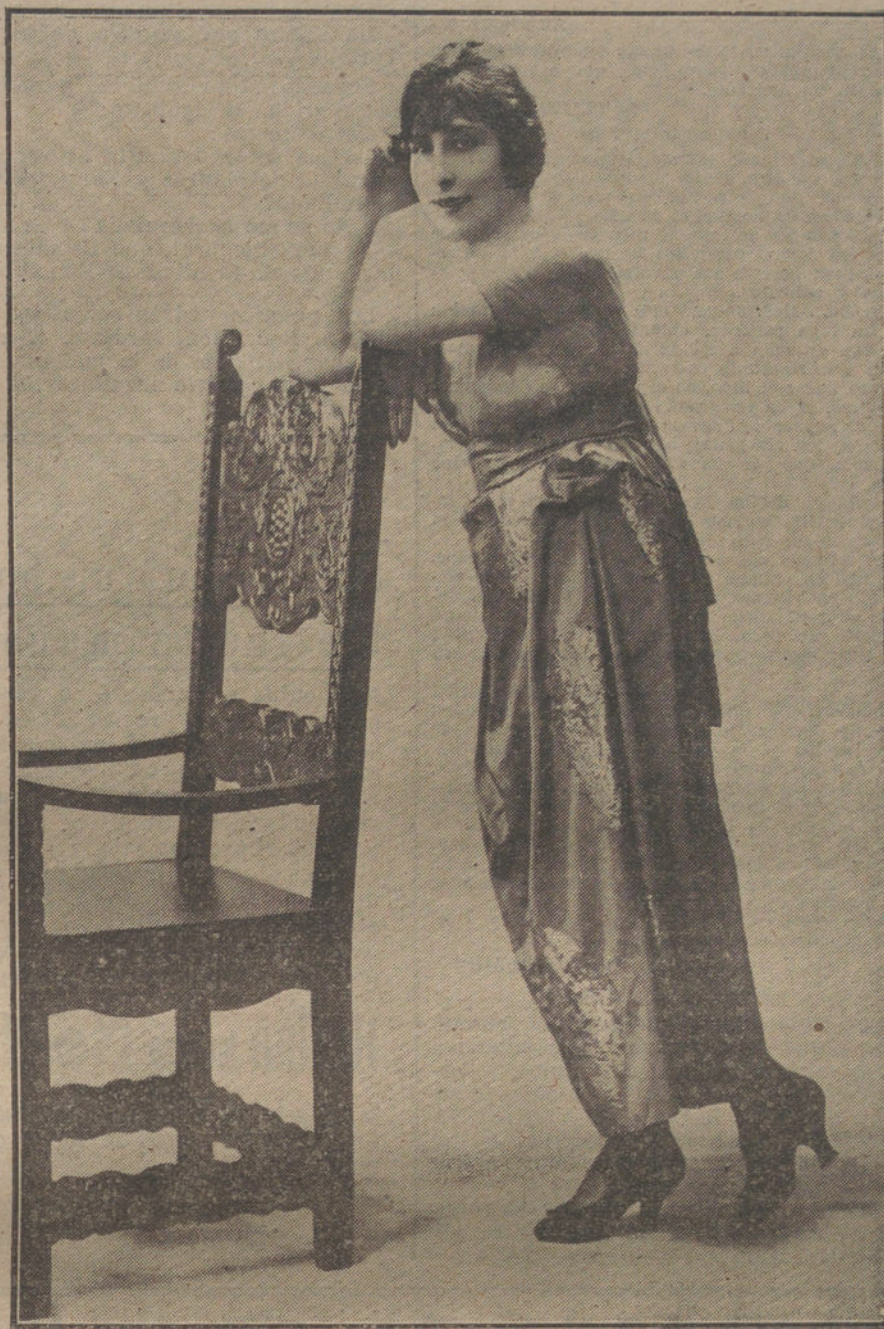
Traje de satén coral con aplicaciones en relieve de oro, presentado por la notable actriz francesa Gaby de Naval.

vió a los asistentes a la ceremonia religiosa un delicado «lunch».