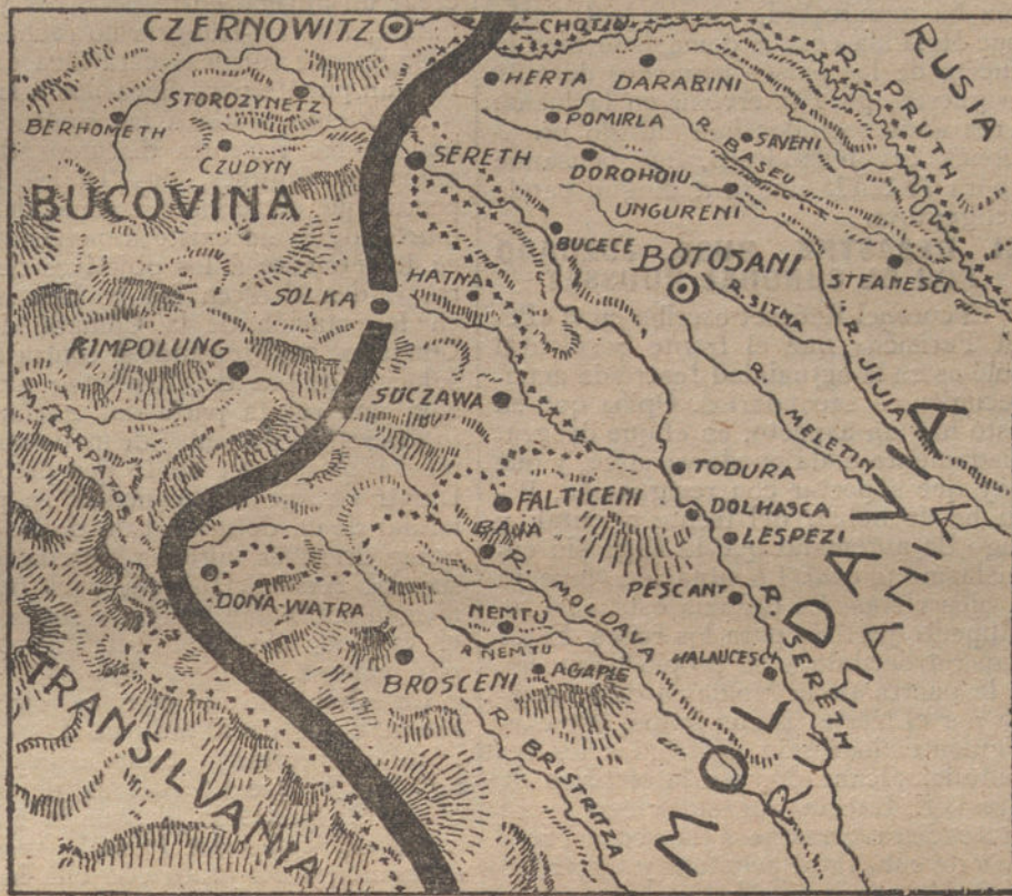
Campos de batalla de la Bucovina y Moldavia, donde actualmente están ocurriendo sangrientos combates.

vitza, rechazamos violentos ataques de varias unidades.