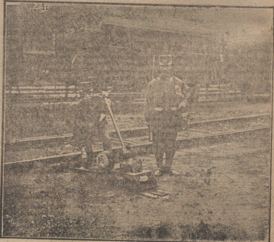
LA HUELGA FERROVIARIA EN SANTANDER. — Soldados al servicio del cambio de agujas.

En el depósito de máquinas de la estación de Francia, una locomotora ha arrollado a un empleado, que falleció al llegar a la Casa de Socorro.