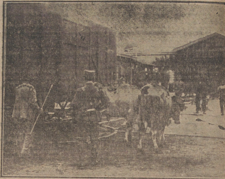
LA HUELGA DE FERROVIARIOS EN SANTANDER. — Soldados vigilando el traslado de vagones.

Un soldado del regimiento de Teatín. Rafael Campos, que estaba en un