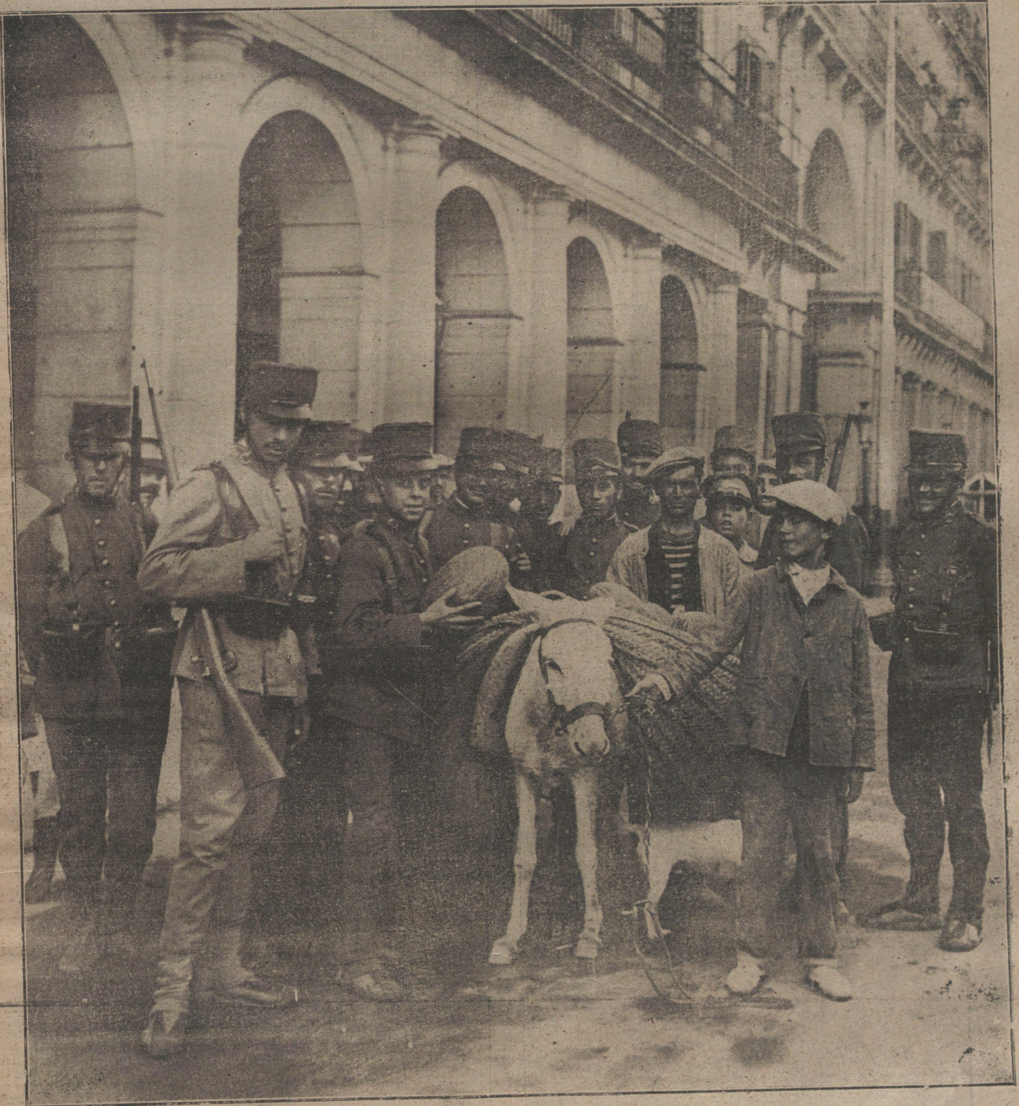
Soldados de Infantería, de vigilancia en la Plaza Mayor, comprando melones.