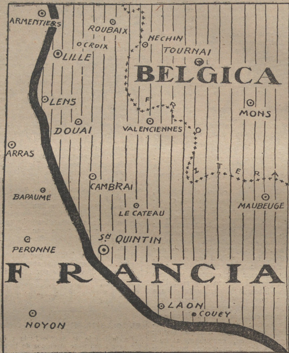
Zona ocupada por los alemanes en el Norte de Francia.

apoderaron de sus primeros objetivos, y continuando el avance, entraron en la aldea de Langemark, después de un combate encarnizado. Siguieron avanzando en continua lucha hasta una media milla más allá de la aldea, situándose en las trincheras enemigas, que constituan su objetivo final en la jornada.