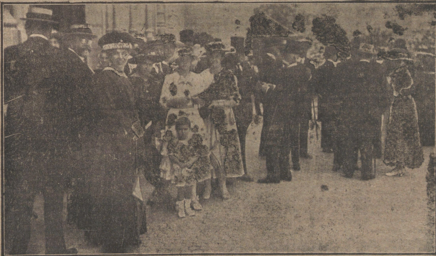
La colonia austriaca de Madrid, saliendo de la Iglesia de la Concepción, después de la función religiosa celebrada para conmemorar el cumpleaños del Emperador Carlos I.

Recogida por varios transeuntes fué llevada a la Casa de Socorro del Hospital, donde al ingresar falleció.