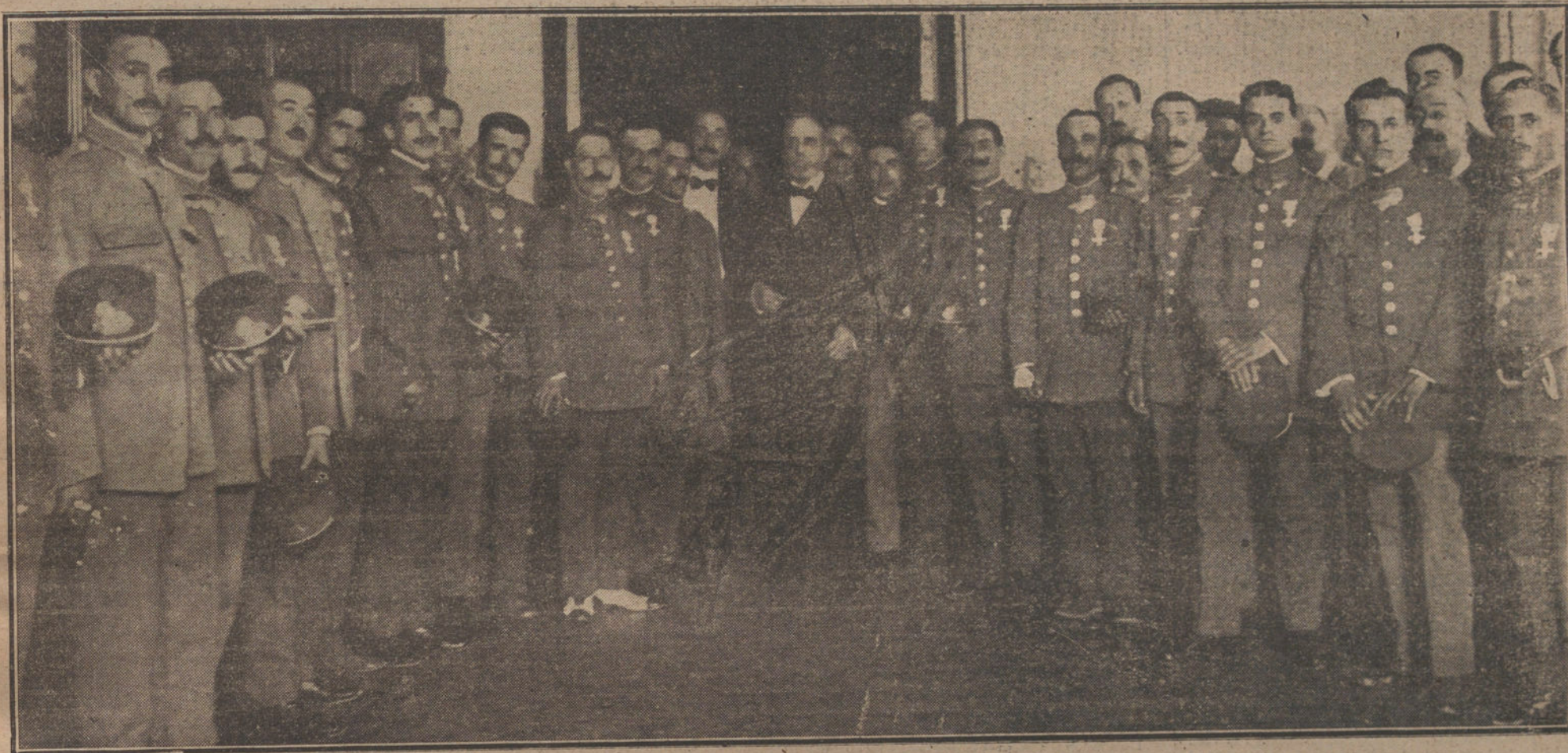
Los ministros de Gobernación y Fomento rodeados de los tranviarios que han sido condecorados por los servicios prestados durante la huelga.