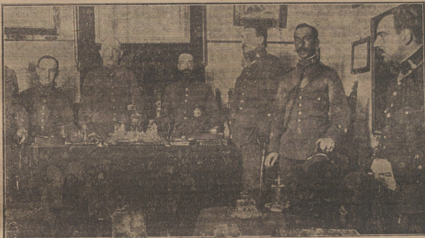
Consejo de guerra reunido esta mañana en el cuartel del Rosario para juzgar á los huelguistas que dispararon contra un centinela en la estación del Norte.

Vázquez inaugura la faena con un pase de rodillas muy valiente, y oye palmas abundantes. Sigue con pases altos, de pecho y molinetes soberbios. (Ovación.)