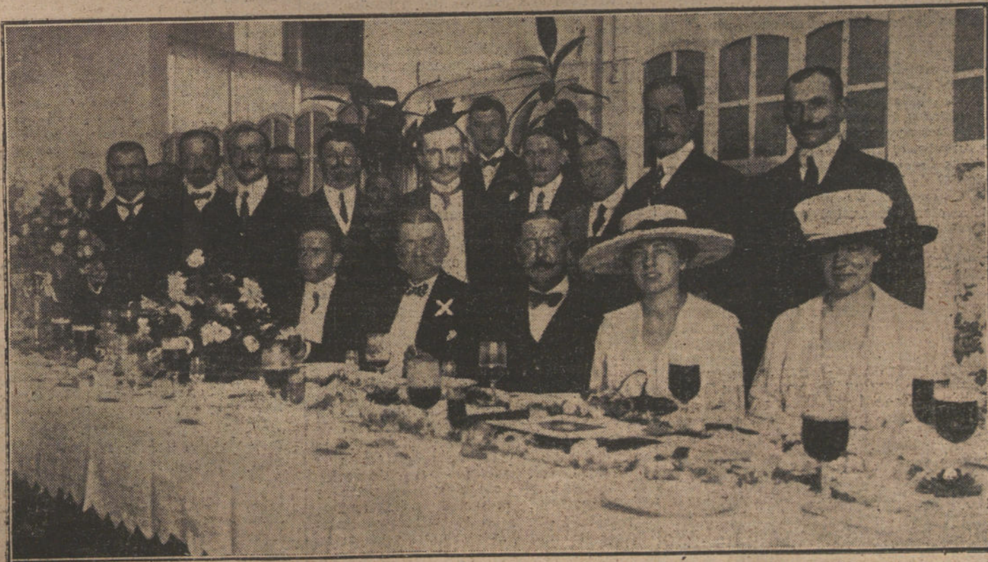
EL VERANO EN SANTANDER.—El embajador alemán (X) con sus hijas, las Princesas de Thurn y Taxis, durante el lunch que les ha sido ofrecido por la colonia alemana de dicha ciudad.

Representante exclusivo para España: J. A. de Landaluce. Alcalá, 99, Madrid.-Teléfono S-987