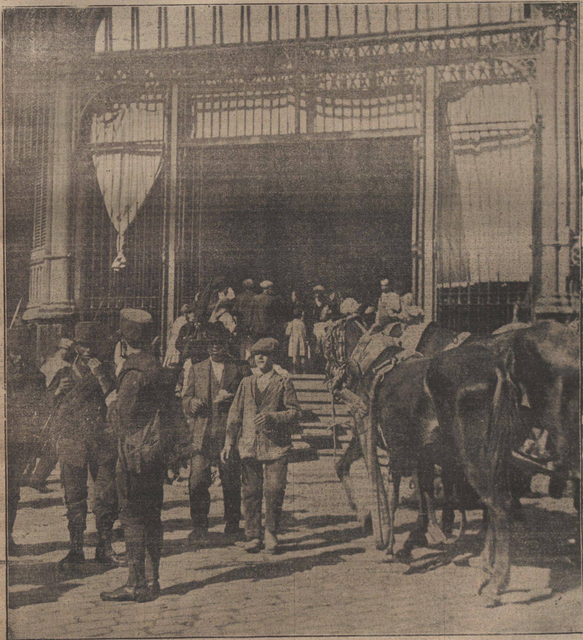
DESPUES DE LOS SUCESOS.—Aspecto de la plaza de la Cebada, custodiada por fuerzas del Ejército.