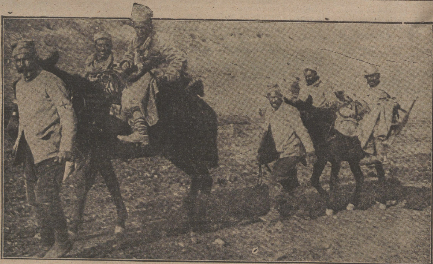
LAS VICTIMAS DE LA GUERRA.—Conducción de heridos en el frente balkánico.

En grave estado fué conducido el paciente al Hospital de la Princesa.