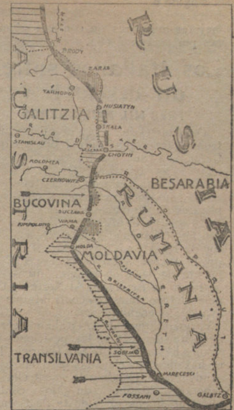
Situación de la línea de fuego en el frente oriental.

Las avanzadas alemanas situadas en Couriere y en la altura de Talou retrocedieron, según plan preconcebido, a la posición principal, mientras las baterías, lanzaminas y ametralladoras alemanas causaron terribles bajas al adversario, que seguía en compactas masas. Contra el inmovible cinturón de las posiciones principales alemanas rebotó el embite francés, con las pérdidas más sangrientas para el atacante. Sólo en algunos puntos, donde las compactas masas asaltantes francesas lograron atravesar la cortina de fuego alemana, pudieron en el primer empuje entrar en las posiciones de los alemanes, así como en el bosque de Avocourt, al Oeste de la altura 304, en el Hombre