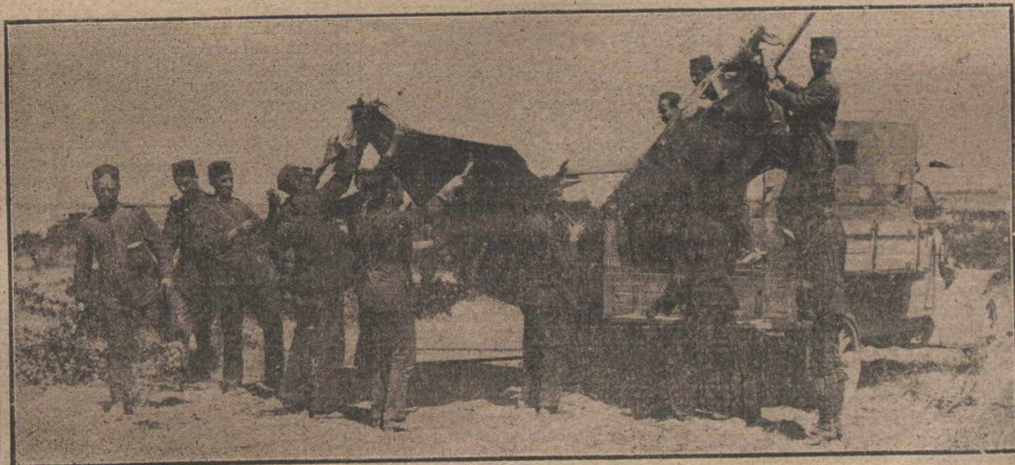
Traslado de los restos del aeroplano en un camión automóvil.