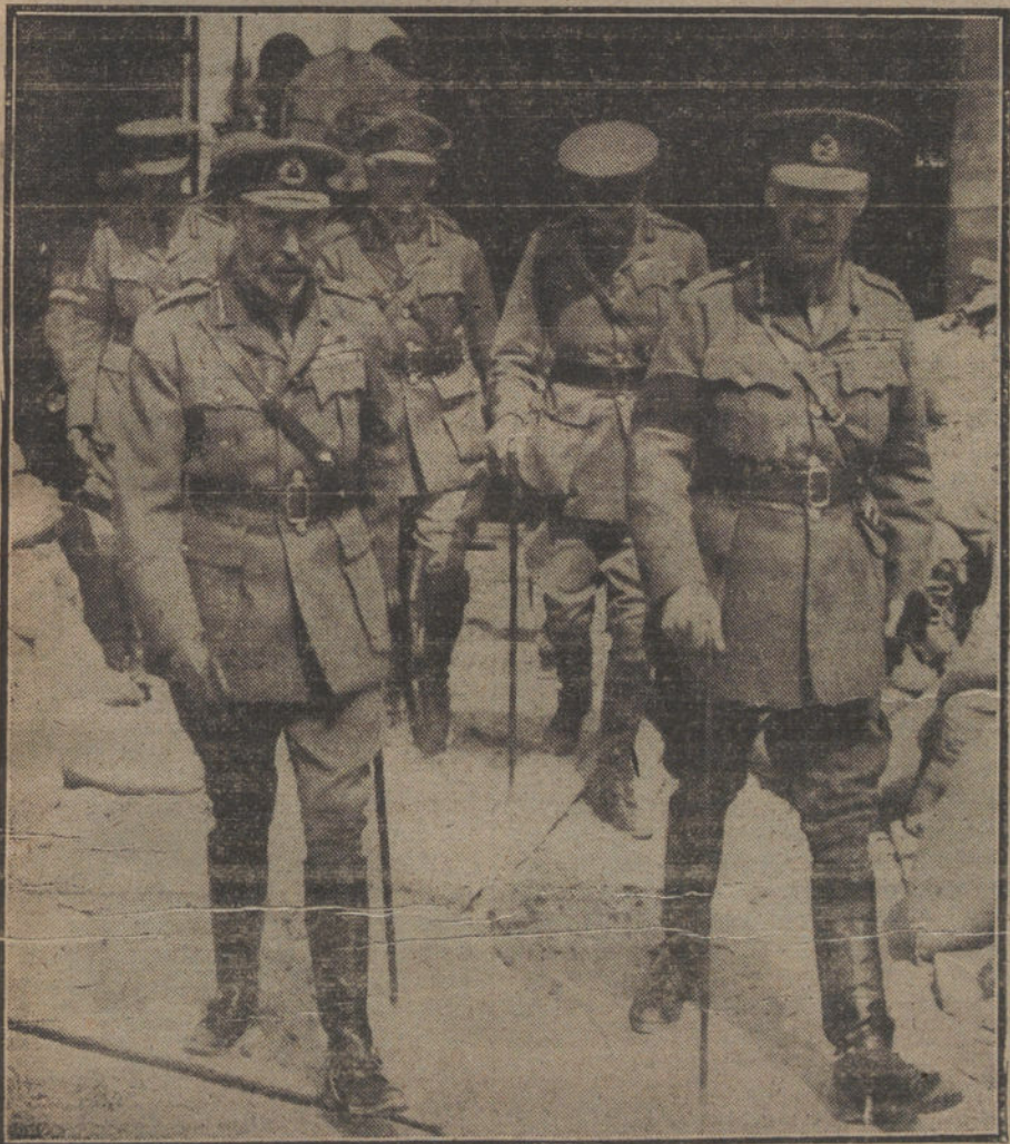
LOS SOBERANOS EN LA GUERRA.—El Rey de Inglaterra durante su visita al frente inglés.

ROMA. El homenaje á la memoria de Nazario Sauro ha revestido gran solemnidad. Al acto, que se verificó en el teatro de la Argentina, asistió todo el Gobierno y se pronunciaron patrióticos discursos.