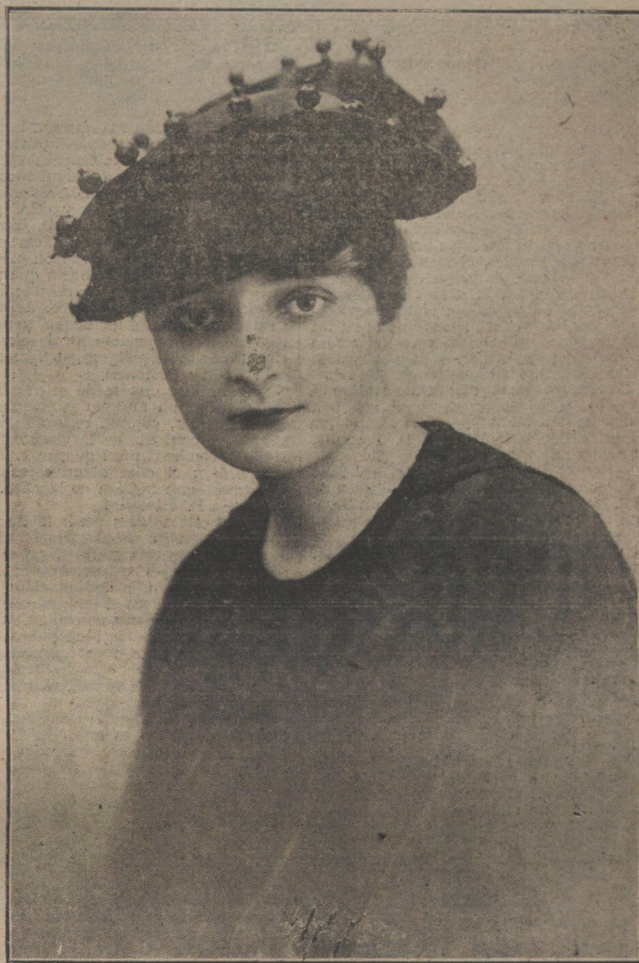
Pequeño sombrero de raso rojo, adornado con bolas de azabache, modelo de la Casa Eliane, de París.