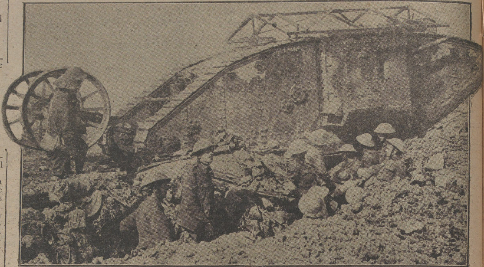
LAS ARMAS DE GUERRA. — Uno de los famosos tanques ingleses durante un descanso en la marcha.

Cabarrús, Cabaña de Silva, San Simón, Nienlant, Cabra, Guerrero, Argilo, Asmir, Figuerola, Fernandiba y Gracia Real.