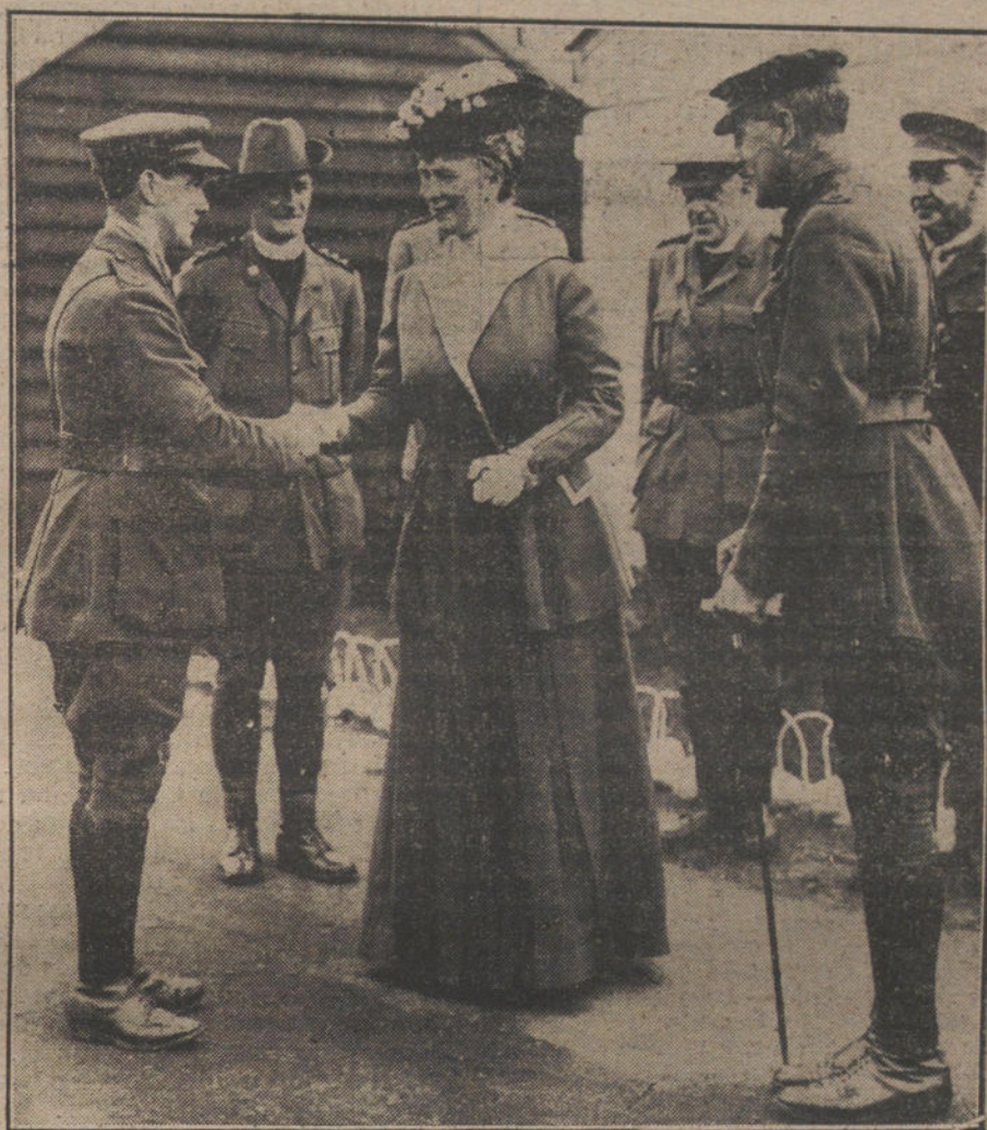
LA GUERRA EN FLANDES.—La Reina de Inglaterra felicitando á un aviador inglés durante la visita á los campamentos de Flandes.

No puede darse mayor nobleza. Alemania, vencedora, ocupante de grandes porciones de los territorios de sus enemigos, brinda una vez más á éstos ocasión para una paz honrosa, desprendiéndose de sus conquistas, en buena y ganadas. Frente á esa actitud, Inglaterra y Francia, que es visto no pueden, á pesar de sus máximos esfuerzos, derrotar al adversario, no sólo no cejan, sino que amenazan ridículamente, soberbiamente con apoderarse de tierra alemana, tejiendo á la vez torpes redes de carácter económico, para seguir fomentando el odio de todos los pueblos para después de la paz. Ello es prueba de que los aliados reconocen su impotencia mental, su menor cultura, su mayor atraso en las nobles artes del trabajo y el progreso para competir con Alemania. ¿Dónde está la libertad? ¿Qué idea tienen de ella los que tanto la muestran en los labios, cuando piensan en esos medios reaccionarios, inquisitoriales, vejatorios, para amedrentar con coacciones al libre comercio del mundo, pretendiendo imponerle los productos de su industria? ¿Es que creen