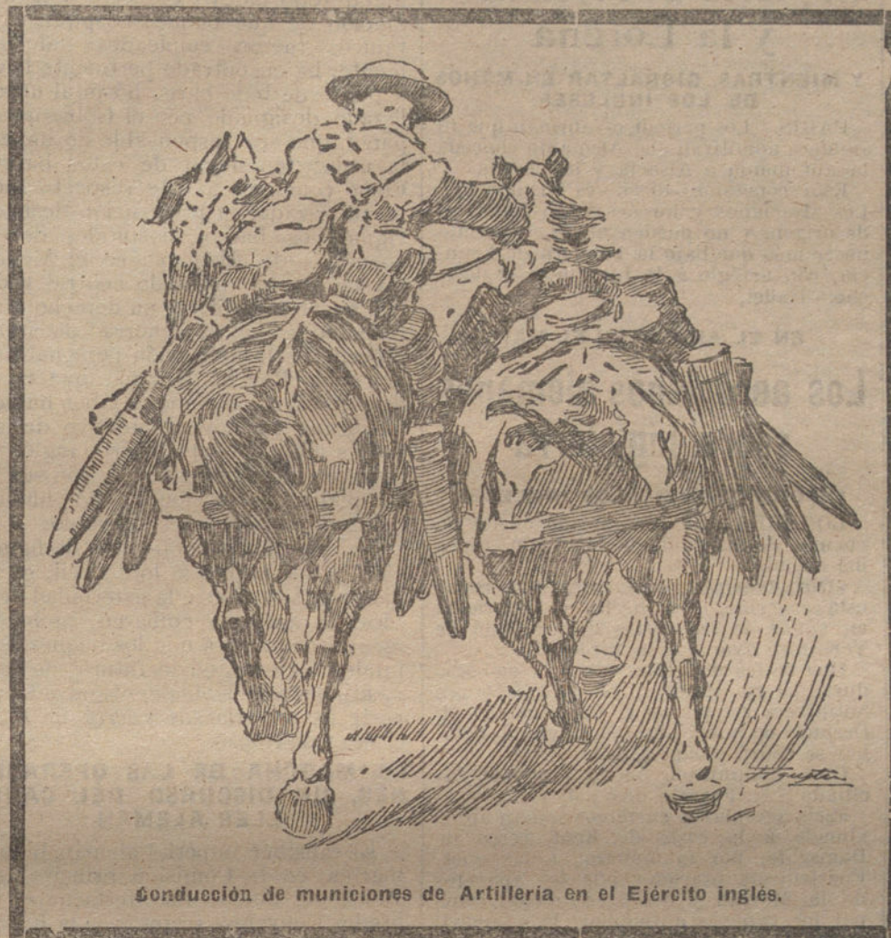
Conducción de municiones de Artillería en el Ejército inglés.

A pesar de no dolerles tanto, los franceses han abierto alguna vez la válvula de la sinceridad, para expresarse en sus periódicos sin rodeos engañosos, reconociendo la terrible gravedad del hecho. Recientemente un articulista de «La Victoire» ha dicho muy sensatas razones, comentando el daño, siempre más sensible, que en la economía de Francia supone aquella pérdida de la soberanía del mar por parte de Inglaterra, trasbordada ya, por así decirlo, á los submarinos alemanes. Pero aunque la lógica, el buen sentido, el frío y sereno razonar, que todo es uno, no tienen filiación política, prescindimos de parar mientes en ese artículo de un diario que alguien pudiera tildar de alarmista y populachero, y descansaremos nuestros juicios de hoy en los que recientemente ha expuesto el propio órgano oficioso del Gobierno francés, «Le Temps», cuyo tono, muy comedido y ponderado siempre, se ha hecho proverbial para merecer el calificativo de sesudo. Comentando el diario de París