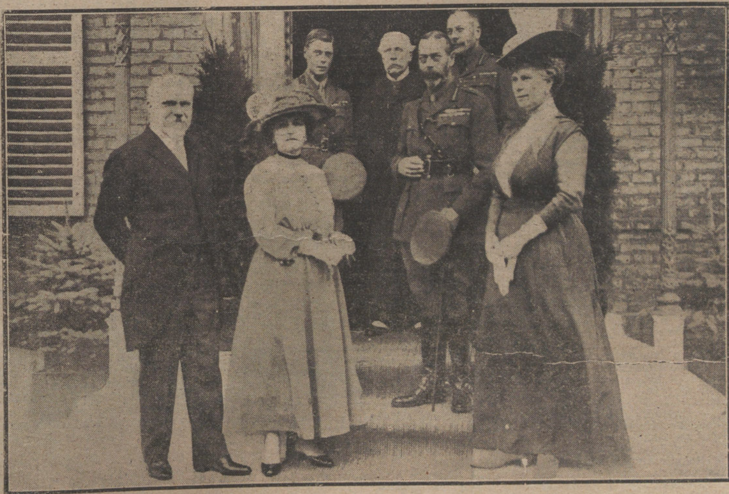
LOS JEFES DE ESTADO EN LA GUERRA.—Los Reyes de Inglaterra, acompañados del Presidente de la República francesa y su esposa, durante una de sus visitas al frente inglés.

Nos ponemos á comer lo que el camareño nos ha servido con gesto altivo y de mala gana. El camareño nos desprecia, sabe que no poseemos ninguna casa en Nueva York, mientras él